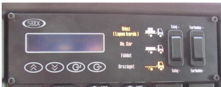
4/c. számú kép. A SILEX TIS vezérlőegysége (ECU) [6]