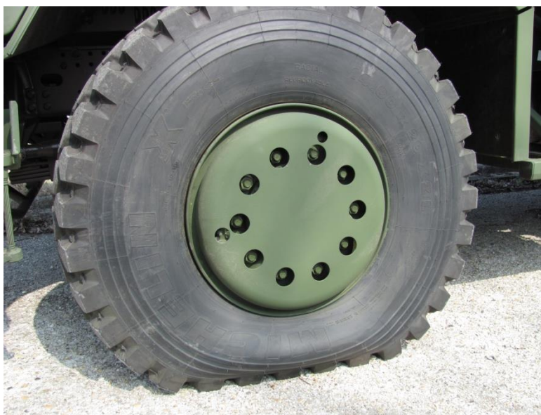
1. számú kép. Gumiabroncs-talajnyomás csökkentése a gördülőfelület megnövelésével.[6]

A Magyar Honvédség szerződése szerinti műszaki követelmény, hogy a terepjáró gépjárművek rendelkezzenek a vezetőfülkéből menetközben szabályozható központi kerékabroncs-nyomásszabályozó rendszerrel, és a szállítandó gépjárművek feleljenek meg az idevonatkozó NATO követelményeknek.[2]