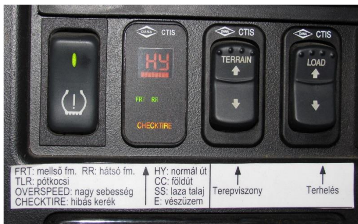
3. számú kép. DANA-SPICER DDM CTIS [6]

A 2008/9. évektől tapasztalható volt a CTIS tengerentúli beszállítójának termékprofil-váltása. A régebbi, jellemzően katonai alkalmazásra szánt abroncsöltő-rendszert egy polgári/civil felhasználásra is alkalmas CTI rendszer szállítása követte, amely hátrányosan hatott a RÁBA és a HM által megkötött hosszútávú szerződés és a megrendelések teljesítésére. Szükségessé vált más abroncsöltő berendezések beszállítóival felvenni a kapcsolatot, illetve felmerült egy hazai, magyar kerékabroncsöltő rendszer fejlesztése és alkalmazásának lehetősége is.