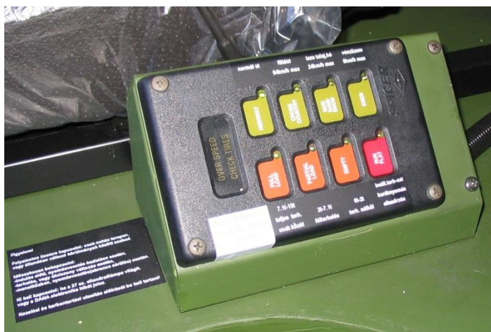
2. számú kép. DANA-SPICER ECU CTIS [6]

A katonai gépjárművek tömegadatait, a megrendelő által jóváhagyott műszaki specifikációk és a jármű típusbizonyítványok tartalmazzák.