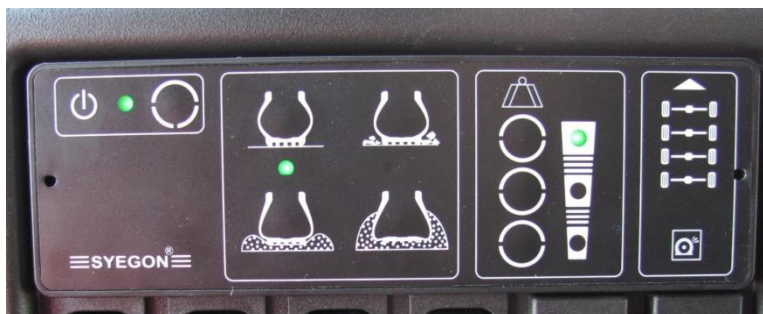
4/a. számú kép. A SYEGON CTIS vezérlőegysége (ECU) [6]

(vészüzemben a kerékabroncsot biztosító gyűrű és futó keréktárcsa egy egységben) vagy BEDLOCK (kerékabroncsot vészüzemben a tárcsára biztosító gyűrű) rendszer alkalmazása. (A kerék gumibroncsának beállított legalacsonyabb nyomásértéke 0,8 bar is lehet).