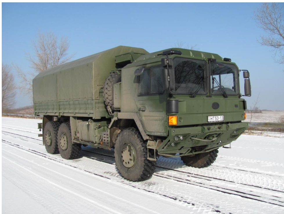
5. számú kép. Az egyik RÁBA H18.240DAEL-102 típusú jármű, amelyben az abroncstöltő-rendszer tesztelése végre lett hajtva a próbapályán (Écs - RÁBARING). [6]

A járművek abroncstöltő-rendszereinek „gázló-vizsgálatát” (a szállítandó C/III és C/IV osztályú gépjárművek legyenek képesek előzetes felkészítés nélküli, 1,2 m mély gázló leküzdésére. A gázlón történő áthaladás STANAG 2805 előírás 6. pontja szerinti sekély gázló átkelésre vonatkozik. [2]) a Mosoni-Duna Győr melletti folyamában, megfelelő biztosítással végeztük el (7. kép).