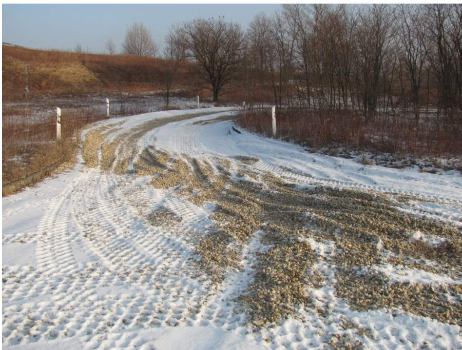
6. számú kép. A kavicságyas út, hossza: 1,4 km (Écs - RÁBARING).[6]