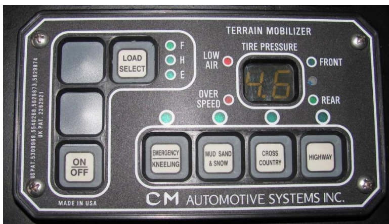
4/b. számú kép. A CMAS CTIS vezérlőegysége (ECU) [6]