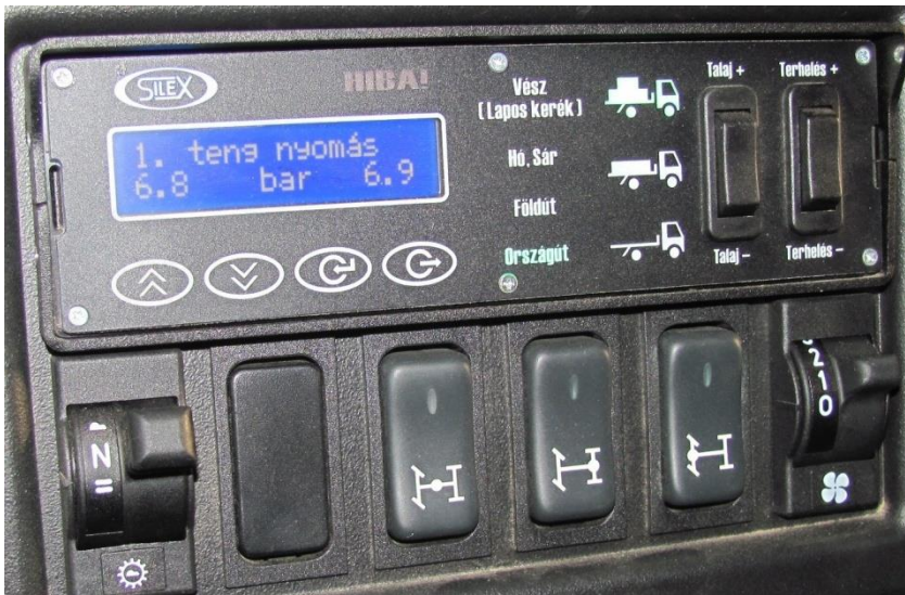
8. számú kép. RÁBA H14.240 típusú járműbe épített SILEX CTIS vezérlő egysége (a jármű 1. tengelyének mért abroncsnyomásait jelzi). [6]

A meghibásodási adatok és statisztikák ismeretében igazolhatónak tűnik, hogy a bemutatott vizsgálat és értékelés alapján kiválasztott SILEX abroncsöltő rendszerrel szállított, GBP III-IV. osztályú RÁBA-H típusú terepjáró gépkocsik a kezdeti gyermekbetegségek kiküszöbölése után megfelelnek a megrendelő által támasztott követelményeknek.