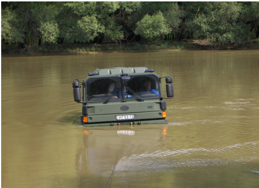
7. számú kép. Gázló-vizsgálat, a Mosoni-Duna Győr melletti folyamában, egy másik katonai jármű csörlőkötélével biztosítva.[6]