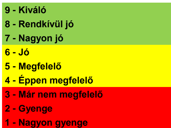
1. számú ábra. Az értékelő skála sávokra bontva, színekkel megkülönböztetve (piros/sárga/zöld)

A pontozó skálát a minősítés szempontjából három meghatározott súlyozható sávra lehet bontani (nem megfelelő – megfelelő – jó). Megjegyzem, a háromsávós skála megfelelő pontossággal (99%) alkalmas százalékban kifejezett, súlyozott értékelésre is.