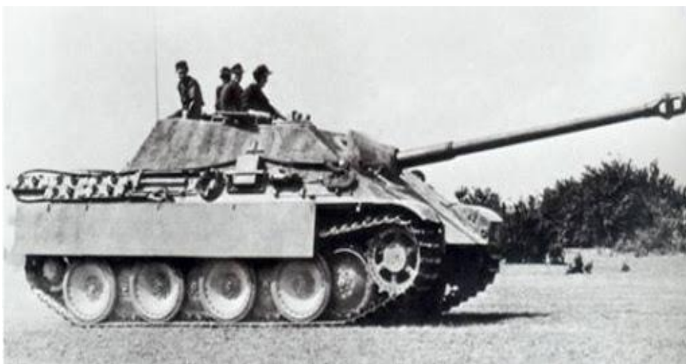
2. számú ábra. Német Jagdpanther V. páncélvadász [4.]

A német páncélvadászok egyik remek képviselője volt a 2. ábrán is látható Jagdpanther V.