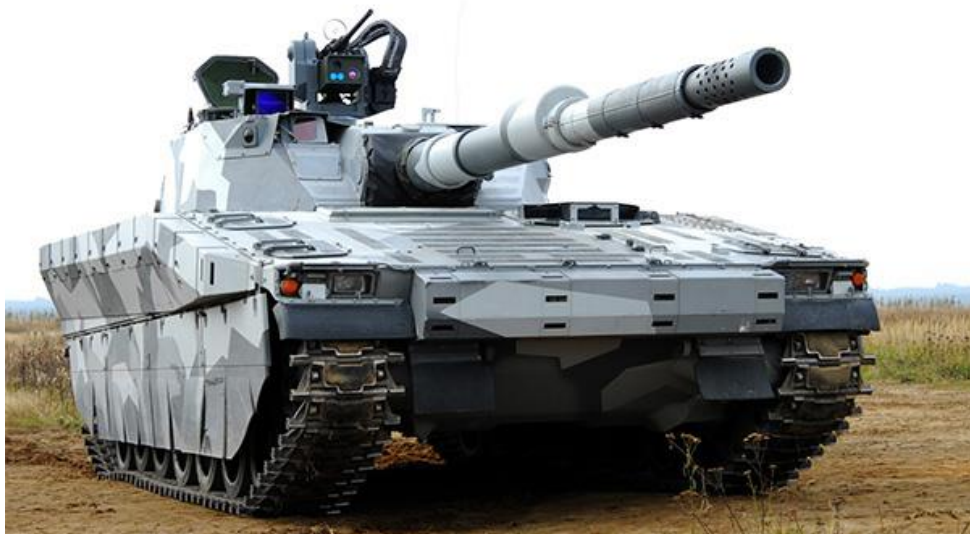
7. számú ábra. A svéd CV90120 könnyű harckocsi téli álcázósínben [10.]

Nagyon hasonlít a svédek által kidolgozott konstrukció is a törökök által gyártott harcjárműre. Itt a bevált CV90 harcjárműcsaládot vették elő alapnak, és erre terveztek egy olyan tornyot, melybe a 120 mm-es, a Swedish Ordnance által gyártott harckocsiágyút építették be, mint az a 7. ábrán is látható. Szembetűnő különbség a hagyományos harckocsiágyúkkal szemben, hogy az ágyú végén, az utolsó 70 cm-es szakasz csőszájfékként van kialakítva, hiszen a lövés reakcióerejét valamilyen módon csillapítani kell, hogy ne okozzon kárt a kisebb tömegű harcjármű alvázában.