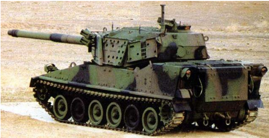
10. számú ábra. XM-8 Bufon könnyű harckocsi [17.]