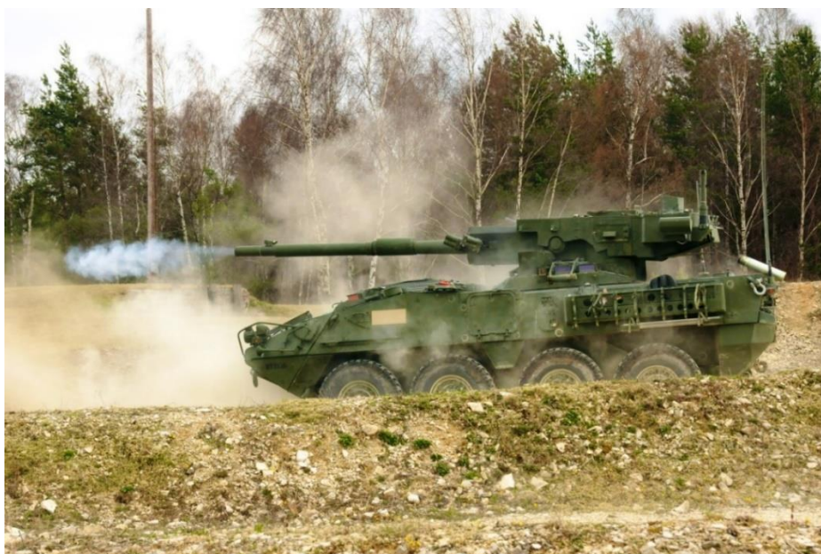
9. számú ábra. M1128 MGS lövés közben [15.]

nem került egyik fegyvernemnél sem, csak prototípus maradt belőle. Most úgy néz ki, az XM8 AGS gyártója ismét be szeretné hozni az eszközt a hadsereg állományába.