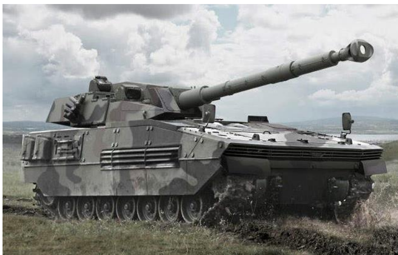
6. számú ábra. Otokar Tulpar könnyű harckocsi 105 mm-es harckocsiágyúval [9.]

Kelet-Ázsiában, ahol sok országban még mindig szegényesebb az épített infrastruktúra, az utak és egyéb közlekedési műtárgyak teherbírása jelentősen alatta marad egy nyugat-európai színvonalnak, ott is helye van ezeknek az eszközöknek. Ezt a piaci rést találta meg több gyártó is, így a török OTOKAR vállalat, amely a Tulpar lánctalpas harcjárművét, könnyű harckocsiját ajánlja ennek a régióknak alkalmazásra. A legendás M-113 páncélozott harcjármű alapjaira építkező harckocsi 105 mm-es huzagolt vagy 120 mm-es sima csövű harckocsiágyúval szerelhető fel, tömege azonban még így sem haladja meg a 40 tonnát, amely egy korábbi közepes harckocsi tömegével egyezik meg (6. ábra).