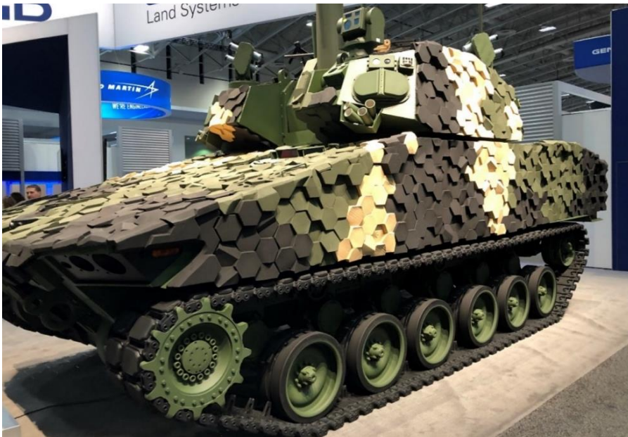
11. számú ábra. Griffin könnyű harckocsi speciális kerámia-kompozit páncélja [18.]

Az XM-8 Bufon könnyű harckocsi sok újdonságot nem mutat a majd 20 évvel ezelőtti prototípushoz képest, viszont a 28 tonnás össztömegű Griffin már alkalmazza a kor technológiai vívmányait, eredményeit, és egy különleges kialakítású kerámia-páncélzattal jelent meg, mely aktív védelmi rendszerekkel is kiegészítésre került. A Griffin-torony kialakítása hasonlít az Abrams harckocsiéra, emiatt „mini Abram-snak” is becézik, hiszen a harckocsi ágyúja majdnem megegyezik annak 120 mm-es sima csövű ágyújával.