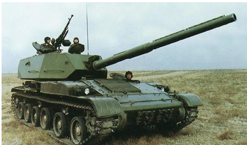
5. számú ábra. Type-89 kínai vadászpáncélos [8.]

Kelet-Ázsiában, ahol sok országban még mindig szegényesebb az épített infrastruktúra, az utak és egyéb közlekedési műtárgyak teherbírása jelentősen alatta marad egy nyugat-európai színvonalnak, ott is helye van ezeknek az eszközöknek. Ezt a piaci rést találta meg több gyártó is, így a török OTOKAR vállalat, amely a Tulpar lánctalpas harcjárművét, könnyű harckocsiját ajánlja ennek a régióknak alkalmazásra. A legendás M-113 páncélozott harcjármű alapjaira építkező harckocsi 105 mm-es huzagolt vagy 120 mm-es sima csövű harckocsiágyúval szerelhető fel, tömege azonban még így sem haladja meg a 40 tonnát, amely egy korábbi közepes harckocsi tömegével egyezik meg (6. ábra).