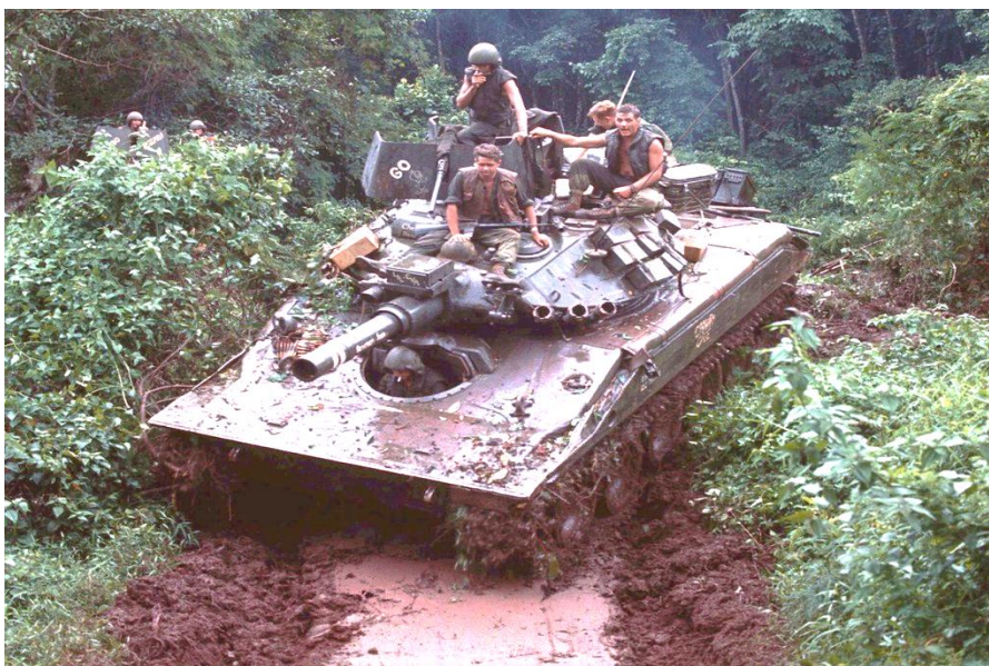
8. számú ábra. M551 Sheridan Vietnámban [14.]

könnyű harckocsija M551 Sheridan néven egészen 1997-ig. [12., 50.o.] Sikerrel alkalmazták Vietnámban, lásd a 8. ábrát, és az első Öbölháborúban is, és mégis, alapvetően a könnyű lánctalpas harcjárművek 8x8 kerékképletű kerek harcjárművekre történő váltása, illetve az M1 Abrams harckocsikkal megelégedett vezetők döntése miatt, megszűnt annak alkalmazása. Tették ezt annak ellenére is, hogy az Abrams harckocsik stratégiai, de akár taktikai mobilitása nagyon korlátozott, hiszen a szintén több mint 70 tonnás eszközök szállítására a C-17 szállítógép még éppen megfelel, és a C-5 Galaxy nehéz teher szállító repülőgép is csak kettőt tud belőle egyszerre elszállítani.[13.] Ezen felül vannak olyan, a korábban is emlegetett földrajzi körzetek amelyek akár potenciális ellenséges területként is jelentkezhetnek, ahol ezek az eszközök csak jelentős logisztikai erőfeszítések árán üzemeltethetők, mozgathatók.