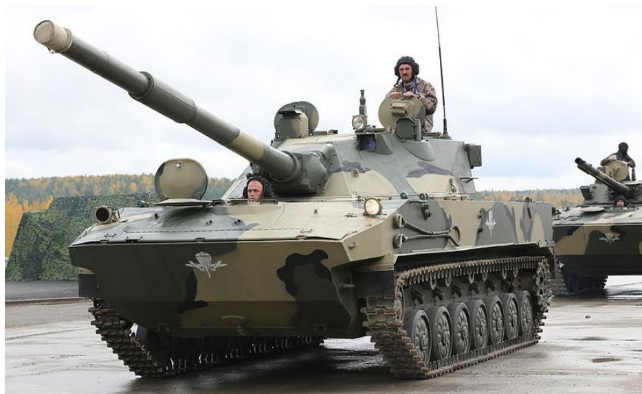
4. számú ábra. 2SZ-25 „Szprut SZD” orosz légideszant harckocsivadász [7.]

Nincsen ez másképpen napjainkban sem, amikor az orosz tervezőasztalról olyan harcjármű és annak továbbfejlesztett változatai jelentek meg, mint a 2000-es évek elején debütált 2SZ-25 páncélvadász, avagy az orosz terminológia szerinti légideszant harckocsivadász 8 (4. ábra).