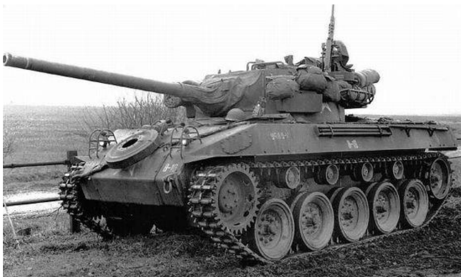
3. számú ábra. M18 Hellcat páncélvadász harcjármű [5.]

Nincsen ez másképpen napjainkban sem, amikor az orosz tervezőasztalról olyan harcjármű és annak továbbfejlesztett változatai jelentek meg, mint a 2000-es évek elején debütált 2SZ-25 páncélvadász, avagy az orosz terminológia szerinti légideszant harckocsivadász 8 (4. ábra).