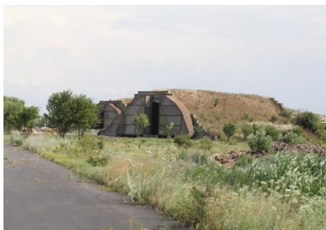
5. számú ábra. Repülőgép-fedezék Kunmadarason 13