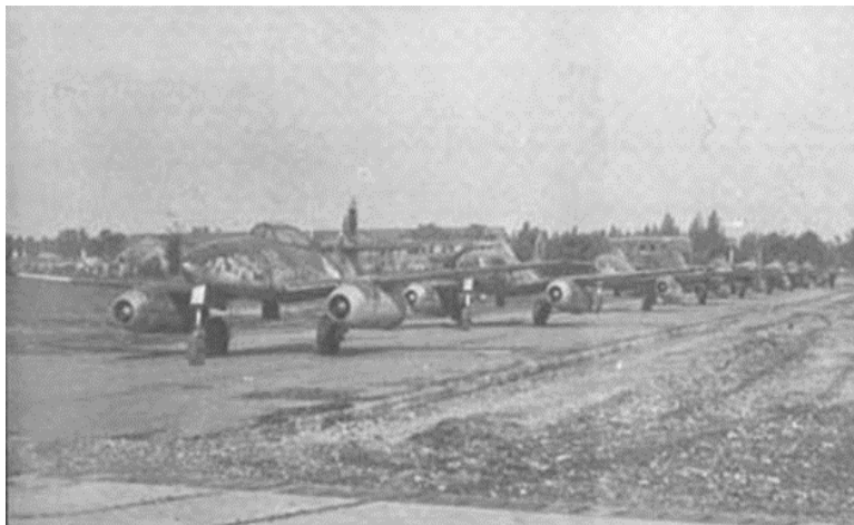
4. számú ábra. A Lechfeld repülőtérén lefoglalt Me 262-esek 1945 júniusában, a franciaországi Melunba költözésük előtt, ahonnan az USA-ba szállították őket. 12

hidegháború az elhidegülésről, elzárkózásról, a másik fél folyamatos megfigyeléséről és a versengésről szólt minden létező területen. 11