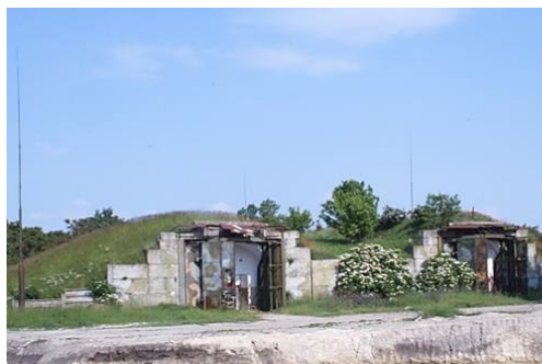
6. számú ábra. Gránit típusú tároló Kiskunlacházán 14

Az ellenséges felderítéseken túl védeni kellett a II. és III. generációs repülőgépek fedélzeti rendszereit a meteorológiai viszonyok viszontagságai ellen is. A különböző védelmi igények kielégítésére olyan fedezékek építésébe kezdtek, melyek kiváló védelmet nyújtottak az akkor használatos bombák és rakéták ellen is.