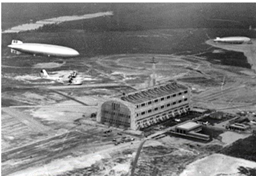
1. számú ábra. 1936. május 9.: a Hindenburg érkezése Amerikába. A háttérben az USS Los Angeles amerikai léghajó 5

A huszadik század első évtizedében a léghajók uralták az eget. Az akkor még gyerekcipőben járó repülőgépeknél lényegesen nagyobb távolságot tudtak megtenni, valamint utasok szállítása mellett háborús célokra is alkalmasak voltak. 2 A német hadsereg szinte a kezdetektől érdeklődött a léghajók iránt. Mire kitört az első világháború, már számos példány szolgált a hadseregben, mert kiválóan alkalmas volt személy- és teherszállításra, de alkalmasak voltak felderítő feladatok és bombázások végrehajtására is. 3 Ezek az eszközök hatalmas méretűek voltak, 4 emiatt nagy hangárépületre és állóhelyekre volt szükségük, valamint a repülőtereket úgy alakították ki, hogy a megközelítésük bal- és akadálymentes legyen. (1. ábra)