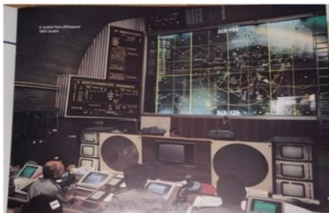
8. számú ábra. A VSZ-11M rendszerrel felszerelt veszprémi harcálláspont 16

A fentiekén kívül a repülőterek területén gyakran irányító tornyokat alakítottak ki, valamint földalatti harcálláspontokat építettek, amelyek között nem egy az atomcsapás ellen is védett. (8. ábra) Ezek egy részét később a repülőterektől távolabb helyezték el, a nehezebb feldejtés, valamint a repülőteret ért támadás esetén azok sérülésének csökkentése érdekében.