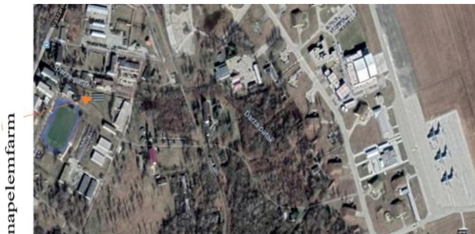
10. számú ábra. Pápa Bázisrepülőtér egy része madártávlatból 18

Ezekre jó példa a 10. ábrán látható Pápa Bázisrepülőtér, valamint a Szolnok Helikopterbázis, amelyek területén polgári célokat is szolgáló napelemfarmok kerültek telepítésre.