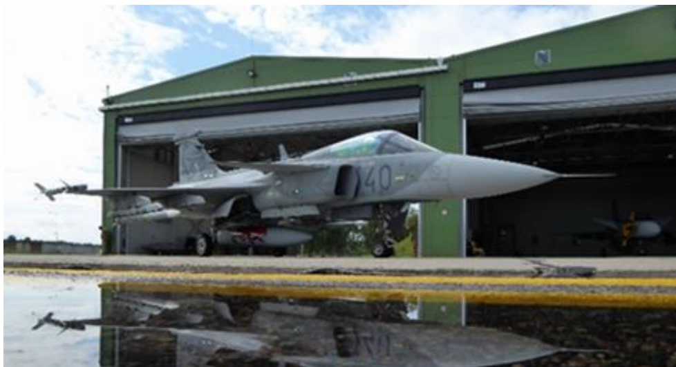
9. számú ábra. Könnyűszerkezetes hangárépület a Baltikumban 17

Ezekre jó példa a 10. ábrán látható Pápa Bázisrepülőtér, valamint a Szolnok Helikopterbázis, amelyek területén polgári célokat is szolgáló napelemfarmok kerültek telepítésre.