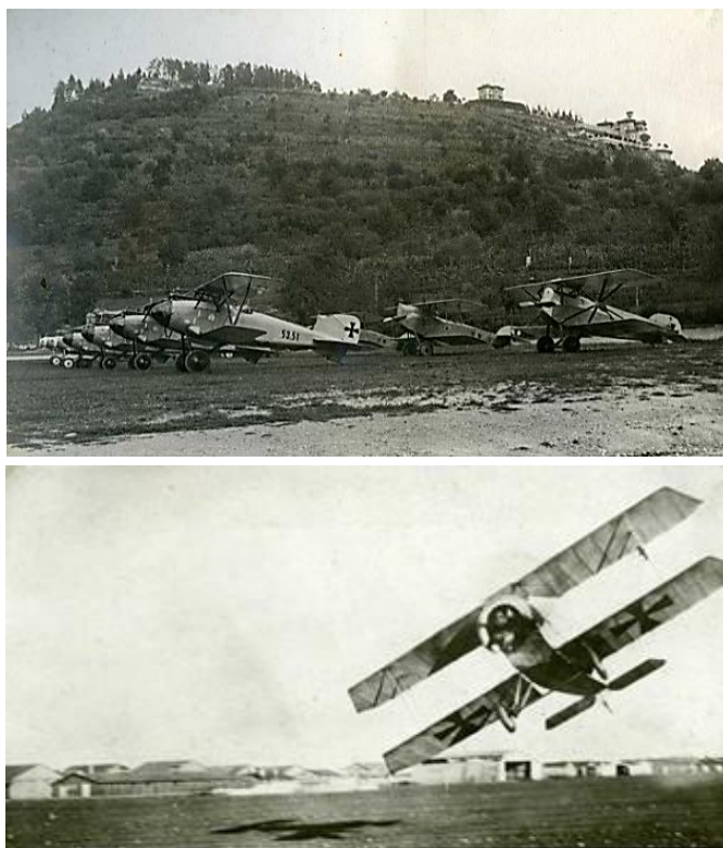
2. számú ábra. Az Osztrák-Magyar Monarchia egy repülőszázadának repülőtere és kialakítása 6

A léghajók - lassúságuk, nagy méretük és rendkívüli sebezhetőségük miatt - háborús szerepe lecsökkent, ellentétben a repülőgépekkel, amelyek alkalmazása rohamosan elterjedt. Harcászati alkalmazásuk egyre hatékonyabbá vált, amely a robbanásszerű haditechnikai fejlesztéseknek és újításoknak volt köszönhető. A repülőgépek számának és hatótávolságának növekedése miatt szükségessé vált olyan bázisok létesítése, amelyek képesek voltak az elhelyezési, az üzemeltetési, a raktározási feltételeket biztosítani, valamint megfelelő védelmet nyújtottak a személyi állomány, a raktárak és a földön lévő repülőgépek számára. Ezzel megkezdődött a katonai repülőterek kialakítása és folyamatos fejlesztése, párhuzamosan a repülés technikai fejlődésével és a harcászati igényekkel. A légi erő önálló fegyvernemmé válásával a fejlesztések felgyorsultak.