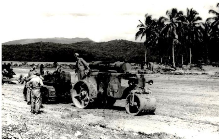
3. számú ábra. Tengerészeti utászok repteret építenek a Salamon-szigetek egyik pontján 8

„A második világháború során a légi hadviselésben új korszak kezdődött. Megjelentek a sugárhajtású repülőgépek. Az első ilyen gép a He 178 volt, amely 1939. augusztus 27-én szállt fel első ízben. A németek csak 1944-ben kezdték meg a Me 262 sugárhajtású gép sorozatgyártását.” 9 Ennek a típusnak az üzemeltetéséhez már ajánlott volt a szilárd burkolatú fel- és leszállópálya a futóművek kialakítása és a hajtóművek elhelyezkedése miatt. Erre egy példa a 4. ábrán látható.