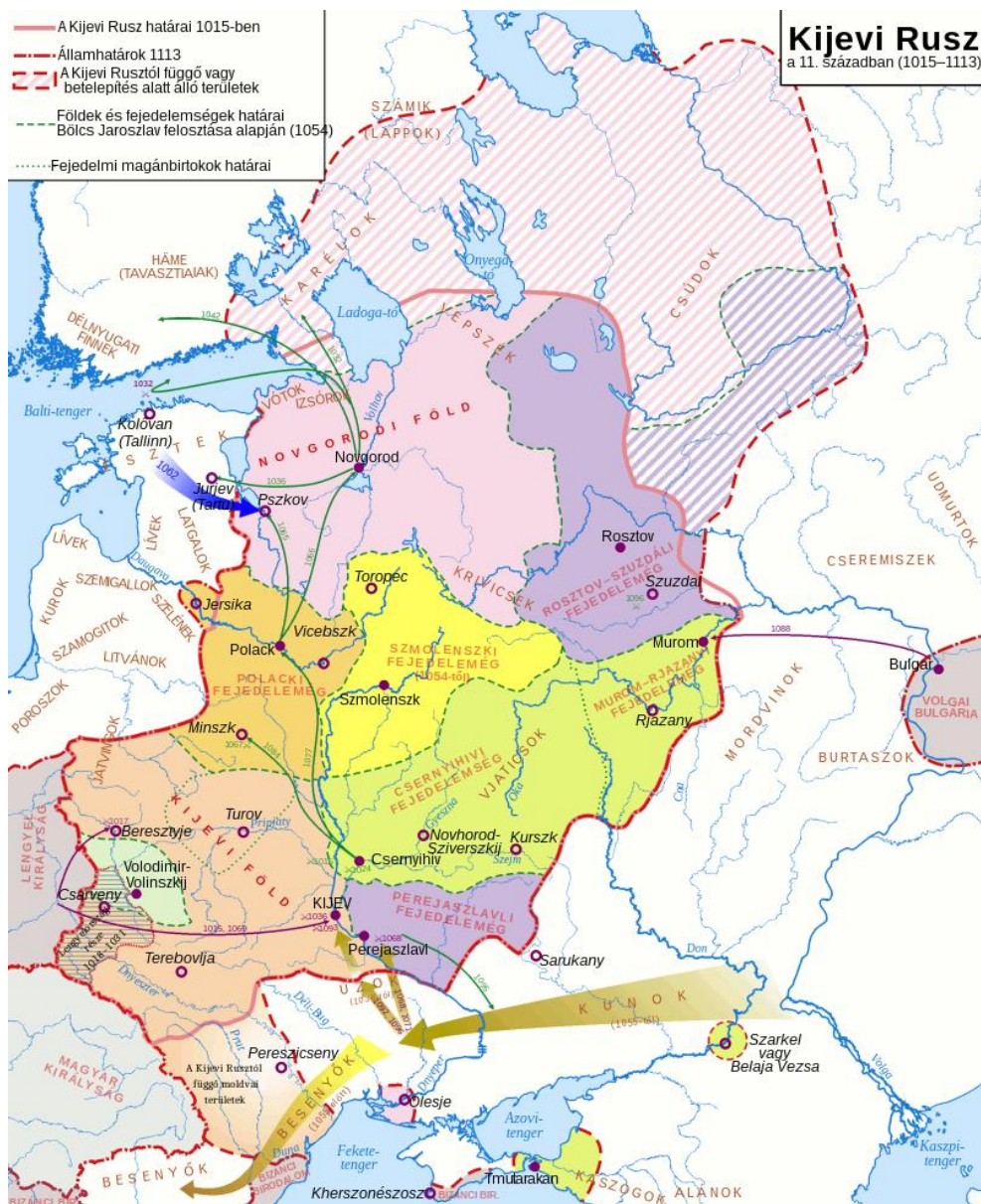
2. számú ábra. A Kijevi Rusz a 11. században és a délről Kijev felé irányuló kun és besenyő támadások

sztyeppéken a 12. században a kunok éltek a Dnyeper mentéig, lovas nomád portyáik Kijevig hatoltak. A Dnyeper menti területeken – így a Zaporozsje térségében található zúgóknál megtelepedett (illetve honos) lakosság keveredett a sztyepei népekkel (és átvette lovas harcmódorukat) és a későbbi kozákság egyik alapját képezte, miközben halászáttal és különösen hajózással, hajóépítéssel kapcsolatos ismeretei is gyarapodtak.