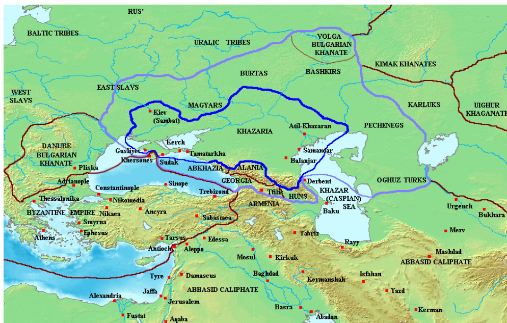
1. számú ábra. A Kazár Birodalom 820 körül: a közvetlen kazár uralom – azon belül Kijev városa – sötétkék, a befolyási zóna lila, más határok sötétvörössel jelölve 9

A kazárokat Szvjatoszláv, a Kijevi Rusz uralkodója 965-ben legyőzte, de a birodalom maradékát csak a 11. század elején számolta fel végleg Bizánc.