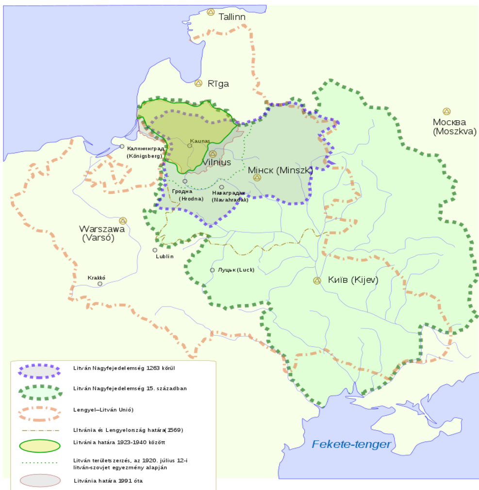
3. számú ábra. Ukrajnában a lengyel jelenlét 1370-1795 között négy-száz éven át folyamatos (és a nyugati területeken 1922-1939 között is folytatódik)

Báthory István 1576-1586 között volt Lengyelország királya. Lengyel uralkodóként hozta létre a lajstromozott katonáskodó kozákság intézményét az 1578 szeptemberében kiadott „Egyezmény a szics-kozákokkal” elnevezésű adómentességi kiváltságot biztosító rendeletével. „A lengyel-litván uralkodóknak és birtokosoknak elemi érdekük volt a déli határok védelme az ismétlődő török hadjáratok és állandó tatár betörések ellen, ezért a kozákokból próbáltak szervezett határvédelmi erőt kialakítani. Az első sikeres lépés Báthory nevéhez fűződik, aki 1582-ben 6000 kozákot vett állami szolgálatba. A hajdúkhoz hasonlóan ezek a „lajstromozott kozákok” mentesültek az egyházi