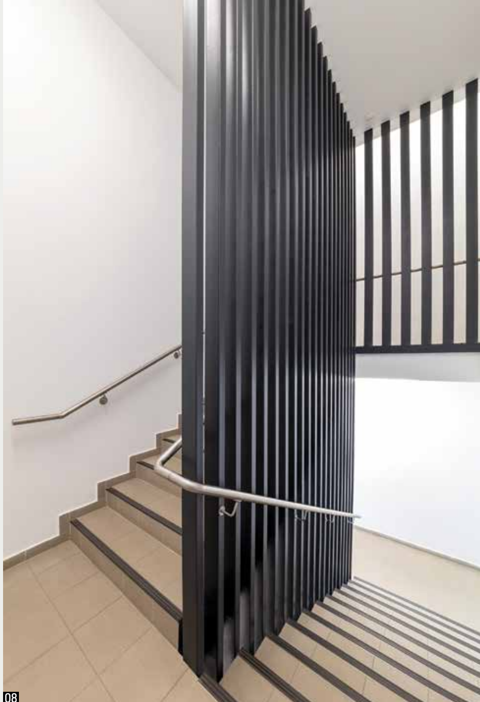
08 A lépcsőház terét a vertikális rácsozás osztja részekre