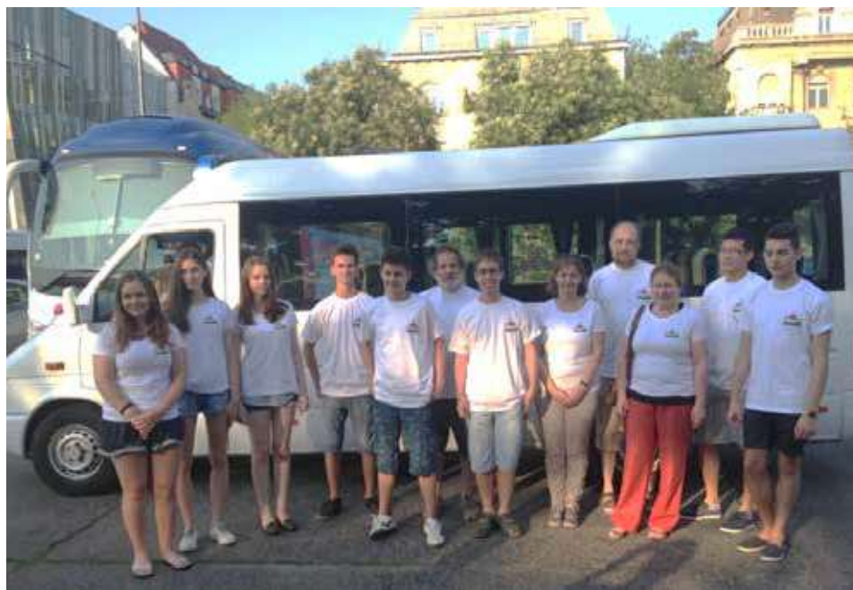
2015. Indulás Blagoevgradba