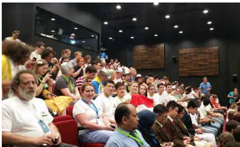
2015-ben Blagoevgradban, ekkor még nem tudtuk, hogy hamarosan Magyarország is az érmesek között lesz

Középiskolában sokszor hirdették nekünk a Nyelvészeti Diákolimpiát. Sajnos ennek végzős évemig ellenálltam. De tizenkettedikben (2019) megoldottam a mintafeladatokat, és a lelkesedésem azóta sem hagyott alább. Abban az évben padtársammal azaz szórakoztunk, hogy feladatokat készítettünk egymásnak általunk ismert nyelvekre alapozva. Azóta is nagyon szeretek nyelvészeti feladatokat készíteni és oldani is. A diákolimpia egy izgalmas világba vezetett be engem, amiért nagyon hálás vagyok.