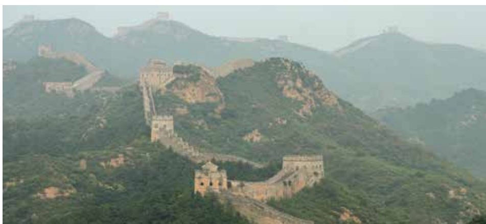
4. ábra. A kínai nagy fal