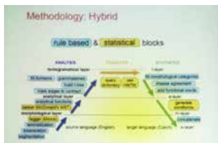
1. ábra. Hibrid gépi fordítórendszer

A szakmai programok és munka mellett jutott időnk felfedezni Pekinget is, ahol a méretek más dimenziójúak. Amikor második alkalommal követtük el azt a hibát, hogy