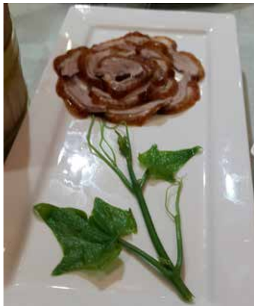
7. ábra. A pekingi kacska

Még sorolhatnánk a bábszínház-as teaházat; a kínai misét; a lótuszos tavon lévő csónakázást és vacsorát; az első olyan élményt, amikor kesztyűs kézzel toltak be a zsúfolt metróba, vagy a túlszúfolt buszban még hangszóróval kiabáltak a fülünkbe, hogy menjünk beljebb, mert felszálló van; a tiltott város látványát; a sok random emberrel való szelfit; a kávéra való vadászatot (nagy nehezen találtunk egy mekit, amiben volt egy kávégép, de hárman sem tudták működésre bírni); vagy a kínai rokonainkkal való közös vacsorákat.