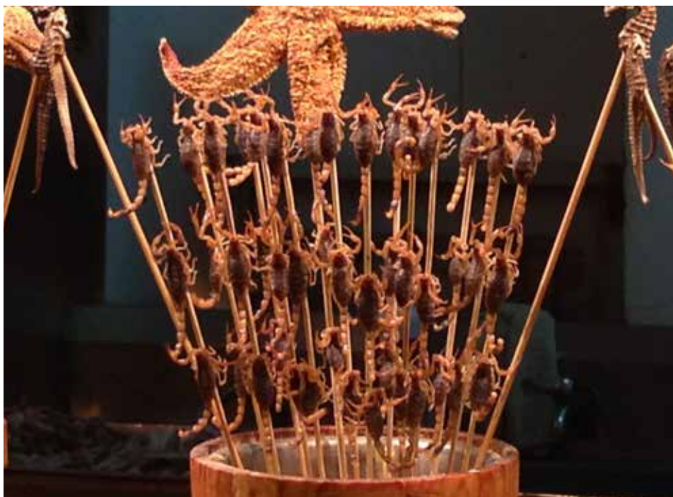
5. ábra. Skorpiók pálcán