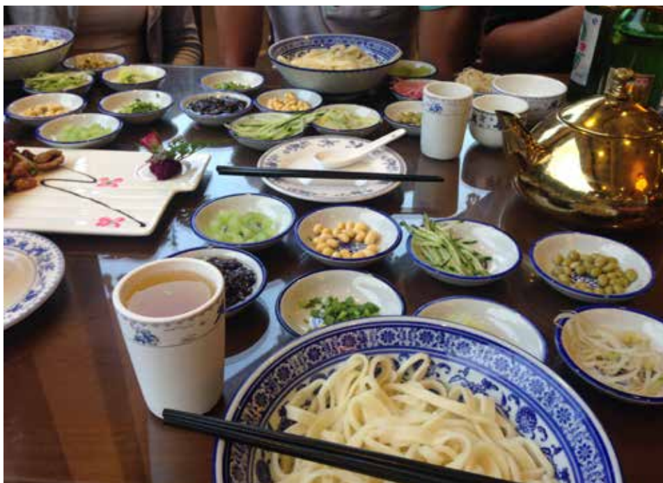
6. ábra. Az eredeti (állítólag) pekingi tészta