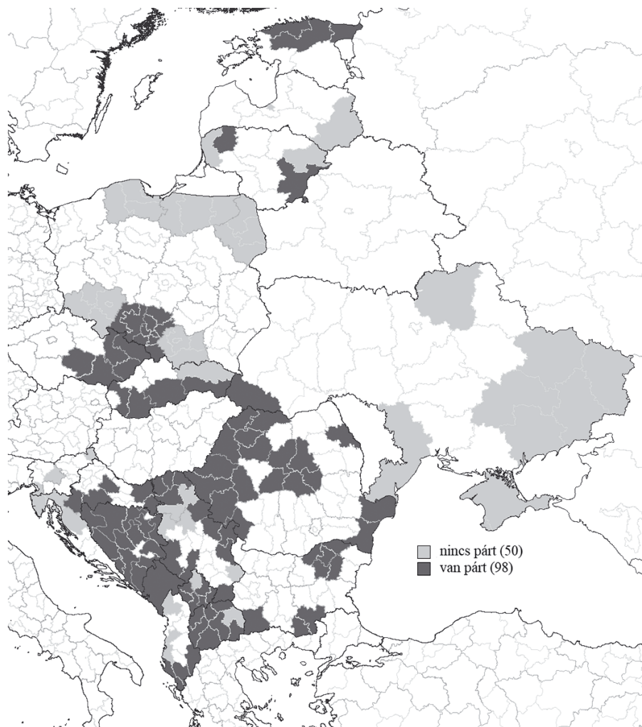
1. ábra. Etnoregionális közösségek elhelyezkedése Kelet-Közép-Európa NUTS 3 régióiban.

Az etnoregionális közösségek azonban nem szükségszerűen rendelkeznek politikai képviselettel, illetve a választásokon való megmérettetés igényével (Chandra, 2011; Urwin, 1982), választhatják az érdekérvényesítés más formáját, illetve lehetnek politikai értelemben teljesen szervezetlenek is. A pártokról korábban elfogadott definíciónak – bármely, választáson induló szervezet – megfelelően a választási adatok áttekintése nemcsak az országos (parlamenti, elnöki), hanem lehetőség szerint az alacsonyabb területi szinteken is szüksé-