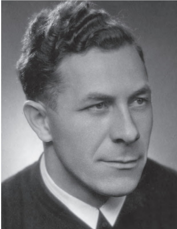
Hites Kristóf (1913–1999)