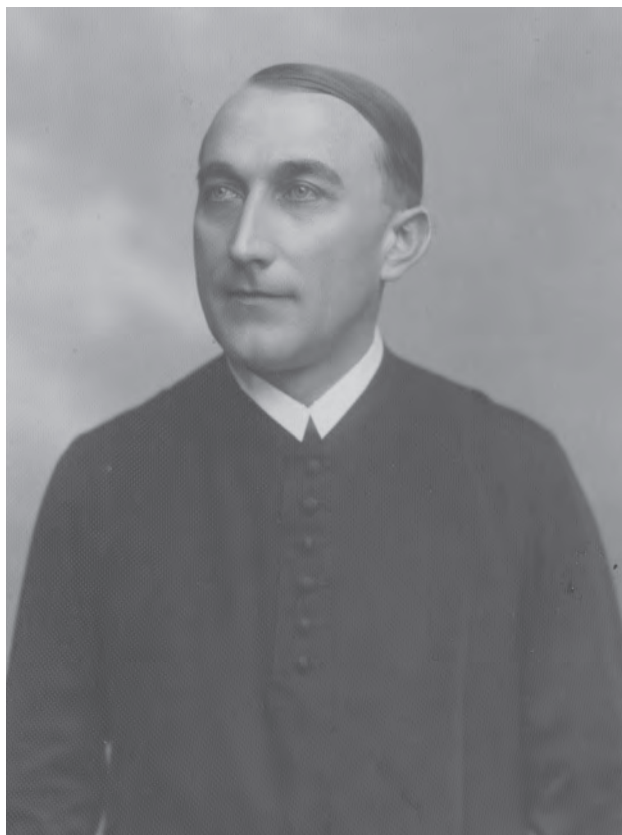
Boldoghy Máriusz (1895–1957)