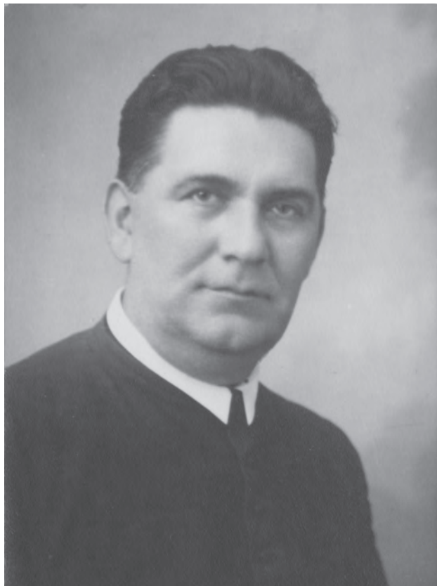
Herczegh Frigyes (1903–1987)