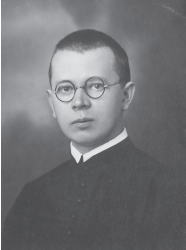
Hajdú Lukács (1898–1960)