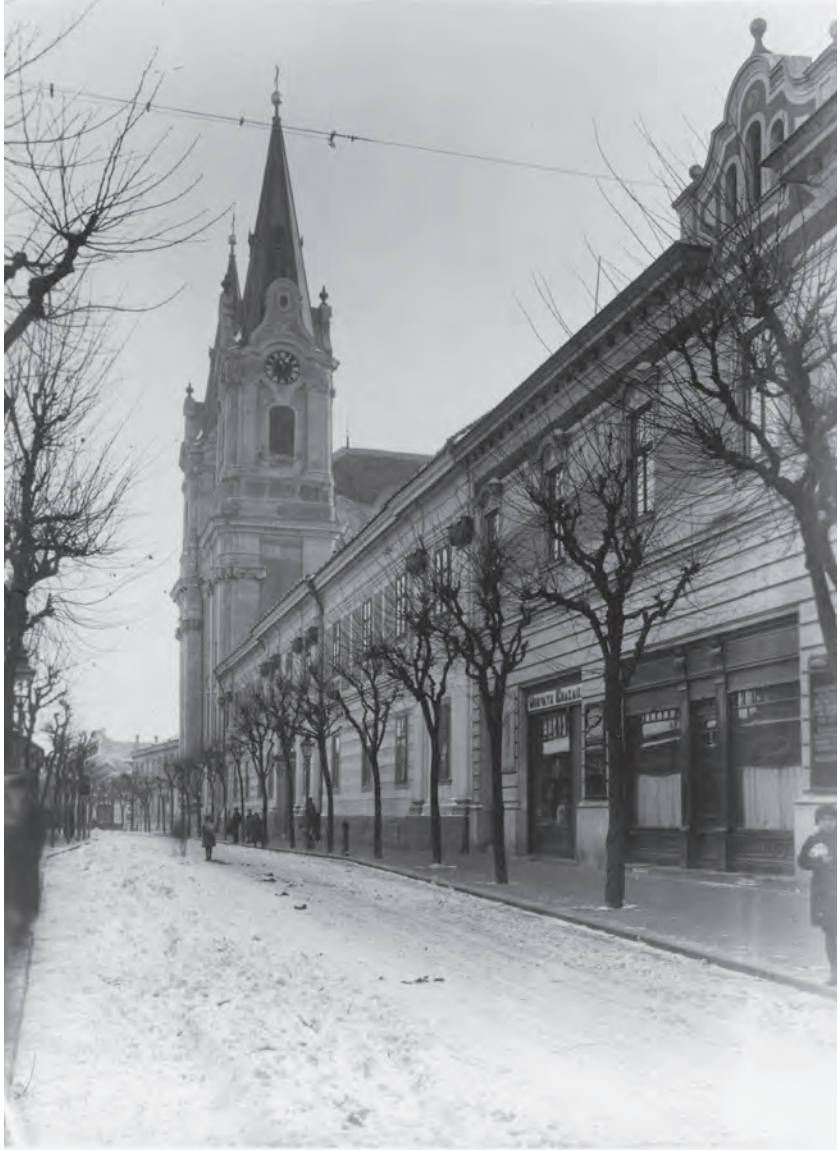
A komáromi bencés rendház két épületének homlokzata