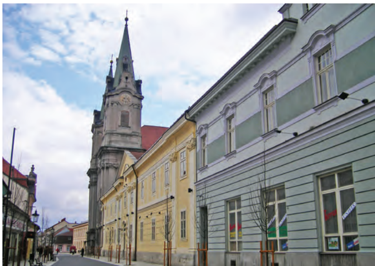
A komáromi bencés rendház két épületének homlokzata