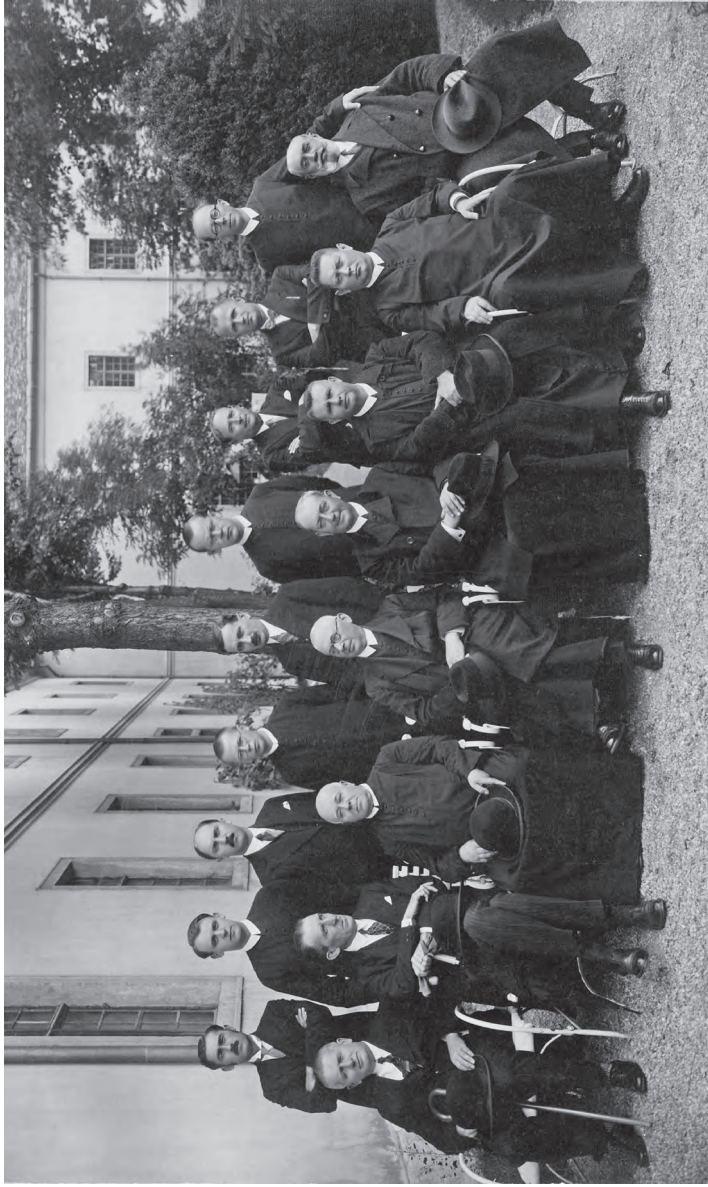
A komáromi bencés gimnázium tanári kara 1931 őszén