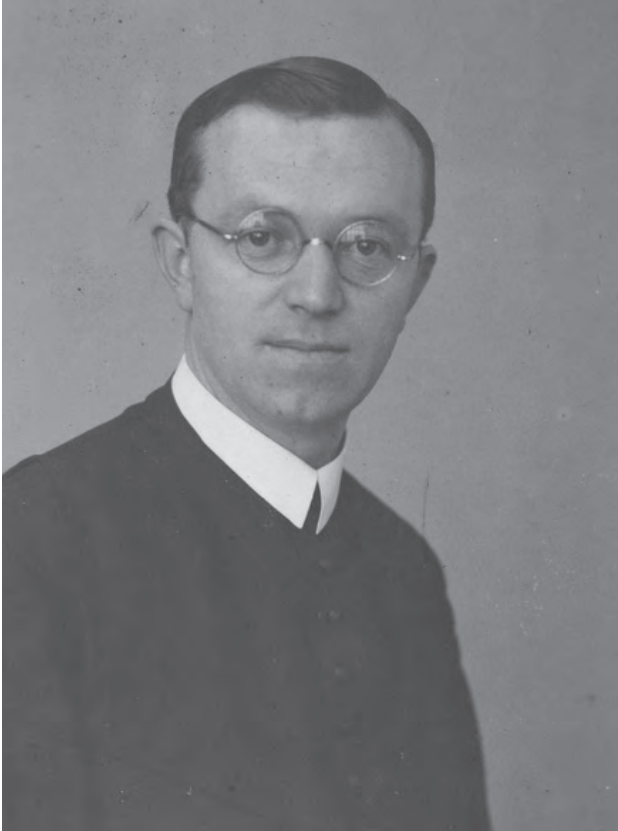
Hinn Damaszcén (1900–1973)