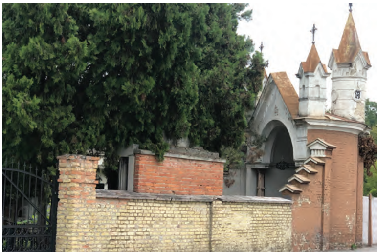
A komárnói városi temető – Mestský cintorin – bencés sírjai