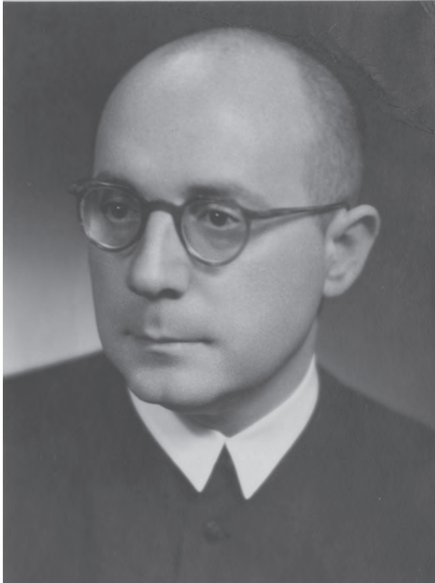
Zsilinszky Kázmér (1910–1985)