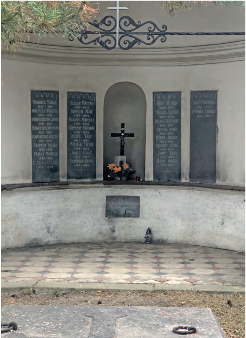
A komárnói városi temető – Mestský cintorin – bencés sírjai