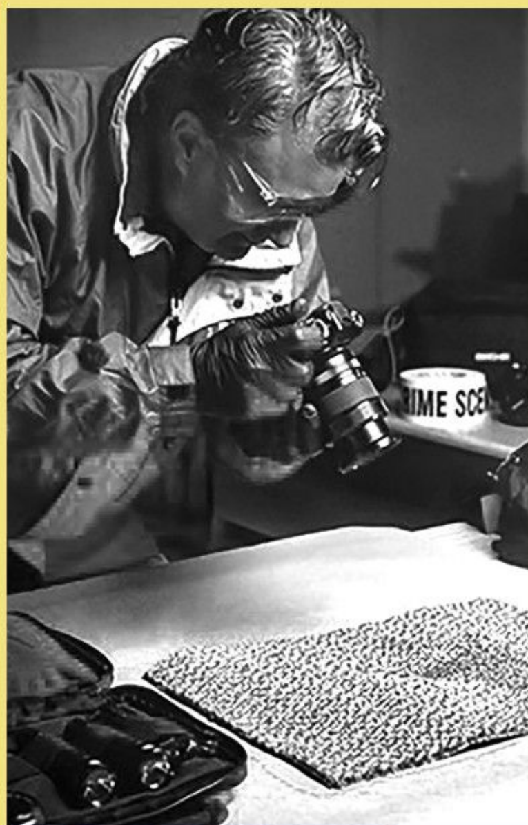
A bűnügyi fényképezés története

A biztosításfelügyelet története Magyarországon a 19. századtól a rendszerváltozásig