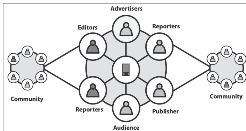
Intercast Model 23