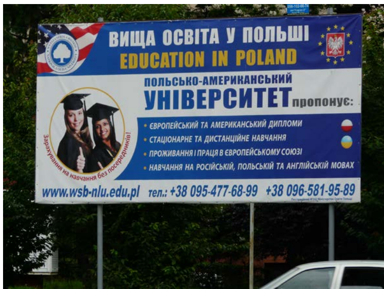
2. ábra: Lengyel egyetemi hirdetés Ungváron, 2016 júniusában

Az ukrajnai humán erőforrásokért kibontakozó versenyben az immár egyszerűsített módon megszerezhető magyar állampolgárság és az általa elérhető személyes biztonság és uniós munkavállalás olyan lehetőségekkel kecsegtet, amely sok nem magyar anyanyelvűt vagy identitását is ösztönöznék az állampolgárság megszerzésére. A könnyen megszerezhető magyar állampolgárság, továbbá a fent említett, 2015 óta életbe léptetett magyarországi jogszabályváltozások tehát alkalmas eszközök lehetnek arra, hogy pozícionálják Magyarországot a lengyel, cseh vagy szlovák konkurenciával szemben. Ugyanakkor ezen intézkedések egyelőre csak a kárpátaljai magyarság elvándorlását serkentették, 50 ráadásul ezáltal egy olyan mobilitási csatorna is megnyílt, amely – Magyarországot