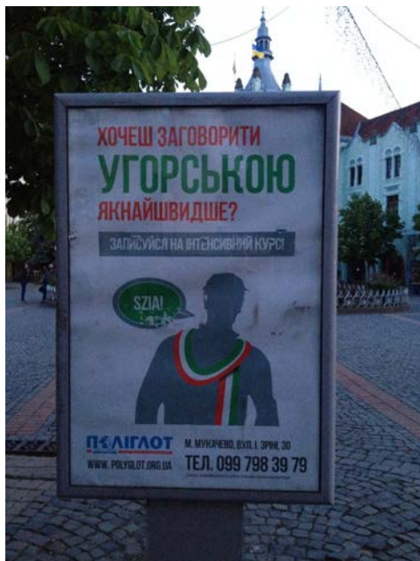
3. ábra: Magyar nyelvi kurzust hirdető plakát Munkácson, 2016 júniusában.