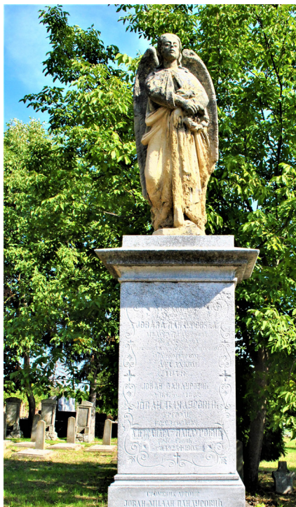
12. kép. Rendhagyó (szobrot tartalmazó) városi síremlék a Pandurovics kereskedő család sírboltja felett 1878-ból (R.sz.: SL-014) – Siklós, 2012