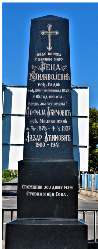
16. kép. Márvány, obeliszkszerű, drága síremlék a 20. sz. első feléből (R.sz.: MH-269) – Mohács, 2012