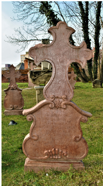
10. kép. Városi, drága barokk sírkő, 1802 (R.sz.: ST-066) – Székesfehérvár, 2013