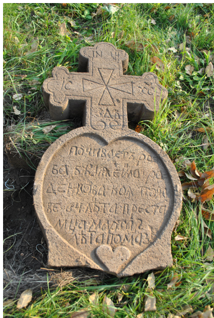
9. kép. Barokk hatásait mutató falusi sírkő é.n. (R.sz.: PM-098) – Pomáz, 2014

felső része kereszt alakú, s melyeken igen gyakran találunk ovális porcelán applikáción fekete-fehér vagy színezett fotót az elhunyt személyről vagy párról (például Lórév, Battonya, Szigetsép); g) olcsó betonkeresztek, melyeken csak az elhunyt neve, illetve születésének és halálának éve szerepel (Deszk); e) kisebb épület formázó kripták (a 20. század elejétől gazdagabb családok esetében Battonyán egyedülállóan jelentkeznek a magyarországi szerbeknél); f) gazdagabb családok márvány obeliszkjei általában a 20. század első feléből (Lórév, Siklós, Pomáz); g) szerbiai mintákat követő egyedi, 20. századi síremlékek (például díszes ornamentika vagy széles, rövid szárú keresztet formázó sírkövek, 54 a sírköbe gravírozott portré az elhunytól) többek között Battonyán vagy Lóréven; h) fémből készült keresztek elvéve találhatók, akárcsak az ősinék tekintett, fából készült, rovátkált, színezett keresztek (Medina, Töttös). 55