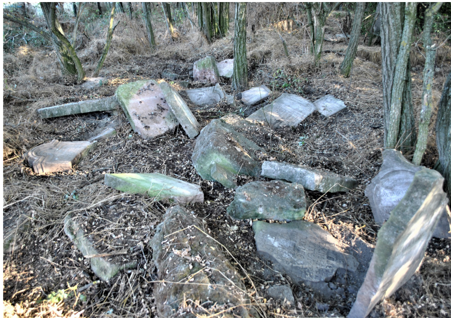
7. kép. A régi lórévi temető sírkövei az új temető elhanyagolt részében kidobva, 2013. A terepmunka során a köveket letisztították és a ravatalozó mögött felsorakoztatták.

az egykori kecskeméti ortodox parcellában a szakirodalom 1925-ben 50 síremléket rögzített, de ebből mára csak 10 fellelhető.