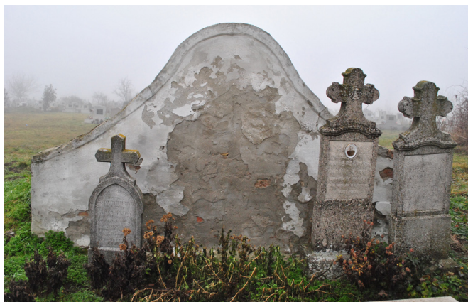
14. kép. Vidéki (falusi) családi kriptá tipikus sírkövekkel a 20.sz. első feléből (R.sz.: BT-0620) – Battonya, 2014