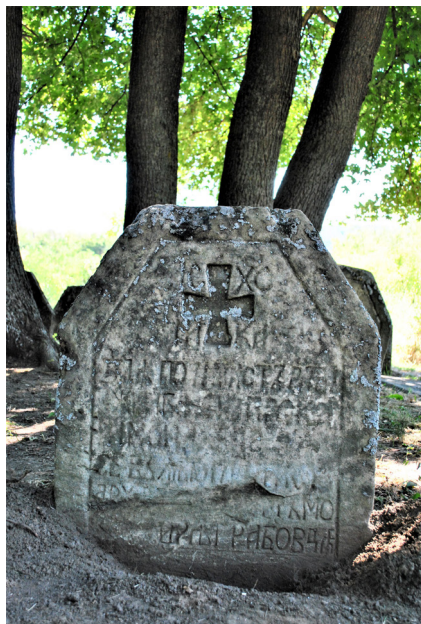
8. kép. Hagyományos sírkő, Prokopije igumén, 1714? (R.sz.: GR-14) – a grábóci szerb ortodox monostor régi temetője, 2012