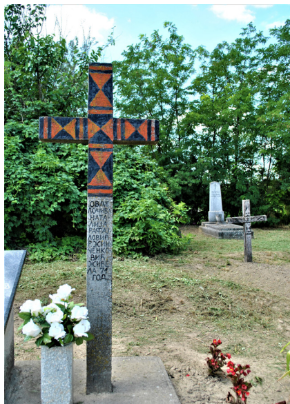
13. kép. Hagyományos fakeresztet utázó betonkereszt a 20.sz.-ból háttérben valódi fakereszttel (R.sz.: MD-039) – Medina (Tolna), 2013