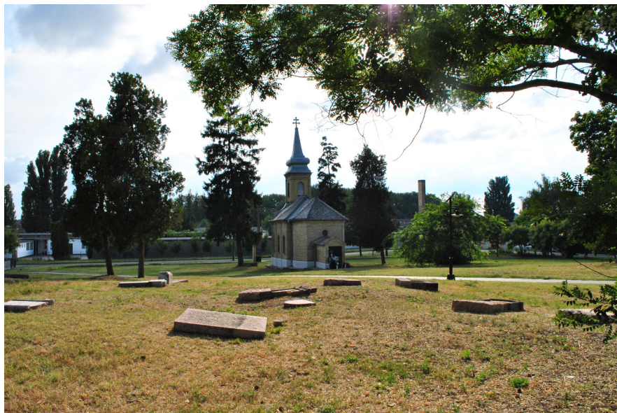
4. kép. A nagyrészt felszámolt egykori szerb temető az önkormányzatnak átadott szerb ortodox kápolnával Baján, 2012

György 1977-ben készült fotói, melyek megtalálhatók a Mohácsi Kanizsai Dorotyia Múzeum fotótárában. Az általunk Lánycsókön, szintén önálló szerb ortodox temetőként nyilvántartott temető szanalás címén végrehajtott, komoly értékvesztéssel járó felszámolására felmérésünk után került sor.