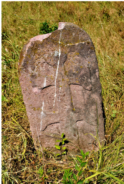
5. kép. Hagyományos sírkő a 18.sz. első feléből (R.sz.: LC-004) – Lánycsók (Baranya), eltűnt 2014-ben a temető felszámolásakor