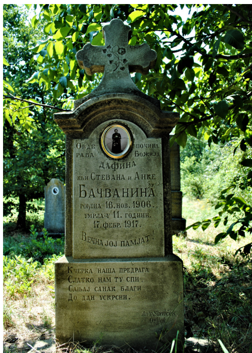
15. kép. 11 éves lány síremléke, sírverssel a 20. sz. elejéről (R.sz.: LP-052) – Lippó (Baranya), 2012

készültek a nyelvi és helyesírási reform előtti régi írásmóddal, betűkészlettel. Azonban ez sem volt minden esetben homogén, hiszen sokszor beszüremkedtek a beszélt nyelvre jellemző, vagy az egyházi szláv nyelv (ószláv) eltérő redakcióinak különböző elemei is. Az egyházi szláv mellett kivételes esetekben, kétnyelvű feliratban, előfordult német és magyar is (Szentendre) a nemesi származású elhunyt előkelőségét és műveltségét hangsúlyozva (Szentendre, Nesko család). A 20. században szintén igen kivételesen a szerb nyelvű felirat latin betűs (horvát ábécé) is lehetett. Kuriózusként hatnak az olyan szerb nyelvű feliratok, amelyeket a magyar ábécé betűivel, fonetikusán véstek (Battonya), ami talán azzal függhet össze, hogy a helyi sírköves nem vállalta a cirill betűs felirat elkészítését, a család pedig ragaszkodott a szerb nyelvhez. Megfigyeléseink szerint a szerb nyelvű