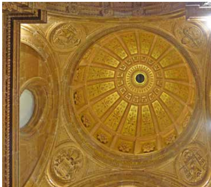
4. kép: A Bakócz-kápolna kupolája. Fotó: Tüskés Anna, 2023

sem kellett igénybe venni, csupán a terepviszonyok átrendezése nyomán izolálódott, a kápolna közvetlen környezetére kiterjedő eredeti várhegyi plató-maradék dombjáról leszállítani az új felhasználási hely közelébe. Az új kápolna 11.4 méterrel alacsonyabban és 17 méterrel távolabb épült az eredeti helyétől. 14 A bontás és újjáépítés folyamatával írott források felhasználásával Balogh foglalkozott a legrészletesebben. 15 1823. május 19-én a kápolnából elvitték a máriapócsi kegykép után készült Mária-képet, 16 ami a kápolna deszakralizációjának volt része. Ezt követően láthatnak csak a bontáshoz. Június 7-től július 21-ig jegyzéket készítettek a kápolna 1600 kövéről, nyilván szép sorban, ahogy a bontásból előkerültek.