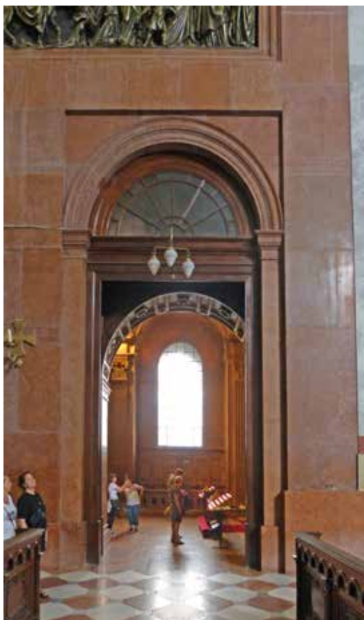
2. kép: A Bakócz-kápolna bejárata a bazilika felől. Fotó: Tüskés Anna, 2023

mellett és látott neki a feltételek felmérésének. A feltételek közé tartozott volna egy új székesegyház megépítése is, hiszen a középkori eredetinek akkorra már csak romjai maradtak. A feltételek megteremtéséhez Barkóczy Ferenc érsek (1761–1765) fogott hozzá. Az érsek nem úgy döntött, mint Patachich Gábor (1733–1745) kalocsai érsek három évtizeddel évvel korábban, aki ott az ugyancsak középkori székesegyház romjainak egy új épület falaiban való integrálását hagyta jóvá, „restaurációként” tekintve az építkezésre, 10 még ha az eredeti maradványok így láthatatlanná is váltak, hanem a munkálatokat tereprendezéssel és a romok részleges eltakarításával kezdődtek, de az érsek halálával hamarosan abbamaradtak. Az ekkor készült székesegyház-tervek (Franz Anton Hillebrandt és Isidore Canevale) a Bakócz-kápolna megőrzésével számoltak, sőt annak ígézetében születtek.