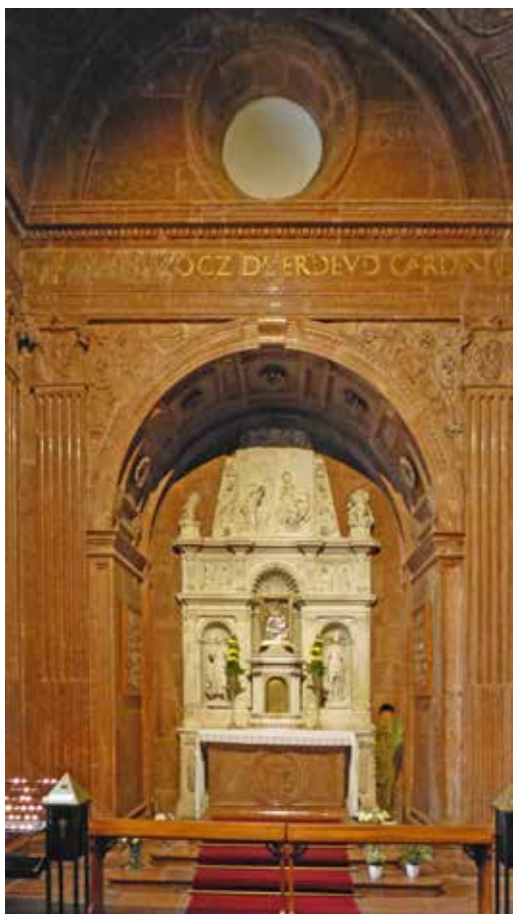
1. kép: A Bakócz-kápolna oltára.

a kápolna (utó)történetének epizódját. 3 Ennek ha oka nem is, de előzménye az, hogy a beavatkozásról már a kortárs szemlélő Máthes János az esztergomi Várhegyről szóló könyvében sem volt valami bőbeszédű. 4