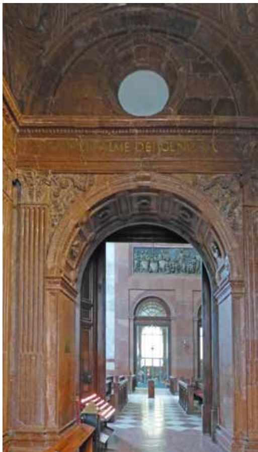
3. kép: A Bakócz-kápolna bejárata a bazilika felé. Fotó: Tüskés Anna, 2023

a loretoi Santa Casa legendájából. 12 A názáreti Angyali üdvözet bazilikából Szűz Mária, illetve a szent család házát 1291-ben Trsatba (Tersato), majd 1294-ben onnan Recanti közelébe szállították át. A legenda szerint angyalok. Ha valóban hiteles ereklyéről van szó, a szállítás nem légi úton történt, hanem az út nagy részét vizen kellett megtenni. Építészeti elemek behajózásához, említettük már, ha mások nem is, a velenceiek igen értettek. Ha a XIII. században a názáreti templom romjai közül kiemelhettek egy épület(részt), amely az eredeti épületbe eleve ereklyeként illeszkedett, miért ne lehetne a XIX. században a középkori esztergomi székesegyház romjai közül, annak egyetlen ép állapotban 13 fennmaradt részét kimenteni és általa az új székesegyházat hitelesíteni.