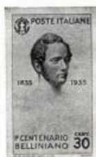
8. Kótáz. Bellini jubileumára. (1935)