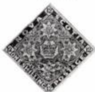
22. Szőnyegszerű síklásítvány. Nova-Scotia (1871)