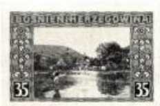
27. A naturalizmus túlhatása. Kolo Moser: bosnyák tájkép. (1906)