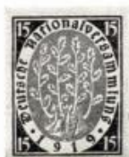
24. Újraélt fametszet. Weimar. (1919)