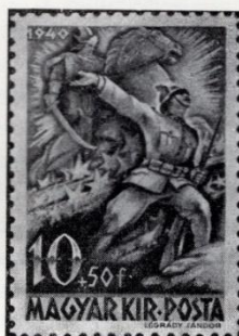
Légrády Sándor: Erdély. 1940.