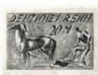
29. Az expresszionizmus végpótlása. Edwin Scharff szantója. München (1921)