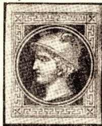
A MERKUR FEJES HÍRLAPJEGY. (Kétszeres nagyság.)

A nagy sietségben ilyen közjogilag helytelen kitétel is eszűszik be a II. rendelet magyar fordításába: „az osztrák birodalom többi részeiben“. Holott Magyarország, Erdély, sőt Horvát-Szlavonország és a szerb-bánati katonai határőrség sem nevezhető ekkor már az osztrák birodalom részének. Még a német rendelet is így szól: „in der übrigen Theilen der Monarchie“, értvén alatta az új osztrák-magyar monarchiát és nem a régi osztrák birodalmat.