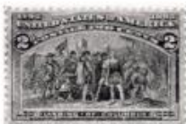
25. Történelmi falikép kicsinyítés. Kolumbusz-jubiläum. Acelvésés. (1902)