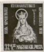
Englerth Emil: Szent Erzsébet.