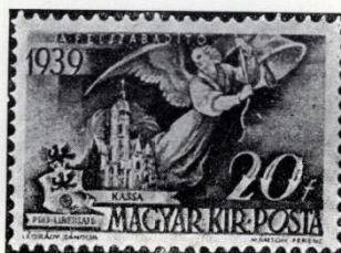
Légrády—Márton: Felvidék. 1939. A magyar Angelus a kassai dóm képével.