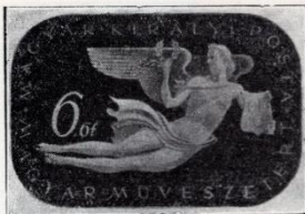
Konecsni György: A magyar művészetért. 1940-ik év legutolsó bélyegsorozata.