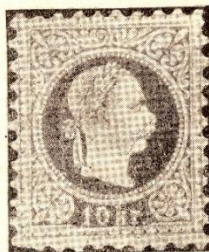
A 10 KR. MELLŐL HIANYZIK A TÉRSZŰKÍTŐ DÍSZÍTMÉNY.

A nyomás különlegesen gondatlan. A nyomóducc egyenetlenségét úgy végzik, ahogy a domború nyomásnál szokás. Nemez lapocskákat (filcet) helyeznek alá. Ez bizonyos játékot enged és csak a domborúságnál indokolt, mert nem szakítja a papírt. Az egyszerű síknyomásnál azonban a lágy alátét folytán a duc vastagon veszi fel a festéket s a rajzolat vonalai nem mélyülnek bele a papírba, hanem a nyomás folytán szétterülnek, megvastagodnak, sőt egymásba is folynak. Ez az ábrázolás tisztaságát nagyban lefokozza, különösen a szemöldöknél, a szemnél és a szakálrésznél látjuk, hogy sokszor a vonaljellegből folthatás lesz. Ferencz József sötét tekintettel, csapzott és egybefolyó állal, tíz évvel öregebbnek jelenik meg. Kropf különösen sok elriasztó, elkent nyomdafestékkel készített, példát gyűjtött össze