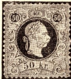
A BECSEMPEZETT CSÁSZÁRI KORONA AZ 50 FILLÉRES LEVÉLJEGYEN.

Tény azonban az, hogy az önállóan igazgatott magyar postai szervezet, mely külön bélyegek kiadására jogosult, 1867-ben V. 28., V. 30 és VIII. 31-én kelt három, nyomtatásban is közzétett rendelettel közvetlenül az osztrák kormány 1867-iki V. 24-én és VIII. 22-én kelt rendeletével már előbb engedélyezett levélbélyegeket kapja meg. Az azonos bélyegeknél két államban való megjelentetéséről maguk az osztrákok, így írnak: „Es ist Thatsache, dass bei dieser Ausgabe der in der Geschichte der Postwertzeichenkunde wohl einzig darstehende Fall besteht, dass ein selbständiges Postgebiet Postwertzeichen eines anderen Postgebietes benutzte.“ 7