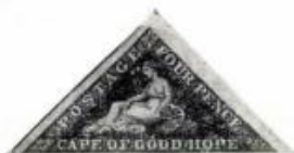
12. Görög típuson. Jó Reménység Foka. Fémvésztet. (1853)