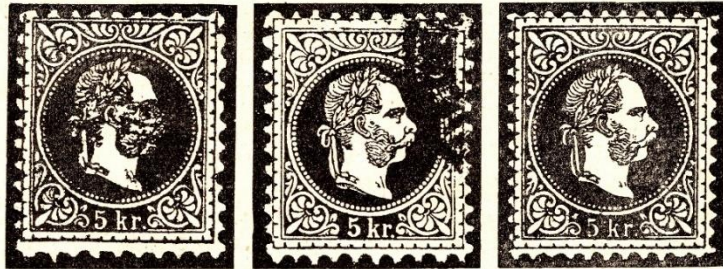
A MAGYARORSZÁGRA SZÁLLÍTOTT SILÁNY NYOMATOK PÉLDÁI, H. KROPF ÖSSZEÁLLÍTÁSÁBÓL.

A nyomás és a színek sokfélesége mellett a fogazat is elég változatos. Eleinte 9.5 a száma. A vaskos nyomásúak, a „durva szakállúak”-nak nevezettek fogazása is gyatra mert régi. Török Antal bécsi államnyomdai műszaki vezetőtől szerkesztett, 1854. óta működő gépeken készülnek, melyeknek teljesítménye már nem egészen kifogástalan. „A finom szakállrajzú kiadás, valamint az eltérő fogazású példányok már tisztára osztrák bélyegek, minthogy akkortájt már önálló magyar bélyegek vannak forgalomban.” 9 Aztán a soros fogazóba nem is mindig helyesen rakják be az íveket. Néha nagyobbra, néha