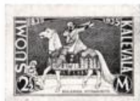
26. Könyvillusztráció. Axelii Gollen-Kalela a Kalevala-jubiläumára. (1935)