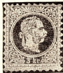
AZ 1867-ES KIEGYEZÉS ELSŐ LEVÉLFEGYE. (Kétszeres nagyság.)

Az alkotmányosságot vállaló uralkodó és Deák Ferenc közös műve alapján az egyenlőség és a viszonyosság elve lép előtérbe. A monarchia két felében paritásos irányítással együttesben marad a külügy, a hadügy és a rájuk vonatkozó pénzügy. Az 1867: XVI. t.-c. 18. §-a a magyar posta bel- és külszolgálatát szerződéses alapon szintén leköti bizonyos mértékig. Időnként a kereskedelmi és a vámügyek keretében kölcsönös alku és egyezkedés által „egyforma elveket” kell megállapítani mindkét államterület külön igazgatósága számára. Az egyforma-elvűség azonban a további kifejlődés lehetőségét is magában foglalja: 1888-ban már a magyar posta nemzetközi önállósághoz jut, 1 1908-ban pedig véglegesen függetleníti magát a rossz emlékeztető osztrák pátensek világától. 2