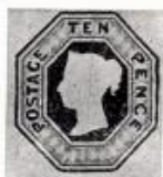
2. Egyszerűsítés a sziluetttig. Az I. sz. vaknyomóssá változata. (1817)