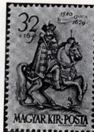
Légrády: Bethlen. 1939.