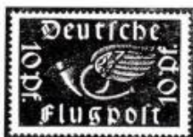
21. Népies és nemzeti formák. Német. (1919)