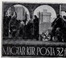
Jeges Ernő: A korona elhozatala Rómából. (Terv. 1937.)