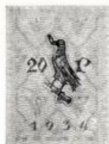
9. Cimerdíszet. A gyűrűs holló. (1934)