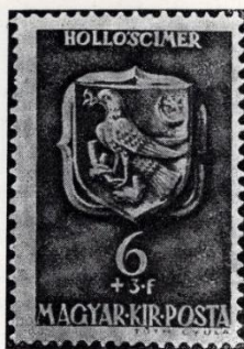
Tóth Gyula: Mátyás király emlékbélyegeiből. 1940. A hollós címer Vajda hunyadi gyámkö.