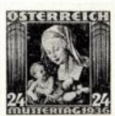
28. Olajfestmény a bélyeg bővítésén. Dürernek a bécsi múzeumban lévő 1512-esi Máriája után. (1936)