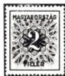
17. Gyakorlati előszerűség. M. K. Államnyomda. (1936)