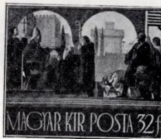
Jeges Ernő: A korona elhozatala Rómából. (Terv. 1937.)