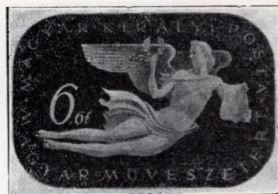
Konecsni György: A magyar művészetért. 1940-ik év legutolsó bélyegsorozata.