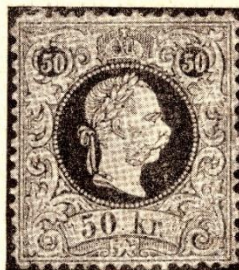
A BECEMPESZETT CSÁSZARI KORONA Az 50 FILLERES LEVÉLJEGYEN.

Tény azonban az, hogy az önállóan igazgatott magyar postai szervezet, mely külön bélyegek kiadására jogosult, 1867-ben V. 28., V. 30 és VIII. 31-én kelt három. nyomtatásban is közzétett rendelettel közvetlenül az osztrák kormány 1867-iki V. 24-én és VIII. 22-én kelt rendeletével már előbb engedélyezett levélbélyegeket kapja meg. Az azonos bélyegeknek két államban való megjelentetéséről maguk az osztrákok, így írnak: „Es ist Thatsache, dass bei dieser Ausgabe der in der Geschichte der Postwertzeichenkunde wohl einzig darstehende Fall besteht, dass ein selbständiges Postgebiet Postwertzeichen eines anderen Postgebietes benutzte.“ 7