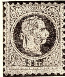
AZ 1867-ES KIEGYEZÉS ELSŐ LEVÉLJEGYE. (Kétszeres nagyság.)

Az alkotmányosságot vállaló uralkodó és Deák Ferenc közös műve alapján az egyenlőség és a viszenosság elve lép előtérbe. A monarchia két felében paritásos irányítással együttesben marad a külügy, a hadügy és a reájuk vonatkozó pénzügy. Az 1867: XVI. t.-c. 18. §-a a magyar posta bel- és külszolgálatát szerződéses alapon szintén lekötöi bizonyos mértékig. Időnként a kereskedelmi és a vámügyek keretében kölcsönös alku és egyezkedés által „egyforma elveket” kell megállapítani mindkét államterület külön igazgatósága számára. Az egyforma-elvűség azonban a további kifejlődés lehetőségét is magában foglalja: 1888-ban már a magyar posta nemzetközi önállósághoz jut, 1 1908-ban pedig véglegesen függetleníti magát a rossz emlékeztető osztrák pátensek világától. 2