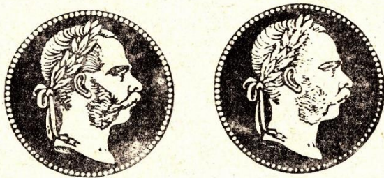
A „DURVA SZAKÁLL” ÉS A „FINOM SZAKÁLL” NAGYÍTÓÚVEGEN NÉZVE: AZ ELSŐ NEMEZ ALÁTÉTTTEL, A MÁSIK PAPIR ALÁTÉTTTEL NYOMVA.

kisebbre sikerülnek az egyes alakzatok, azaz egymástól különböző terület-nagyságú bélyegeket szabnak le.