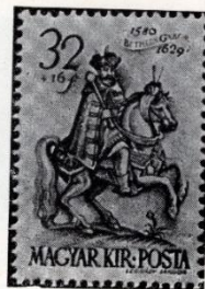
Légrády: Bethlen. 1939.