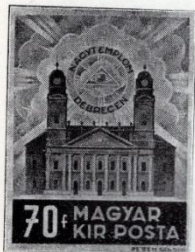
Petten Sándor: Debreceni nagytemplom. 1938. (Terv.)