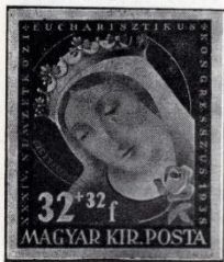
Fery Antal: Szt Erzsébet. (Terv. 1937.)