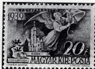
Légrády—Márton: Felvidék. 1939. A magyar Angelus a kassai dóm képével.