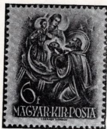
Légrády Sándor : Szt István. 1938.