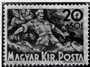
Légrády Sándor: Árvíz. 1940.