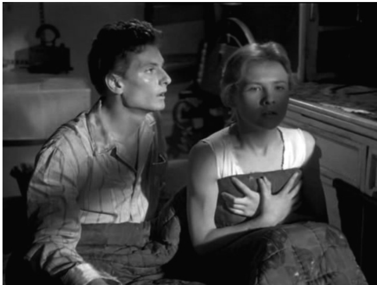
Fülöp Zsigmond és Törőcsik Mari