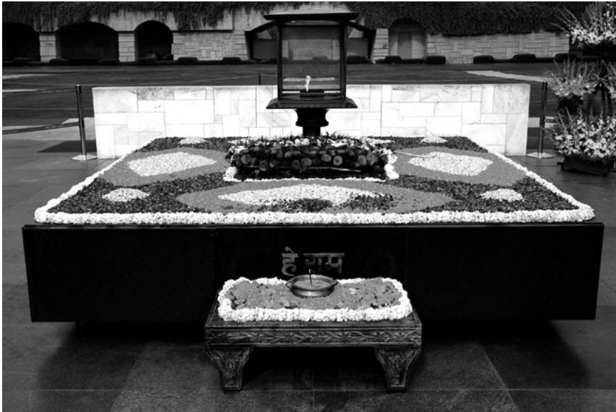
Raj Ghat, Gandhi emlékmű, Delhi, India

Indiában szintén, Új-Delhiben egy főút melletti szabad területen található egy nagy négyzet alakú, fekete márvány emlékmű, amelyet azon a helyen állítottak fel, ahol Gandhi testét elhamvasztották.