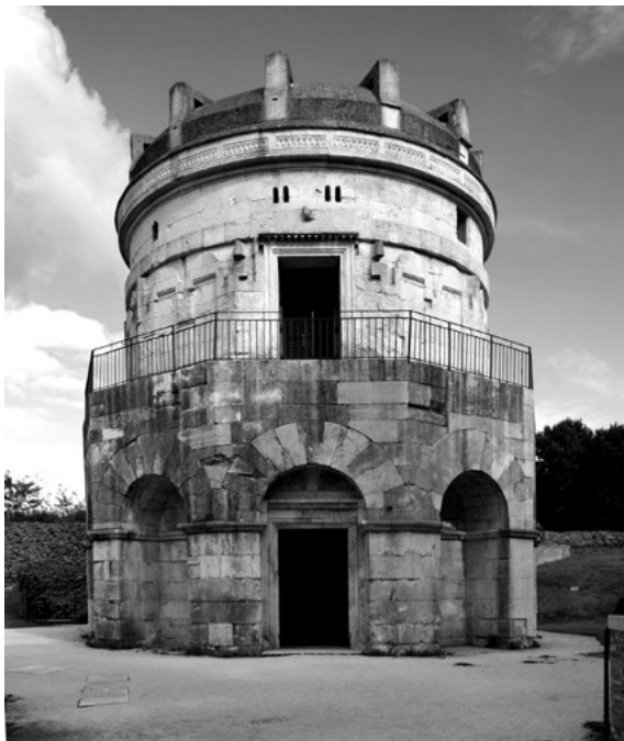
Theodorik mauzóleuma, Ravenna

elhelyezve, az első Hitvalló Edvárdé (†1066), aki felújította a 960-ban épült templomot. Érdeemes megemlíteni VIII. Henrik két lányának közös és a lefejezett skót Mária királynő síremlékét. Tíz király sírja a windsori Szent György kápolnában van, így VIII. Henrik (harmadik feleségével, Jane Seymore-ral), a lefejezett I. Károly és a számomra emléket jelentő VI. György (+1952) síremléke is.