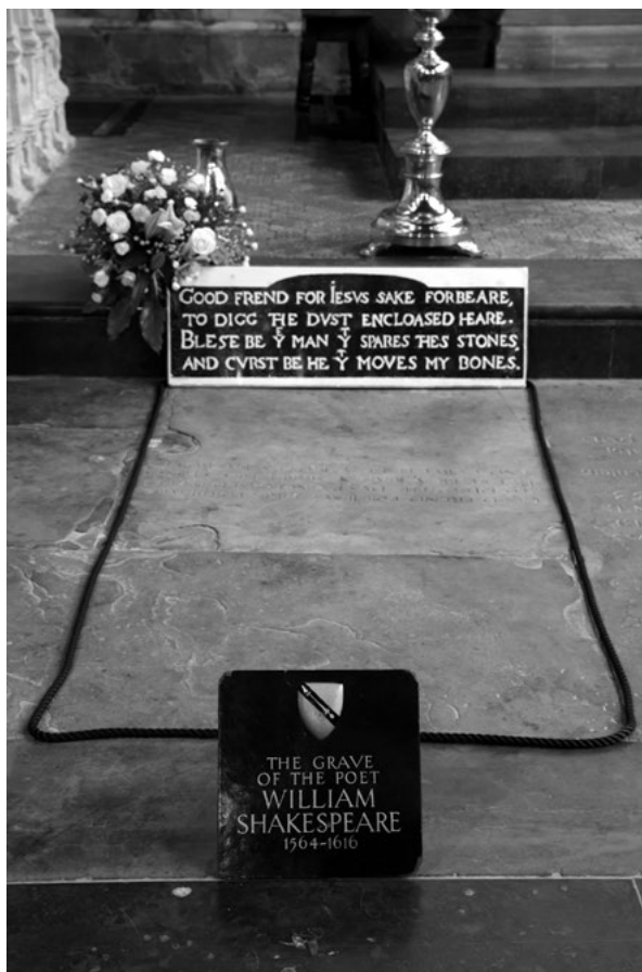
Shakespeare sírja, Stratford-upon-Avon, Holy Trinity Church

Az angol mentalitás az írói tevékenységet a szakrális teremtés fogalmába sorolja. Az első angolul író költő, Geoffrey Chaucer ( The Canterbury Tales ) testét halálakor (1400) a londoni Benedictus kápolnában helyezték el, majd a Westminster Abbey felépülése után áthelyezték ide (1556) és ezt követően itt, a templomban az írók, költők emlékének egy külön részt alakítottak ki, ahol máig több mint 130 személy részben szoborral, domborművel díszített, emléktáblája szerepel. Ez a hely az ún. Poet's Corner. Több nagy író van itt eltemetve (pl. Dickens, Kipling, R. Browning), a többi emléket csak emléktábla őrzi. Tehát az írók azt a megtiszteltetést kapták, mint a királyok. Meg kell említeni, hogy az itt élő és működő Händel zeneszerző is itt lett eltemetve, sőt a templom más részén Newton és Darwin is.