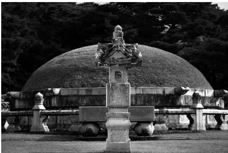
Hongreung és Yureung királyi sírhalom, Szöul mellett, Dél-Korea

Dél-Koreában, Szöul közelében egy ottani ismerősöm vitt el (1999) az akkor még publikum számára nem megnyitott királyi temetőbe (15.–16 sz.), a Hongreung és Yureung sírokhoz. Háromemeletes sírdomb tartalmazta a királyi testeket, mellette egy állatszobrokkal szegélyezett kövezett út vezetett a rituális épülethez.