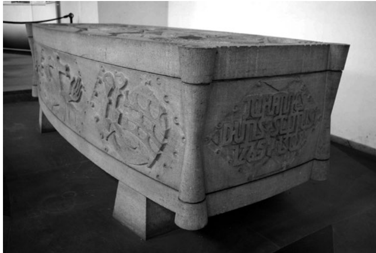
Duns Scotus szarkofágja, Minorita templom, Köln

Wilhelm Konrad Röntgen földi maradványait Németországban Giessen egyetemi város polgári temetőjében egy közös családi sírban helyezték el, itt található ma is, ebben a városban volt a fizikai tanszék vezetője a híres felfedezése előtti évtizedben (1879–1889). A város főterén az áthatoló sugarakat szimbolizáló emlékszóbor áll.