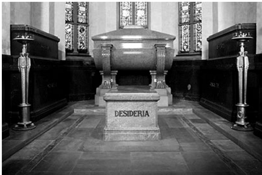
XIV. Károly szarkofágja a Riddarholmen kápolnájában

A dán uralkodók az egykori főváros, Roskilde székesegyházában Kézfogú Haraldtól kezdve (†985) a jelenig (ott jártamkor éppen a jelenlegi királynő, Margit tett látogatást a templomban).