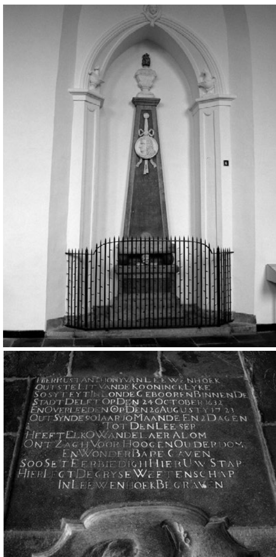
Anton van Leeuwenhoek síremléke, Oude Kerk, Delft

Hollandiában, Delft város Oude Kerk (Öreg Templom) templomában található Anton van Leeuwenhoek díszes síremléke. Őt tartjuk a mikroszkóp feltalálójának, amellyel mikrobákat, emberi sejteket tett láthatóvá (1672).