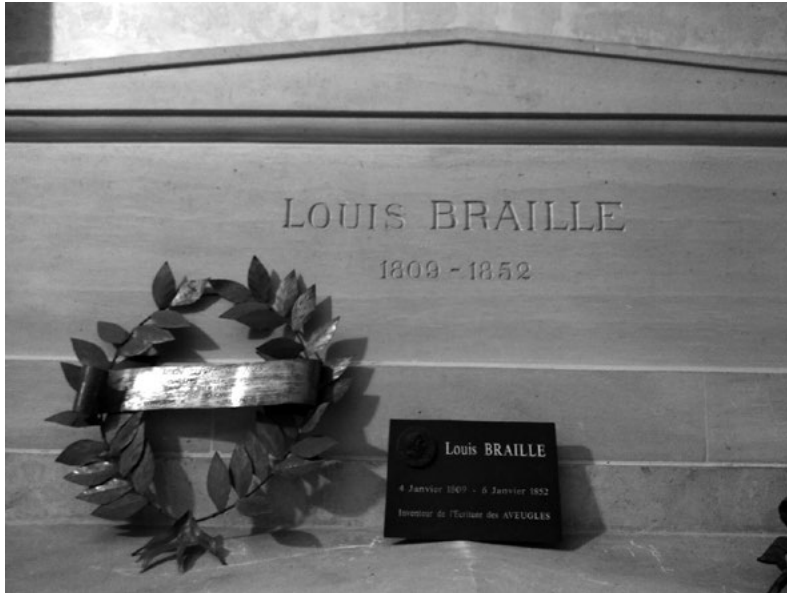
Louis Braille szarkofágja, Pantheon, Párizs

Pipin, szent Lajos, XIV. és XVI. Lajos (többnek csak kenotáfiuma, mivel a forradalmárok kihányták testüket innen).