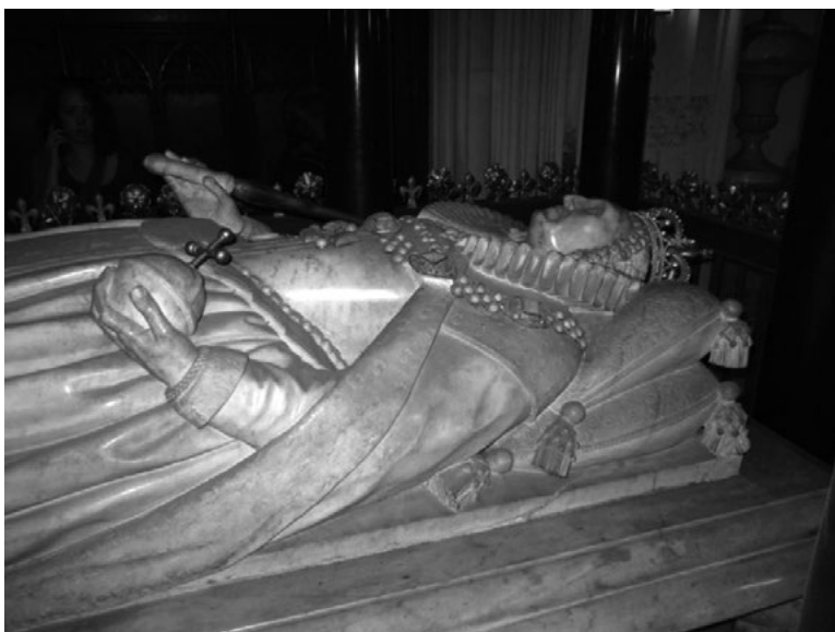
I. Erzsébet szarkofágja, Westminster Abbey, London