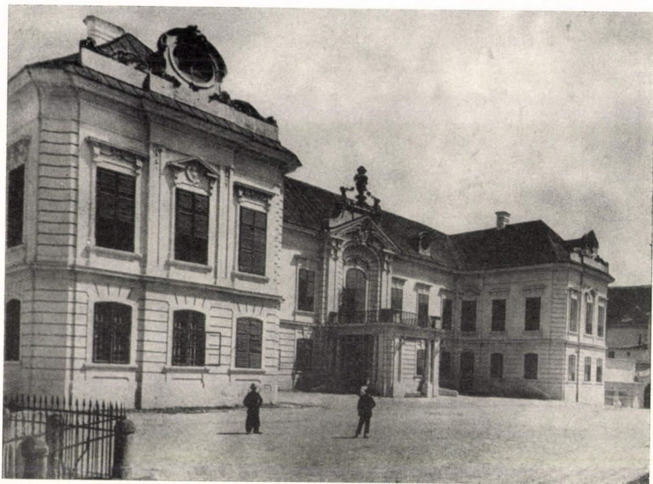
Veszprém. Püspöki palota, építette Fellner Jakab (1765—1776)

országok építészettörténetének együttes, közös kimunkálása oldhatja meg az országonként jelentkező barokk kérdéseit is. Idegen mesterek magyarországi működése sok adattal egészítheti ki saját hazájuk barokk kutatásait és megfordítva, a magyar XVII. és XVIII. század művészeti kérdéseit.