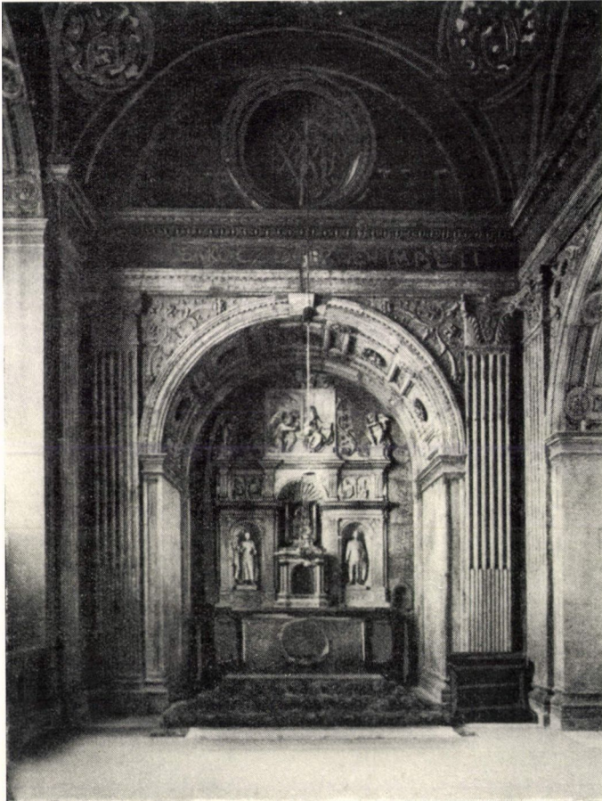
Esztergom, Bakócz-kápolna belseje. Épült (1506—1510)

század végén művészi életről. Előbb romokat kellett eltakarítani. A felépítéshez viszont hiányoztak az új építő és segítő kezek, valamint az anyagi feltételek is. A fejlődés különös útját járta ekkor Magyarország az európai barokk művészet nemzetközi versenyében. Az elnéptelenedett és elszegényedett ország nem követhette a virágzó fejedelmi udvarok, hatalmas feudális urak s a gazdag városi polgárság nagytömegű, tágas térképzésű, hivalkodó és dekorációs gazdagsággal felépült építkezéseit. S ez a tény már önmagában is meg-