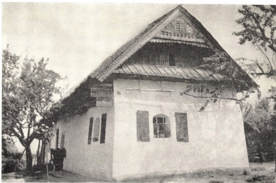
11. ábra. Deszkaoromzatos, vízvetős lakóház. Martos (Martoš, Komarno okres.) Északi magyar — palóc — háztípus. A füstelvezetésre szolgáló tetőnyílás — a füstlyuk — szerkezeti elfödése és formai kiemelése. Ép. : XIX. sz. vége.