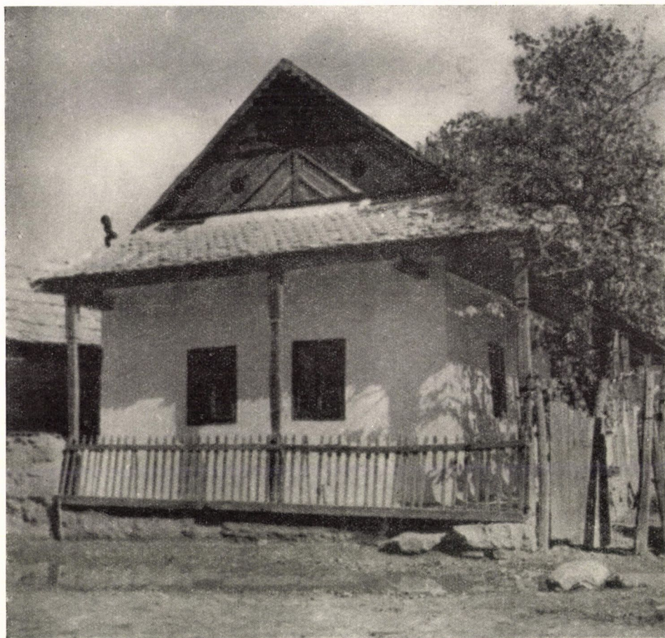
12. ábra. Alsócsanakakontyos — vízvetős — deszkaoromzatos, homloktornácós lakóház. Sámsonháza, Nógrád m. Északi magyar — palóc — háztípus. A füstelvezetésre szolgáló tetőnyílás oromzattá alakul, az egykori füstlyuk formái kiemelésével. Ép.: 1900.

Hasonló jellegű példákat, kapcsolatokat a térben és időben szélesen hullámozó s még napjainkban is elevenen élő népművészetben, elsősorban parasztházaink homlokzati megoldásainál is megfigyelhetünk. Az északi magyar parasztházak barokkos és klasszicista jellegű vakolatdíszei szerves — szinte etnikai — kapcsolatban állanak a szlovákiai hasonló jellegű parasztházak homlokzataival, s egyben még távolabbra is mutatnak, a közép-európai barokk stílus mindent elöntő áradatára, amely Ausztria, Csehszlovákia, Magyarország egyes területein a polgári és a népi építészetet, közel száz éves izlés-késéssel, körébe vonta, olyan erővel és művészi, izlésbeli öntudattal, hogy a viszonylag szerény parasztházak többek között éppen a stílusbeli kapcsolataik révén is, a közép-európai barokk szerves részeivé váltak. 5