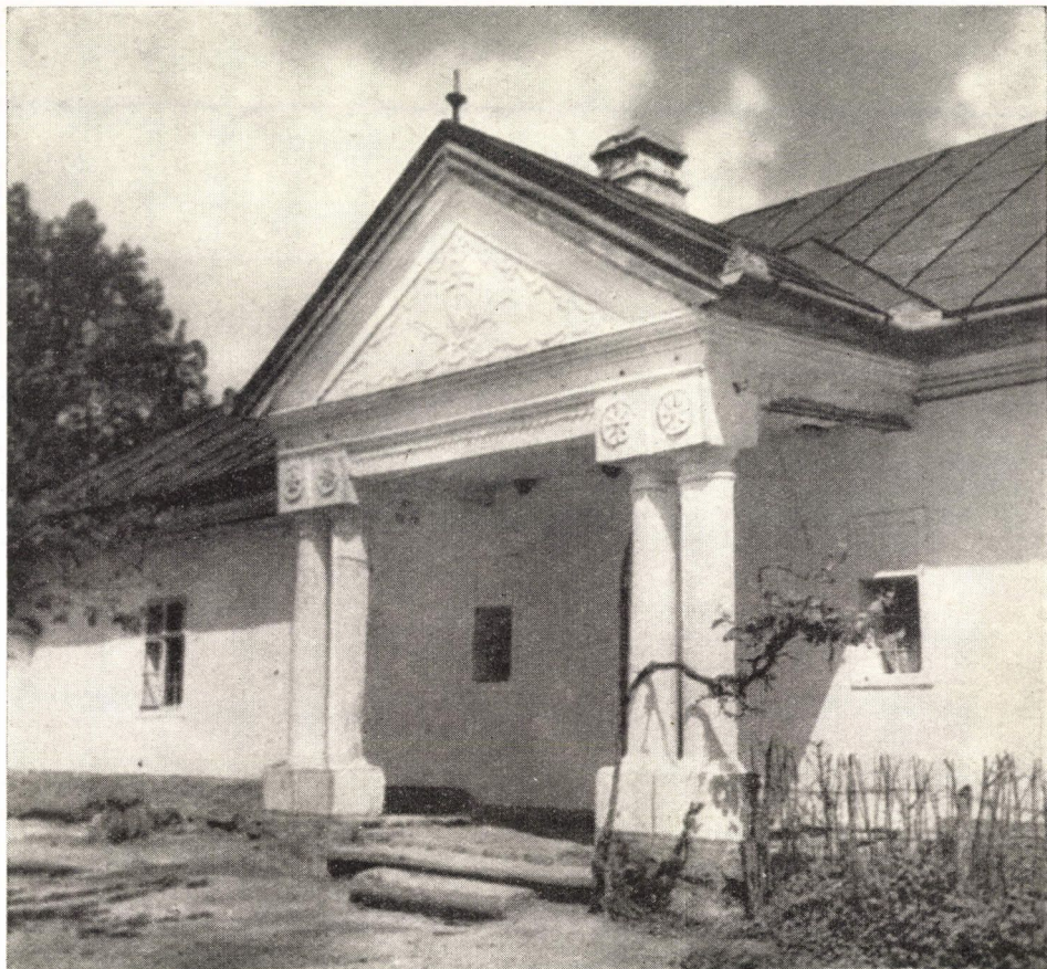
17. ábra Udvarház. Hídvégardó, Borsod-Abaúj-Zemplén m. Az 1824-ben épült kiskisnemesi udvarház klasszicista jellegű udvari homlokzata. Átép.: 1860 körül.

lődés mozgatói és a műveltség birtoklói — a rétegek egymásba kavargó hosszú sorából tevődnek össze.” 9