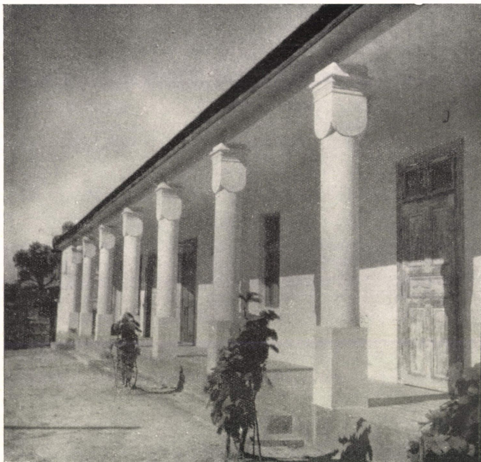
9. ábra. Kockafejezetes — gömbszelvényes — tornácoszlopok. Ócsa, Pest m. A falusi lakóháznak a középkori — románstílusú — oszlopfők mintájára készült tornácoszlopai. Ép.: 1946—47.

zolás nyomán, magyarországi és román (erdélyi) néphitbeli hagyomány ismertetésével és elemzésével közép-európai és még középkori hagyományok XVIII. és XIX. sz.-i továbbélését igazolja. 4 Az egyik hagyomány, a gyermekgyilkos anya pokolbeli büntetése azonban nem csupán a XVIII. és a XIX. sz.-i népi ábrázolásban, festményeken maradt fenn. A diósgyőri várból előkerült XVI. sz.-i kályhacsempe hasonló alakos ábrázolása ugyanennek a hiedelemnek nagyúri — helyesebben történeti stílusbeli, reneszánsz — felhasználását, alkalmazását bizonyítja. A másik hagyomány, a paradicsomi élet egyik epizódja: Éva Ádám fejébe néz jelenet, középkori falfestményeink egyik jelentős körében, Szent László falképciklusaink zárójeleneteként közismert ugyan, de pusztán csak érzelmileg magyarázott. A jelenetnek népi analógiája, a népi gyógyítómód magyarázata nélkül tartalmilag ismeretlen és érthetetlen is maradna.