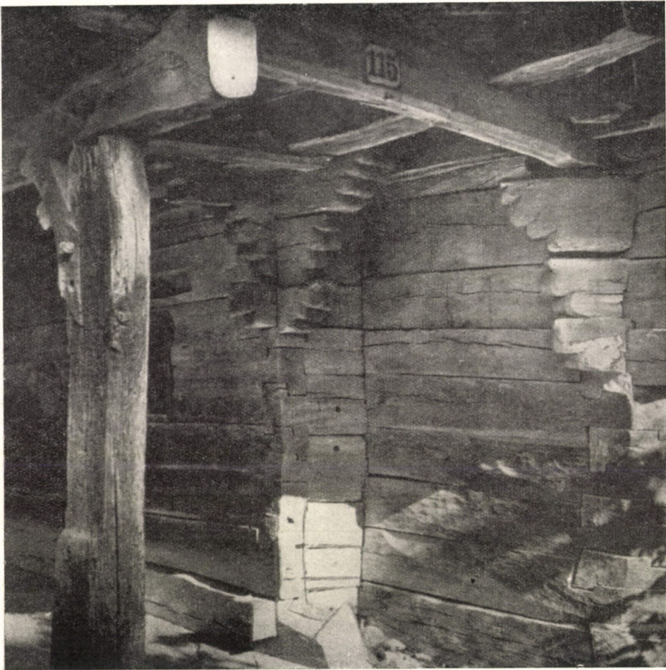
6. ábra. Fatemplom. Kide (Chidea. Judecul Cluj.) Gör. kel. templom. Tornácrészlet. Gótikus szerkezeti és formai elemekre utaló részletekkel. Ép.: XVIII. sz. vége.

Viski Károly kiváló etnográfusunk tanulmányaiban több alkalommal az úri és a népi műveltség kapcsolatait, az évszázadokon át egymásbakapcsolódó művelődési folyamatot vizsgálja. 3 Véleménye szerint: „Az ’úri’ és a ’népi’ — ha az utóbbit a ’vulgus in populo’ értelemben értjük, — csak a két elméleti véglet; a mi köztük van, sokszoros rétegekben az ’úrihoz’ vagy a ’népihez’ van közelebb, vagy egyforma távol mindkettőtől, mint ahogy az európai társadalmak is, — a művelődés mozgatói és a műveltség birtoklói, — rétegek egymásba kavargó hosszú sorából tevődnek össze.” Viskinek ehhez az alapvetően jelentős elvi megállapításához szervesen kapcsolódik, mintegy változatos és kiegészítő példaként egy alig ismert tanulmánya, amelyben két régi hagyomány ábrá-