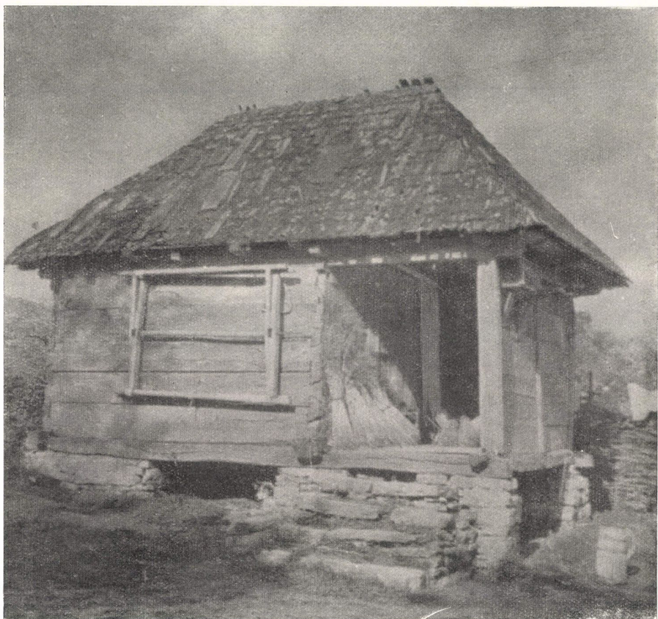
3. ábra. Gabonás. Csomafája. (Ciumăfaia. Judecul Cluj.) Talpgerendás, rövidereszes, egysejtű épület, bárdolt pallókból falazva. Ép.: XVIII. sz. vége.

irányú megfigyelések és a szomszéd-baráti népek hasonló tárgyú és közel azonos jellegű építészettörténeti tanulmányai alapján egy olyan közép-európai népi műveltség körvonalai vázolhatók fel, amely már a kora középkortól, elsősorban a románkortól kezdődőleg, szinte napjainkig tovább él s ma is elevenen élő valóság, művelődésbeli igény és szemlélet, ha időközben, elsősorban az etnikai, a politikai és a gazdasági adottságok és követelmények, s nem utolsó sorban az egyházak (római katolikus, görögkeleti, protestáns egyházak) előírásai, szabályai időszakonként, hosszab-rövidebb időre, más és más jellegű felületi alakítással, kevésbé tartalmi változással, vallási és nemzeti színeződéssel látták is el azokat. Mindez, Közép-Európa történetét, különösen a Kárpátok által, mintegy a nemzetek közötti koordináló — egybefogó — testtel is egybefont, egybefogott nemzetek — országok — történetét ismerve, nem lehet közömbös előttünk.