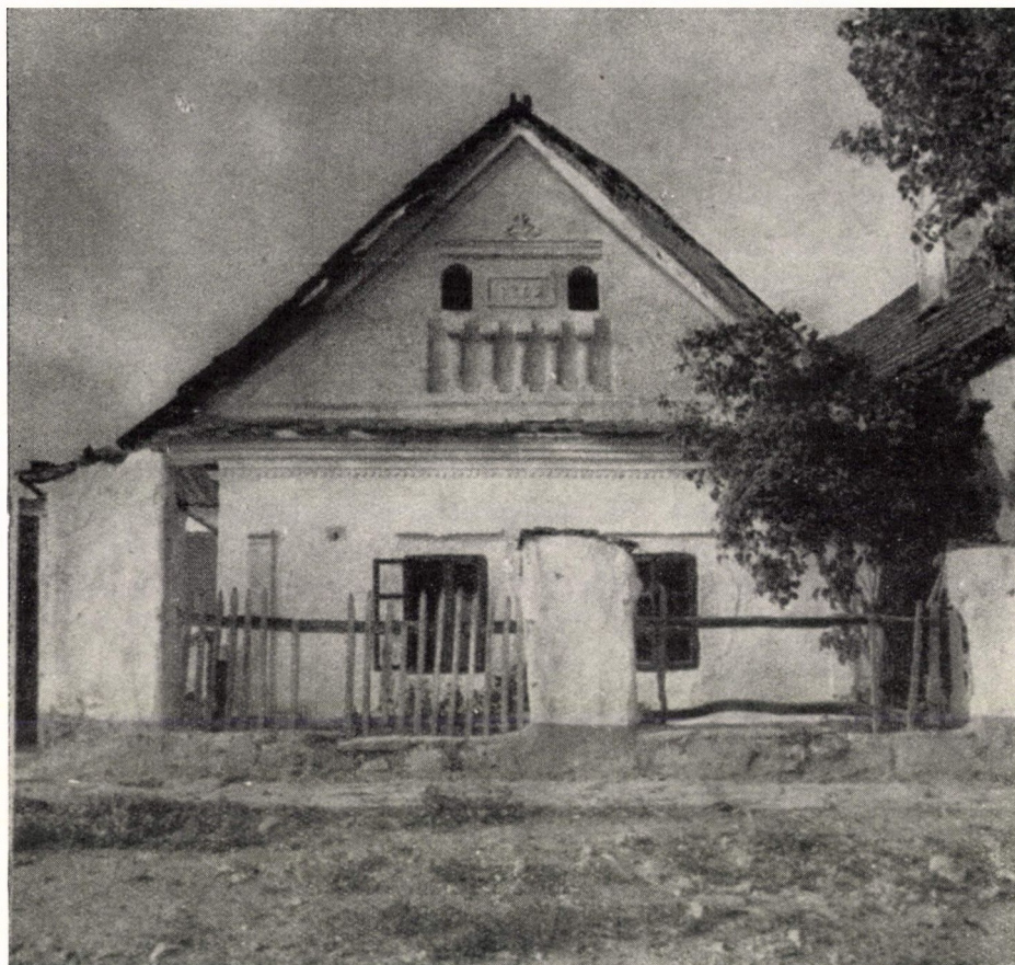
16. ábra. Lakóház. Perkupa, Borsod-Abaúj-Zemplén m. Az előző kismemesi udvarház homlokzatának népi — paraszti — változata. Ép. : 1869.

zás', az 'eredet' nem egyéb akár őstörténeti, akár csak 100—200 éves elkülönülésnél, 'elvállalkozásnál' egy korábbi etnikai közösségtől — (egy korábbi művészeti közösségből). — Ez az elkülönülés — a korábbi egységből (csoportból) némely jegyeket megtart, másokat elhagy s adódó új népközi helyzetében, földrajzi környezetében némelyeket elsajátít, magához hasonít (asszimilál), másokat nem is érint." 8 Úgy vélem, hogy ez a néprajzi alaptörvény jelen esetben a közép-európai művészet hazai és a szomszéd népi építészet alkotásaira is egyaránt érvényes.