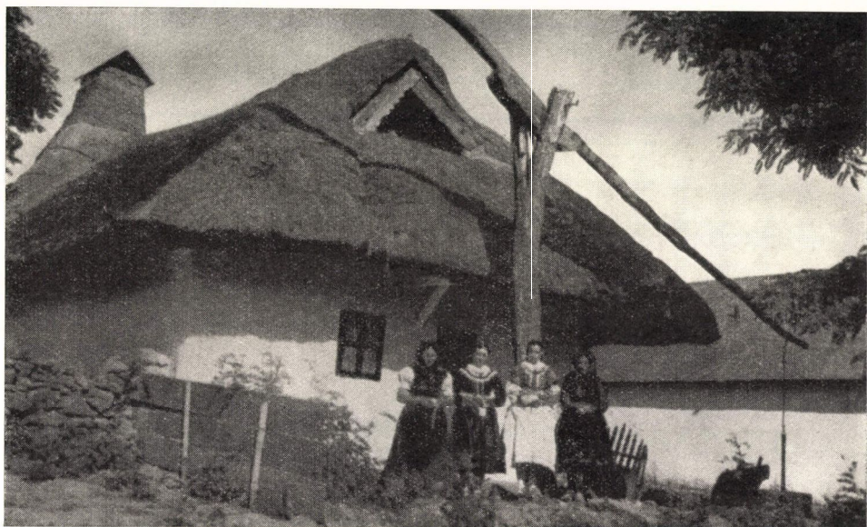
10. ábra. Vízvetős, füstlyukas lakóház. Tard, Borsod-Abaúj-Zemplén m. Északi magyar — palóc — háztípus. Ép. : XIX. sz. első fele.