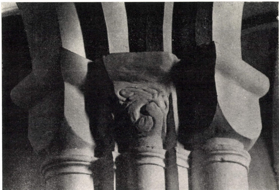
7. ábra. Kockafejezetes — gömbszelvényes — oszlopjök. Ócsa, Pest m. Református templom. Eredetileg premontrei kolostortemplom. Ép.: 1250 körül.