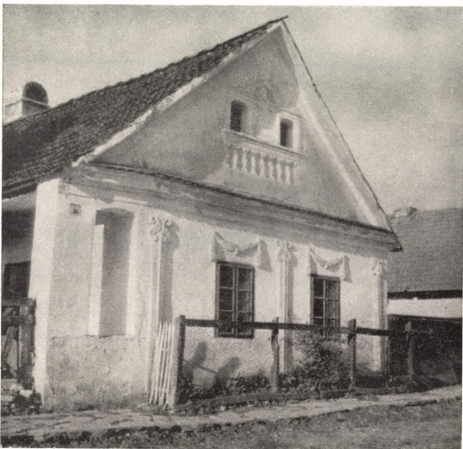
15. ábra. Udvarház. Perkupa, Borsod-Abaúj-Zemplén m. Kisnemesi udvarház barokkos és copf jellegű homlokzata. Ép. : 1850 körül.

Hasonlóan több változat — stílusbeli eltérés, stílusbeli sajátosság — figyelhető meg a fatemplomok és a faharanglábak, a faharangtornyok alakításában, ami az egymástól eltérő, vagy korszakonként is változó stíuselemek szerves alkalmazását, vagy sok esetben egymástól függetlenül is, azonos felfogásban őrizte meg, minden eltérő etnikai sajátosság mellett. A szlovákiai, a magyar, a román fatemplomok, egyházi épületek faalkatrészeinek ismerete ezt az alapvetően közös vonást, a népnagyomány rendkívül konzerváló erejét, megtartó erősségét bizonyítja. 7 Annál is inkább, mivel „... az etnikum — (a népi építészet) — legkorábbi szakaszára származása vet világot. A „szárma-