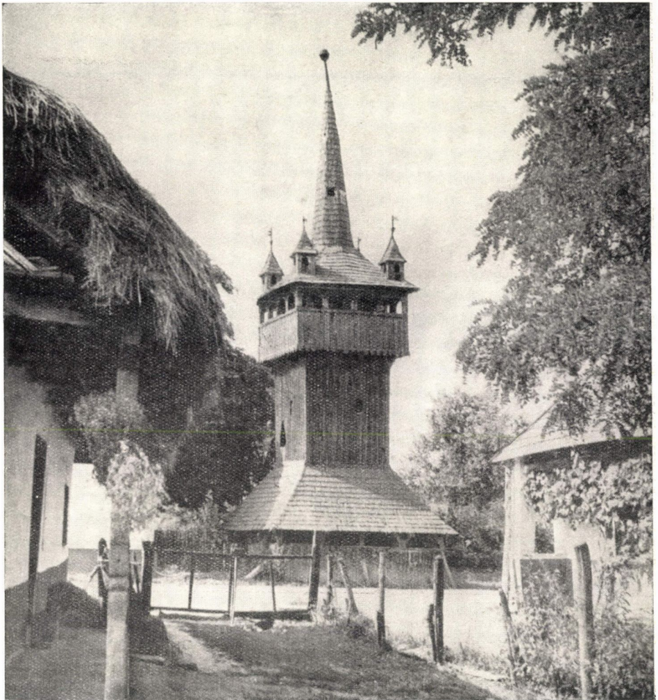
5. ábra. Harangtorony. Szabolcs-Szatmár m. Nemesborzova. Széles tornáccal körül- vett, négyfiatornyos tornácos toronysisakkal épült fatorony. Ép.: 1690.

elzárkózva? Nincs-e mindez a település idejével, mikéntjével összefüggésben? Nem lehetne-e a népzenei kutatások szolgáltatata adatokkal bizonyos vitás kérdéseket eldön- teni, vagy pl. bizonyos érveket velük megtámasztani? Vagy — ha talán már eldöntött kérdésekről van szó — nem erősítenék-e meg az eredményt ezek a zenei adatok? Bár feleletet ezekre a kérdésekre nem adhatok, mégis felsorakoztatom annak szemléltetésére, hogy az összehasonlító népzenei kutatás nem is olyan szürke, elvont, céltalan tudomány- ág, amilyennek talán sokan gondolják, hanem igenis bekapcsolódhatik más gyakorlati- asabb tudomány-ágakba és befolyással lehet a nagy tömegek számára vonzóbb kérdések eldöntésére is.” 31. l.