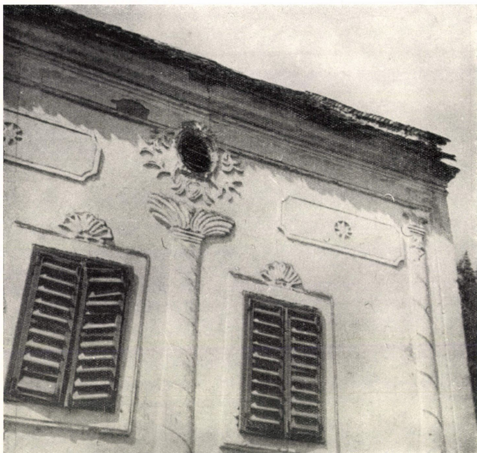
14. ábra. Festőház. Szendrő, Borsod-Abaúj-Zemplén m. Kétfestőműhely barokkos jellegű homlokzata, részlet. Ép. : XIX. sz. közepe.

feltűnnek, de általában a XVII. sz. elejétől maradtak fenn. Elsősorban a gabonásokra — hombárokra — és a fatemplomokra, a faharangtornyokra gondolok. A fából épült, legtöbbször még szántalpas vagy cölöpökre emelt rövidereszű, nyeregvetős gabonások, eleségtartó kamrák még korábbi építőtevékenység — őskori építmények — maradványai, s euráziai elterjedésük a Földközi tengertől Skandináviáig és Ázsia távol északkeleti részéig megfigyelhető. A fából készült gabonások térbeli és időbeli nagy elterjedettsége, ennek az épülettípusnak funkcionális, építőanyagbeli és szerkezeti, valamint formai alakításában is egyaránt rendkívüli nagy jelentőségét igazolja. Szinte a népek, a nemzetek fölötti építőtevékenység beszédes bizonyítékai, de elsősorban a közép-európai népi műveltségállomány történeti építészeti emlékanyaga. 6