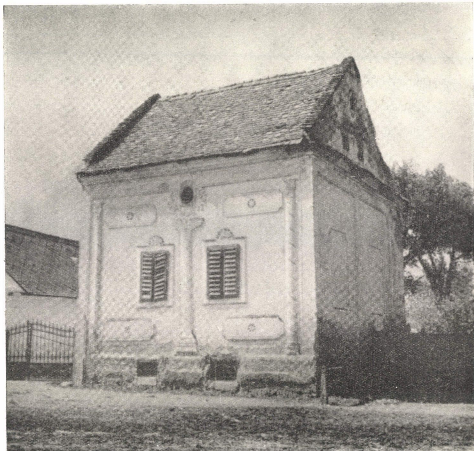
13. ábra. Festőház. Szendrő, Borsod-Abaúj-Zemplén m. Kétfestőműhely barokkos jellegű homlokzata. Ép.: XIX. sz. közepe.

Bár ezek a kiragadott példák túlnyomóan a folklór s a népi díszítőművészet területéről valók, összegezve és végső példaként megemlíthetem még azokat a magyar, román, szlovák, délszláv és orosz faépítményeket, amelyek ugyan már a középkorban