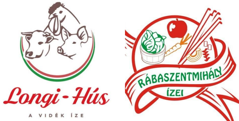
3. ábra: Helyi termék logók a vizsgált szociális szervezeteknél