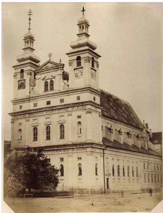
3. kép: a Keresztelő Szent János-templom homlokzata (1865)