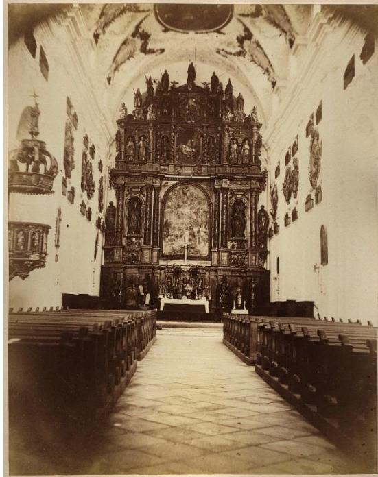
4. kép: a Keresztelő Szent János-templom belülről (1865)