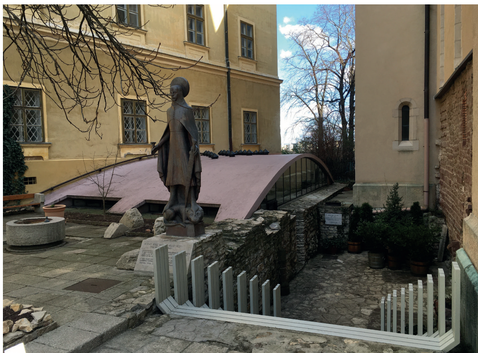
1. kép. Veszprém, a Szent György-kápolna védőépülete. Tervező: Erdei Ferenc, 1967

Előadásom apropója az a hetvenszer megosztott Facebook-bejegyzésem, melyet az Erdei Ferenc tervezte veszprémi Szent György-kápolna védőépületének érdekében írtam 2022 elején. Ekkor láttam ugyanis napvilágot a székesegyház rekonstrukciójának látványtervei, s ezeken egy üveg-beton kubus helyettesítette az 1967-ben az Ybl-díj II. fokozatával jutalmazott alkotást. Azok a tervek, majd az építkezés, felszámolták Erdei művét, indokolt lenne tehát egy nekrológ, hiszen a magyar épületanyag egy remek épülettel lett szegényebb. (1. kép) Én azonban ehelyett a civilizált