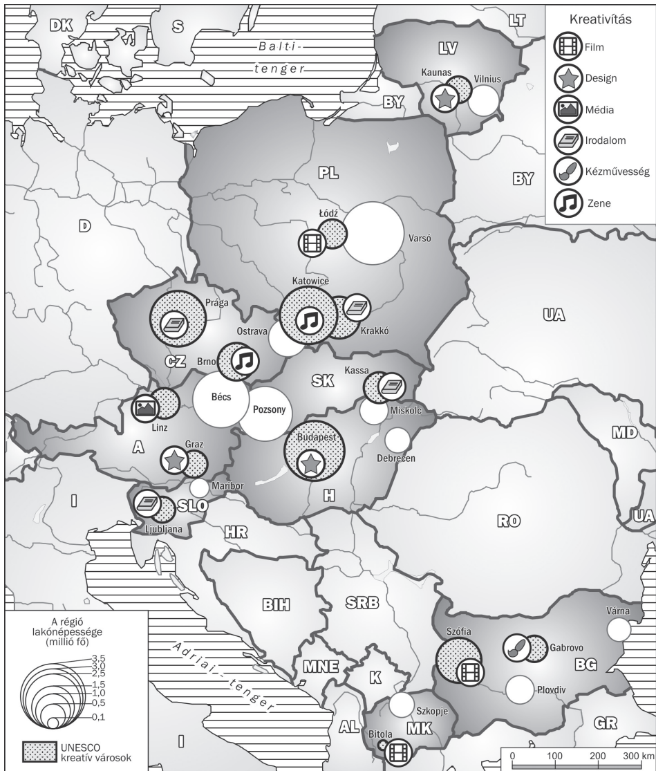
2. ábra Fővárosi régiók és az UNESCO kreatív városok lakónépességének összehasonlítása (az EUROSTAT adatai alapján szerk. IRIMIÁS A., rajzolta KAISER M.-NÉ)