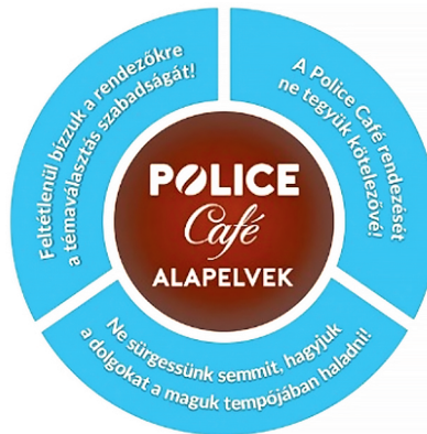
2. ábra: A Police Café alapelvei

Miként a World Café, a Police Café is vannak alapelvei (2. ábra).