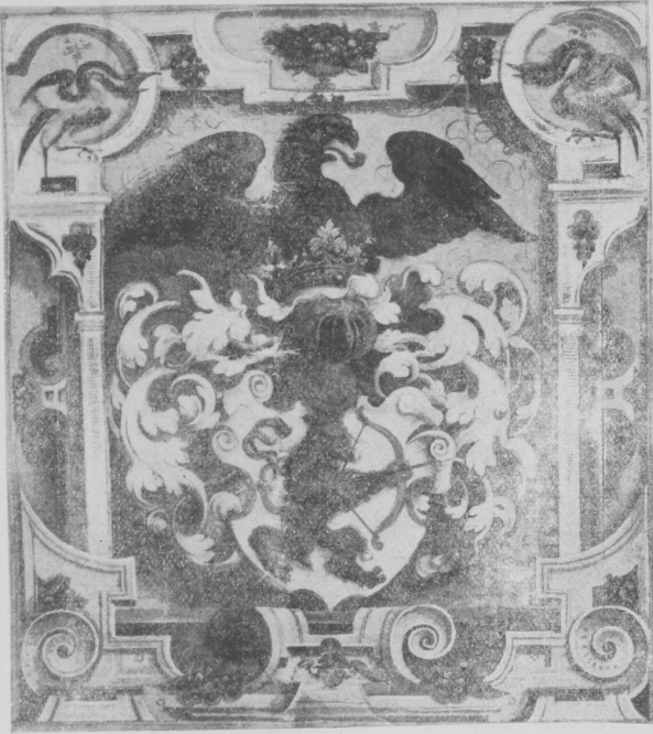
1. Bocskay 1549 júl. 25.