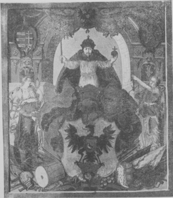
2. Pető 1621 márc. 16.