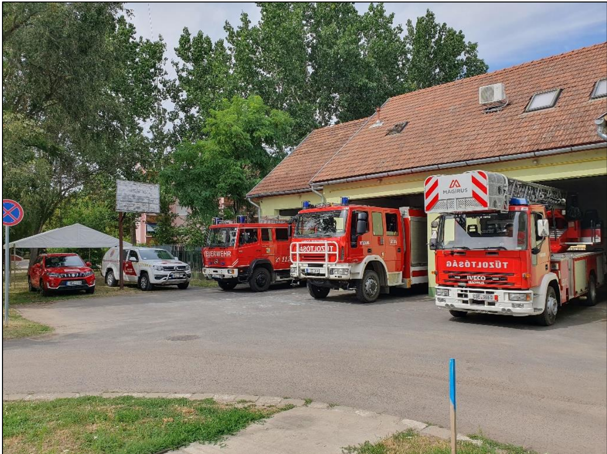
5. kép A tótkomlói önkéntes és önkormányzati tűzoltók járművei napjainkban (Forrás: ld. [5])

2012-ben a jogszabályváltozásoknak megfelelően, a Tótkomlós ÖTE együttműködési megállapodást kötött a Mezőkovácsházi Hivatásos Tűzoltóparancsnoksággal. 2013-ban a Tótkomlós ÖTE a megalakult Dél-Békés Mentőcsoport – majd 2023-tól Viharsarok Mentőcsoport – tagszervezetévé vált, ennek keretein belül is több alkalommal pályázott sikeresen, továbbá kiemelkedő eredményként 2020-tól ellátja egy Volkswagen Amarok típusú terepjáró gépkocsi üzemeltetési feladatait. Emellett ugyancsak 2020-ban az egyesület a Mercedes-Benz MB 1113B TLF helyett beszerzett egy lényegesen fiatalabb Mercedes-Benz MB1120 típusú gépjárművet. Azonban az eszközpark bővülése nem állt meg, az idei évben beszerzésre került egy Iveco Magirus DLK 18-12 típusú magasból mentő gépjármű.