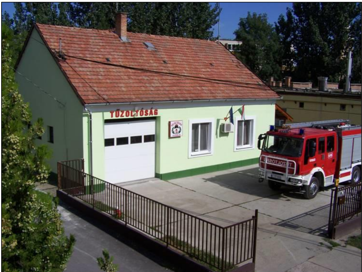
4. kép A tótkomlói önkéntes és önkormányzati tűzoltók laktanyája madártávlatból (Forrás: Id. [5])

A két szervezet egy helyen, a már említett tűzoltólaktanyában állomásozik, jelentős előnyt biztosítva az épület fenntartásában, az eszközök használatának, működőképességének biztosításában, illetve az utánpótlásnevelésben is. 2005-től több lépcsőben sor került a laktanya bővítésére, amely ezáltal megfelel a XXI. századi követelményeknek. A Tótkomlós ÖTE 2006-ban oroszországról vállalt a Békéssámsoni Önkéntes Tűzoltó Egyesület újraindításában, az állomány képzésével, eszközátadással, továbbá kiemelkedő támogatásként a 2009-ben beszerzett Nissan Vanette Cargo típusú jármű 2020. évi átadásával segítette, illetve segíti azóta is a társegyesület működését.