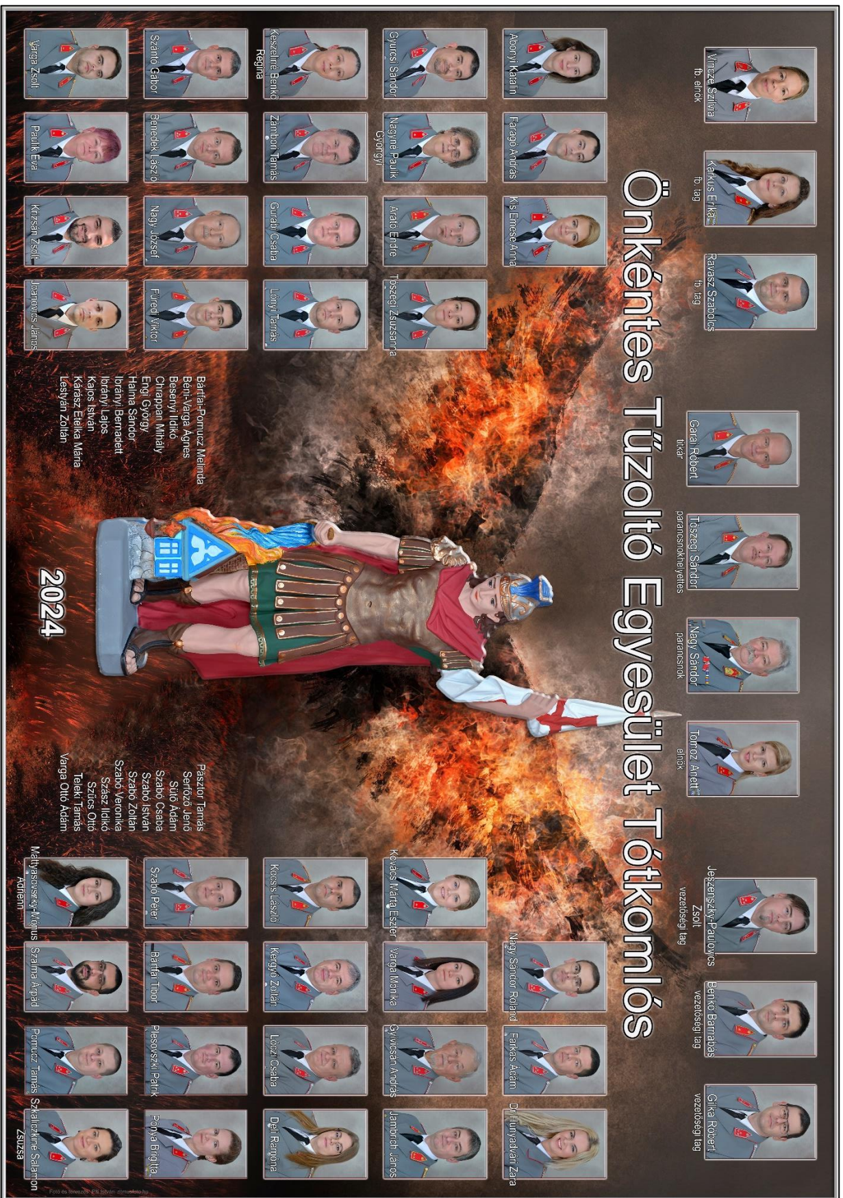
6. kép A Tótkomlós ÖTE tagsága 2024-ben