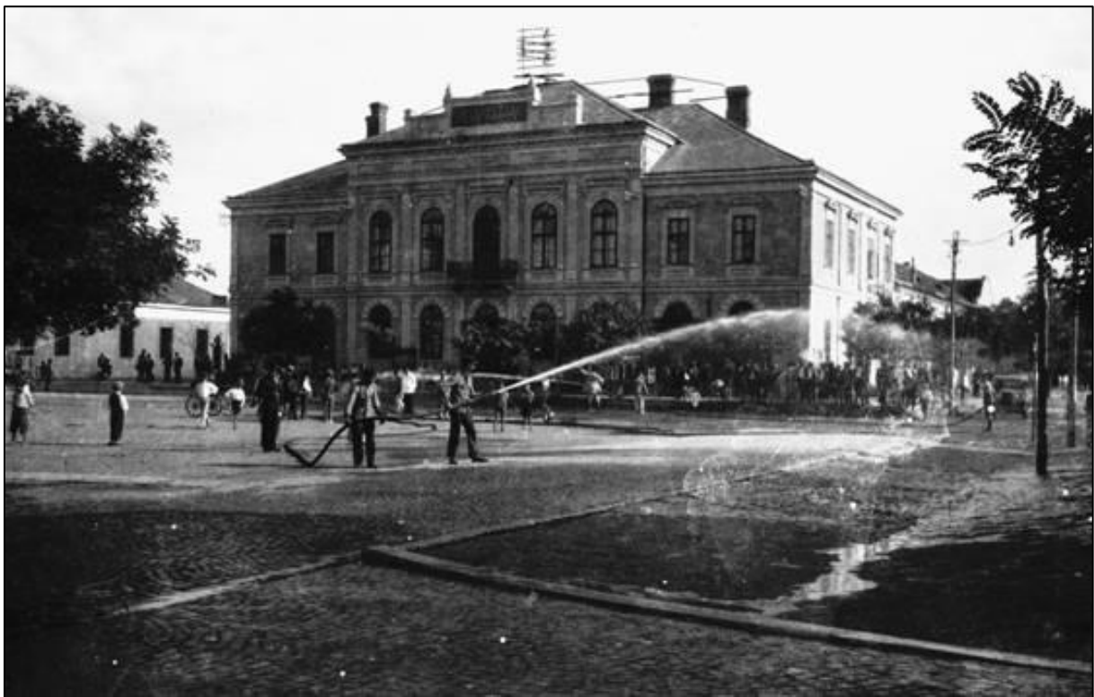
1. kép Tűzoltási gyakorlat 1933-ban a Komló szálló előtt (Forrás: ld. [5])

A Tótkomlói Önkéntes Tűzoltó Testület 1924. április 16-án tartotta alakuló gyűlését, melynek alapszabályát a Magyar Királyi Belügyminisztérium a 224.068/1925/VIII. számon, 1925. október 15-én hagyta jóvá. [1] Az egyesület 30 tényleges- és 33 (mai szóhasználat) pártoló taggal jött létre. Az ekkoriban községi rangú helység a tűzoltóságot a Magyar Országos Tűzoltó-Szövetség 1898-ban kiadott szabályzata alapján állította és szerelte fel. [4] A szabályzat rendelkezései szerint a szolgálatot vállalók egyenruhát és sisakot, valamint tűzoltó baltát, mászóövet, sípot kaptak. Mindezen felül, a tűzoltási tevékenységben részt vevők fizetésben is részesültek. A megalakulást követő időszakban, az egyesület és a település vezetése a legnagyobb hangsúlyt az állomány felkészítésére fordította, amelynek eredményeképpen az 1930-as évek elejére megfelelően képzett, a település védelmét hatékonyan ellátó tűzoltóság jött létre.