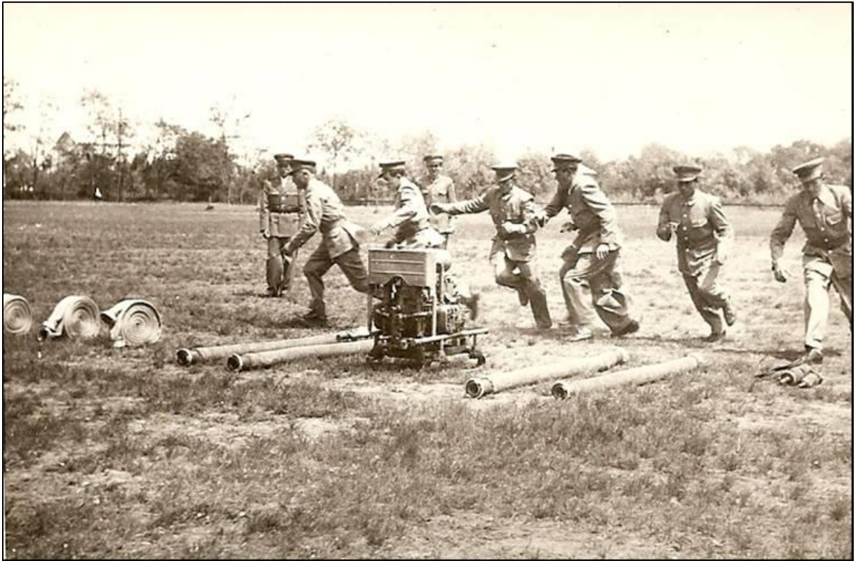
3. kép Tótkomlói tűzoltók az 1960-as években (Forrás: ld. [5])

Így 1958-ban a település valamennyi lakóházát megvizsgálták tűzvédelmi szempontból, amely a kémények és füstcsövek állapotára, az éghető anyagok (kiemelten a szálaskarmány, tüzelő- és fűtőanyag, üzemanyag) tárolási szabályainak betartására, a villamos hálózat állapotára, valamint a tűzjelzés szabályainak ismeretére terjedt ki.