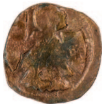
II. Ottokár bécsi denárjának (CNAB163.) hamis,

Az anyagban több hamis denár is megtalálható, ez pedig erősíti a tényt, hogy ezek elhagyott, vagy eldobott pénzek lehettek: ha gazdájuk felismerte, hogy hamis pénzzel verték át, feltehetően elhajíthatta azt. Rézből készült hamis pénzt II. Ottokár bécsi, V. István király idején vert szlavón vagy I. Ulászló és V. László királyok ezüst denárjainak mintájára.