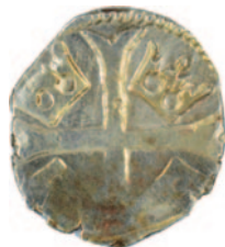
és ép példánya

Összességében elmondható, hogy az éremanyag vizsgálata alátámasztja a történeti kutatás, és a régészeti megfigyeléseket: a monostor a 11. század első felében épülhetett, és ettől kezdve folyamatos használatban volt a 16. század közepéig bizonyosan.