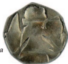
és eredeti példánya

A leletanyagban más feltárásokhoz hasonló tendenciák mutatkoznak. Luxemburgi Zsigmond (1387–1437) parvusait szinte a felismerhetetlenségig csonkították, vagyis a használat során el-el vették a nemesfém tartalmát. Az 1440 és 1457 közötti belháborúk idején sok, rossz minőségű, kevés ezüstöt tartalmazó, úgynevezett billon veret volt forgalomban, mivel nem volt erős központi hatalom a pénzverés minőségének ellenőrzésére. Hunyadi Mátyás királytól kezdve a pénzek verdehelye könnyebben azonosítható: egyértelmű, hogy a középkor végén a közeli körmöcbányai verdéből kerültek a térség pénzforgalmába az érmék.