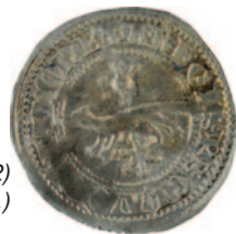
V. István király idején (1270–1272) vert szlavón denár (Unger: Sz.12.)

A legkorábbi veret I. András denárja, ez 1046–1060 között készült. Ettől kezdve a teljes Árpád-korra datálhatók érmék, Salamon királytól az ún. anonim (néma) denárokon át IV. László királyig szinte minden uralkodó pénze megtalálható. Az érmék száma jól tükrözi a középkori pénzforgalom fellendülését a 14. századtól, I. Ferdinándig minden uralkodótól több veret maradt fenn. A legfiatalabb magyar veret II. Ferdinándhoz (1624) köthető. Az összesen 74 darab magyar pénzérme időbeli megoszlását az alábbi diagram mutatja be: