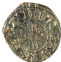
I. András király denárjának (H: 9.; Opitz I. 4.4.) előlapja

Az érmék elemzése során egyértelmű, hogy a föld alól, zömmel elhagyott érmék kerültek elő, hiszen a legtöbb nem sírmellékletként került elő, hanem a törmelékből, a templom és a monostor más területének objektumaiból. Mindemellett kis értékű, ezüst vagy billon, több esetben hamis pénzről van szó, ami nem vagyontképzést, vagy reprezentációs célt szolgálhatott. Ez a típusú leletanyag alkalmas arra, hogy meghatározzuk a feltárt terület használatának időszakát.