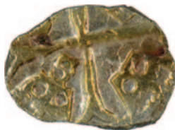
Luxemburgi Zsigmond király parvusának (H: 582.) körülnyírt (csonkított)

A leletanyagban más feltárásokhoz hasonló tendenciák mutatkoznak. Luxemburgi Zsigmond (1387–1437) parvusait szinte a felismerhetetlenségig csonkították, vagyis a használat során el-el vették a nemesfém tartalmát. Az 1440 és 1457 közötti belháborúk idején sok, rossz minőségű, kevés ezüstöt tartalmazó, úgynevezett billon veret volt forgalomban, mivel nem volt erős központi hatalom a pénzverés minőségének ellenőrzésére. Hunyadi Mátyás királytól kezdve a pénzek verdehelye könnyebben azonosítható: egyértelmű, hogy a középkor végén a közeli körmöcbányai verdéből kerültek a térség pénzforgalmába az érmék.