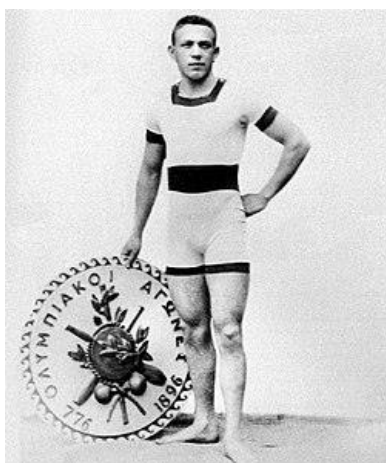
1. kép: Az olimpiai győztes, az építész és az éremhalmozó Hajós Alfréd

Közkeletű megállapítás, hogy sportnemzet vagyunk. Ezt leginkább élsportunk nemzetközi sikerei bizonyítják, különösen az újkori olimpiai játékokon elért nagyszerű eredményeink. Ezek közül a későbbi szerepünket megalapozó és meghatározó sporttörténelmi dátum 1896. április 11-e: ezen a napon rendezték az olimpiatörténet első úszóversenyét az első újkori játékokon Athénban, amelyet Hajós Alfréd nyert meg, a klasszikusnak számító 100 méteres távon diadalmaskodott. Nem sokkal később 1200 méteren is győzött, elindítva a magyar úszósportot későbbi világhódító útjára. Emlékezzünk néhány, talán kevésbé ismert érdekességgel rá és lenyűgöző életpályájára, melynek 77 évét teljes életként jellemezhetjük. 18 évesen gyorsúszó bajnok volt, de atletizált is (futás, gerelyhajítás, ötpróba), majd válogatott labdarúgó, játékezető, szövetségi kapitány, sportvezető és újságíró lett, de elsősorban kiváló építész volt. Fontos középületeket, köztük uszodákat, stadionokat, kórházakat és iskolákat tervezett. Közismert, hogy a margitszigeti, ma a nevét viselő Nemzeti Sportuszodát is ő tervezte. Ez az írás is hozzá kívánt járulni Hajós Alfréd emlékének ápolásához, tisztelegve az utána következő 181 olimpiai aranyérmünk 307 győztese előtt is, azzal a nem titkolt ösztönző szándékkal, hogy történelemtanításunkban a sporttörténetnek is nagyobb szerepet szánjunk.