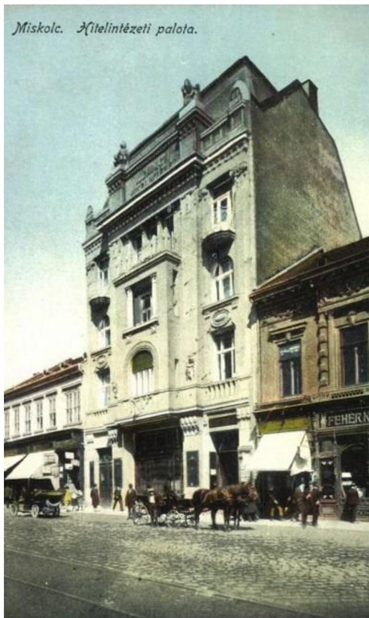
7. kép: A Borsod megyei Takarékpénztár

Első építészeti munkái közé tartozott volt iskolája, a Markó utcai Főreál Gimnázium torna- és rajztermének átépítése, majd sorra jöttek a nyertes pályázatok: a Borsod megyei Takarékpénztár épülete és a Református Konvent Abonyi utcai székháza (1909). Kezdetől részt vettek iskolák tervezésében, építésében-átépítésében is. Ezek a kőszegi Ferenc József Főgimnázium (ma Jurisich Miklós Gimnázium) (1907–1908), a szombathelyi Vakok Intézete (ma Nagy Lajos Gimnázium) (1910), a lőcsei Katolikus Főgimnázium (1910–1911) és a kolozsvári Vakok Intézete (1913). Ennek a kezdeti időszaknak a legjelentősebb munkája a debreceni Arany Bika Szálló Steidl Imre által 1882-ben tervezett épületének átépítése volt 1915-ben.