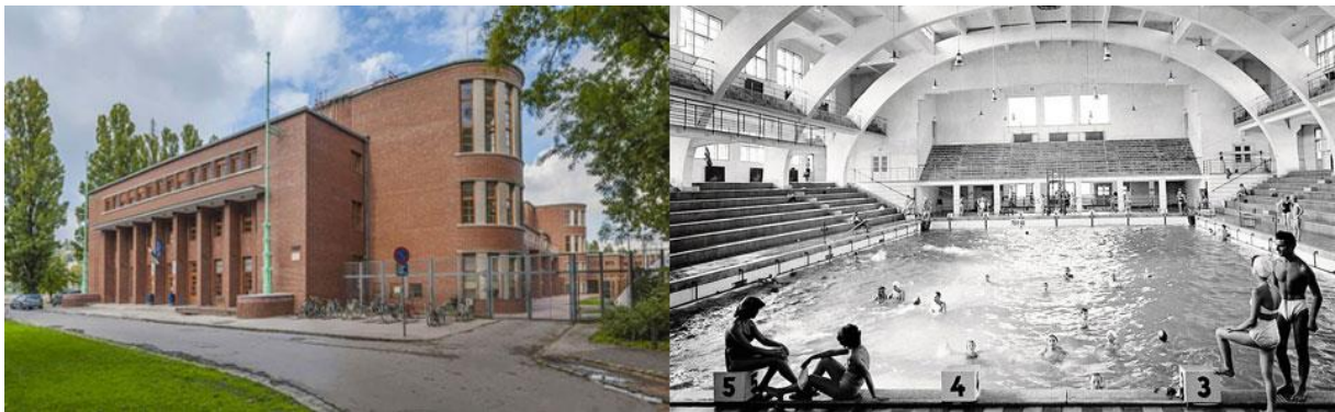
14. kép: A Nemzeti Sportuszoda épülete (1955 óta Hajós Alfréd Nemzeti Sportuszoda) 1930-ban átadott épülete és fedett medencéje

Kormányfőtanácsosi címe egy ideig védelmet jelentett számára a '30-as évek Magyarországn, a zsidó származásúak egyre nehezedő életkörülményei között. Bár még az úszósövetség alelnöke, állami megrendelése egyre ritkultak ( Győri Versenyuszoda , 1931; Balassagyarmati Strandfürdő , 1934–1935). Az Árpád híd megépítésére kiírt pályázaton 1931-ben Ritter Mórral együtt nyert ugyan, de az évtized végén már más tervei szerint indult az építkezés. Háború előtti utolsó nagyobb munkája a Munkácsy Mihály szálloda és bérház a Munkácsy utca és Andrássy út sarkán Budapesten (1937–1938), mely eredetileg a Pesti Izraelita Hitközség Alapítványi Fiúárvaháza, 1944-ben pedig a Nemzetközi Vöröskereszt zsidó gyermekeket mentő otthona volt.