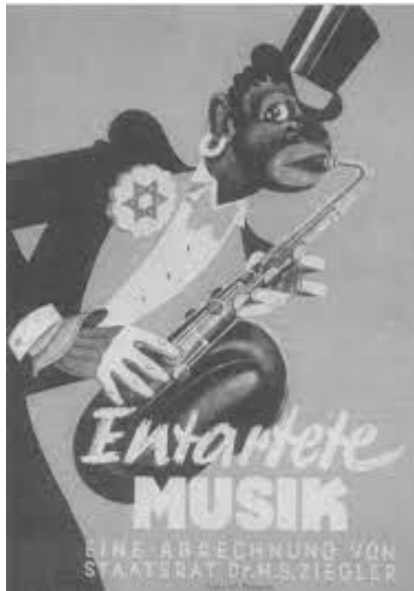
Nemzetiszocialista plakát 11

Ezután este az utcán, Eveyt három hivatalos közeg a kijárási tilalomra és annak végrehajtására hivatkozva meg akarja erőszakolni. A jelenet fontos, mert ráutal a 20. század közepi diktatúrák azon gyakori vonására, hogy a legalitás örve alatt követtek el terrorisztikus