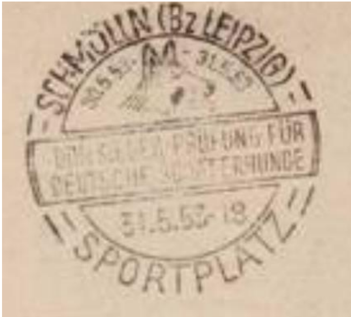
Német Demokratikus Köztársaság, 1953. 05. 31.