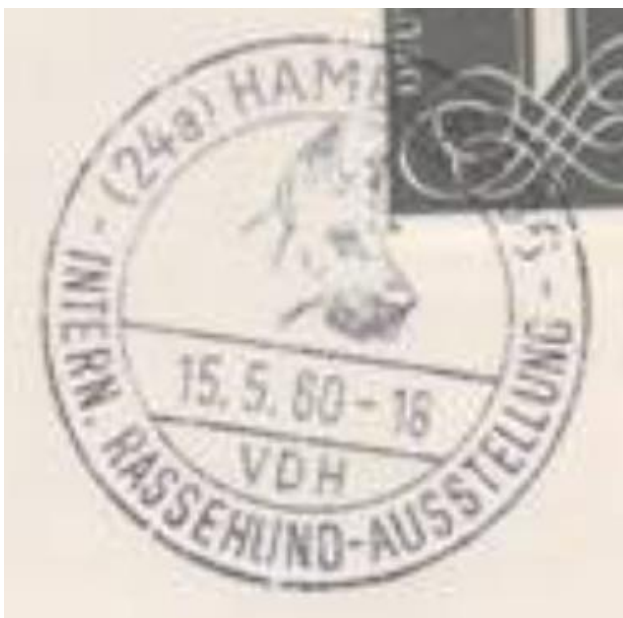
Német Szövetségi Köztársaság, 1960. 05. 15.