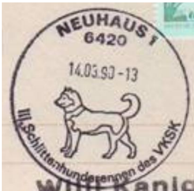
Német Demokratikus Köztársaság, 1990. 03. 14.