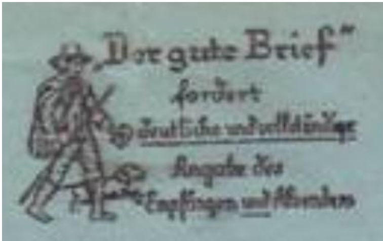
Német Birodalom, 1942. 10. 14.