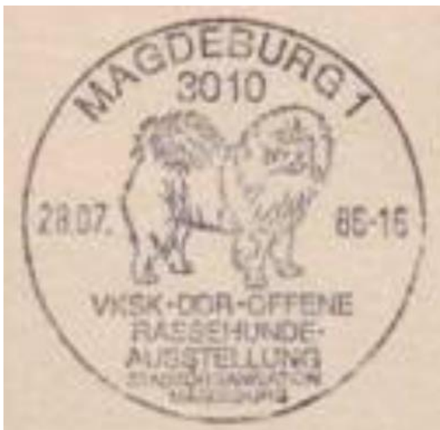
Német Demokratikus Köztársaság, 1986. 07. 28.