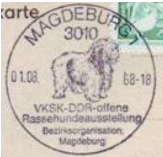
Német Demokratikus Köztársaság, 1988. 08. 01.