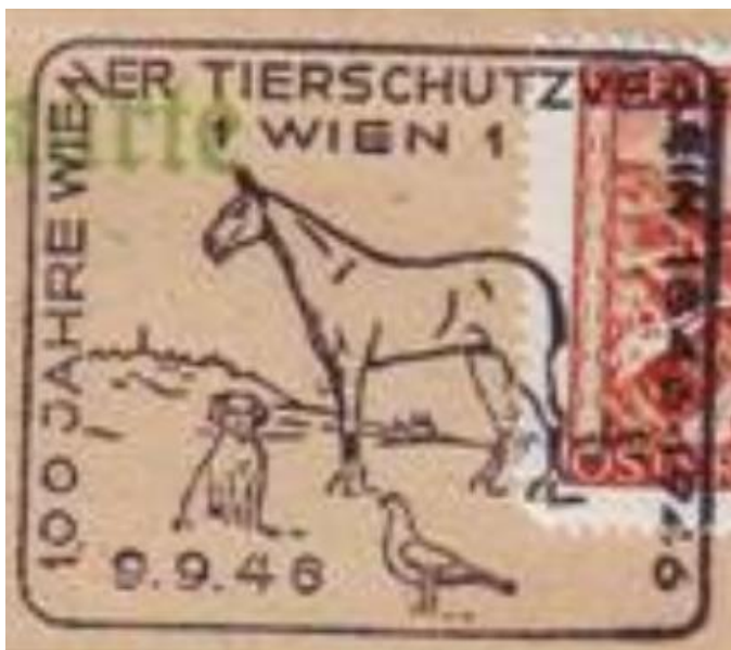
Ausztria, 1946. 09. 09.