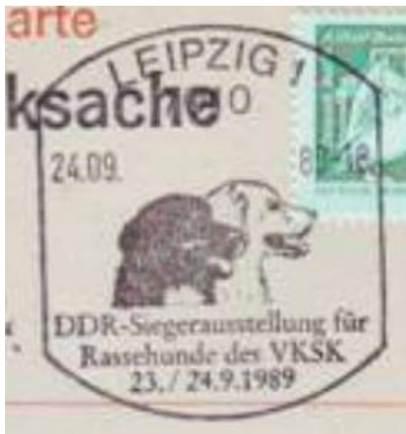
Német Demokratikus Köztársaság, 1989. 09. 24.