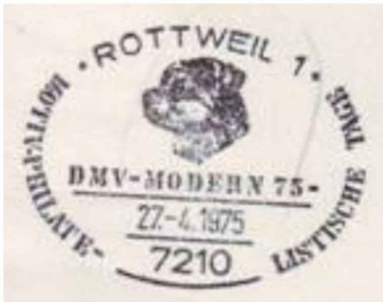
Német Szövetségi Köztársaság, 1975. 04. 27.