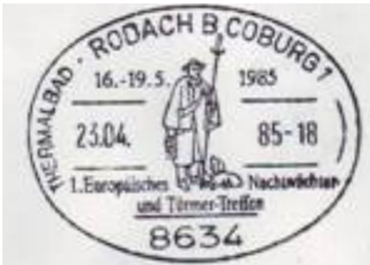
Német Szövetségi Köztársaság, 1985. 04. 23.