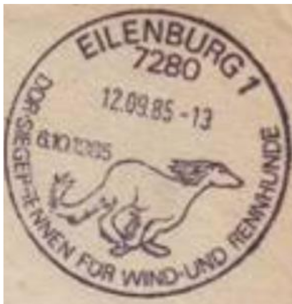
Német Demokratikus Köztársaság, 1985. 09. 12.