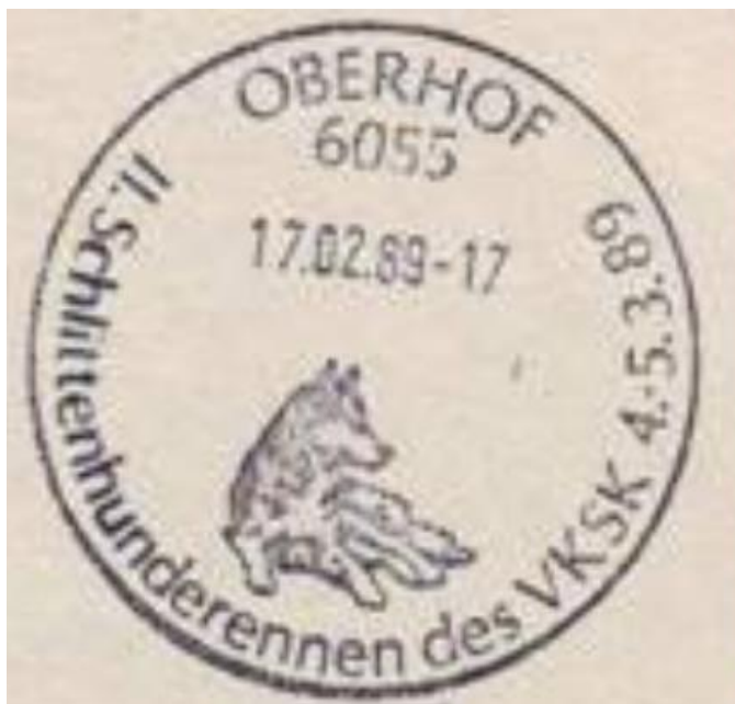
Német Demokratikus Köztársaság, 1989. 02. 17.