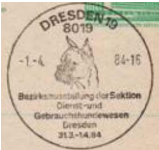
Német Demokratikus Köztársaság, 1984. 04. 01.