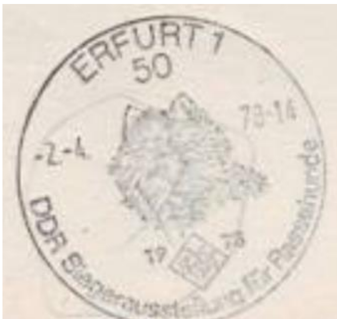
Német Demokratikus Köztársaság, 1978. 04. 02.