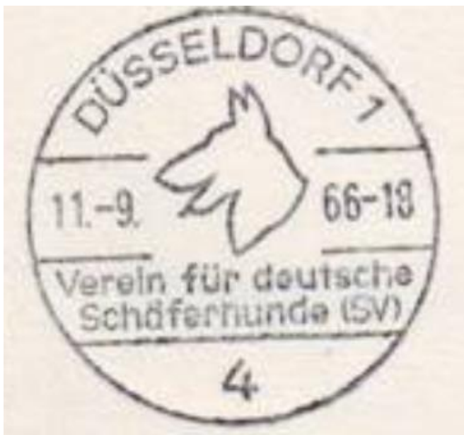
Német Szövetségi Köztársaság, 1966. 09. 11.