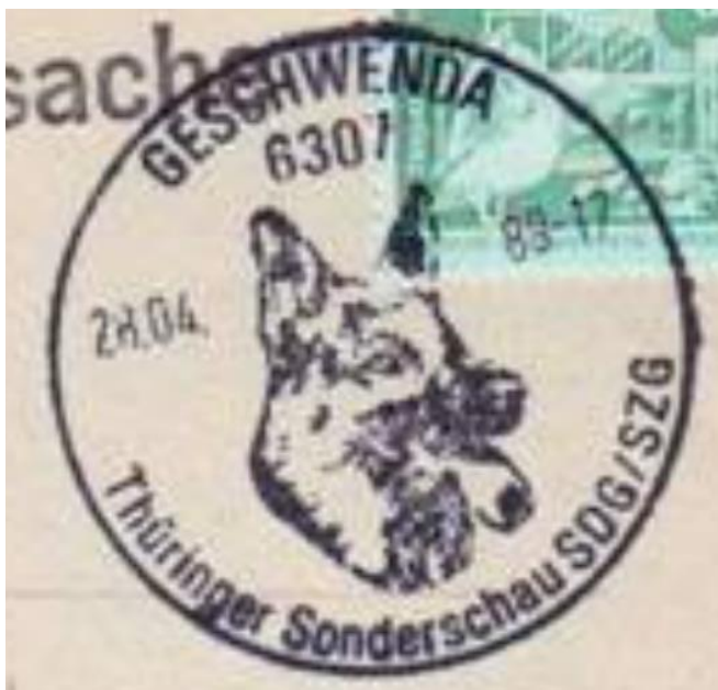
Német Demokratikus Köztársaság, 1989. 04. 28.