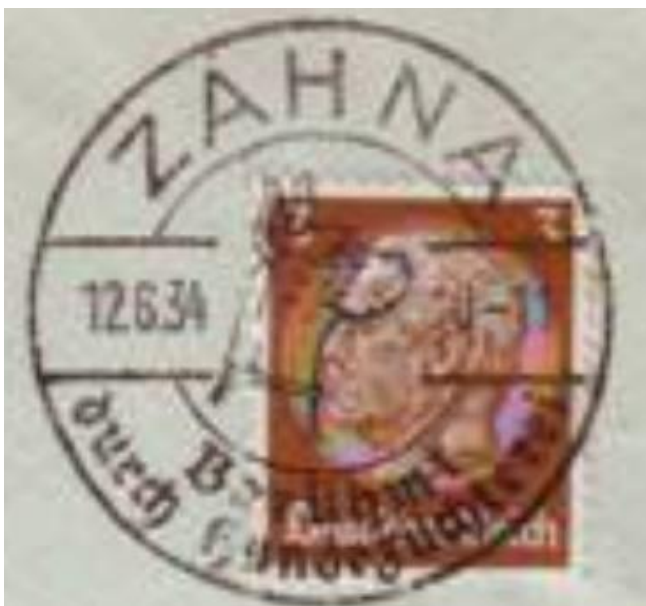
Német Birodalom, 1934. 06. 12.