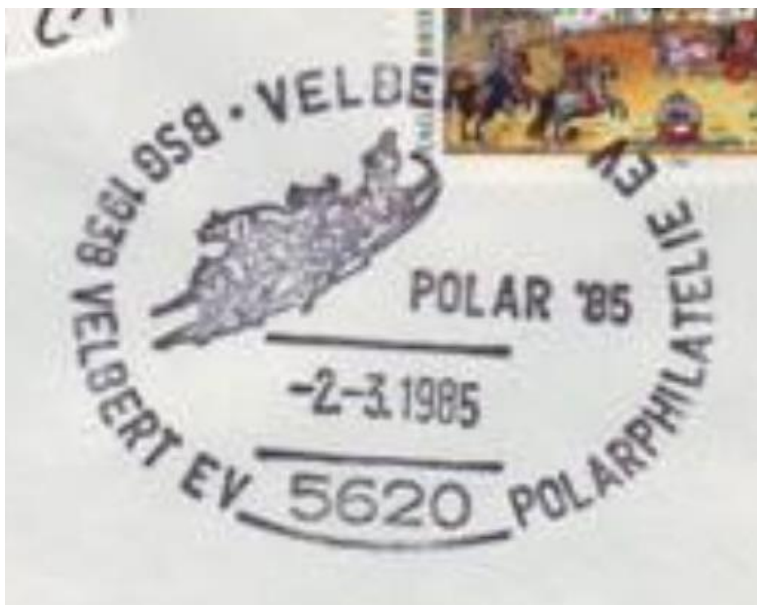
Német Szövetségi Köztársaság, 1985. 03. 02.