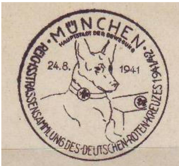
Német Birodalom, 1941. 08. 24.