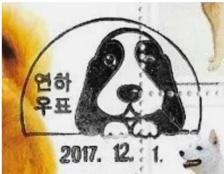
Dél-Korea, 2017. 12. 01.