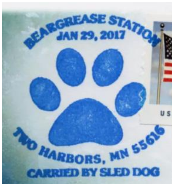
Amerikai Egyesült Államok, 2017. 01. 29.