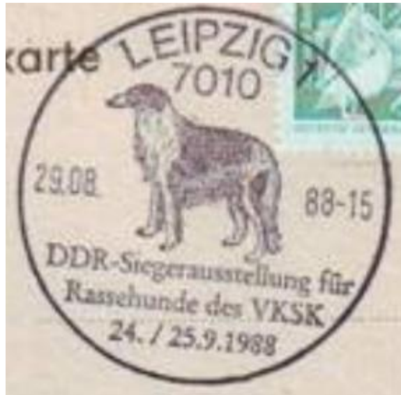
Német Demokratikus Köztársaság, 1988. 08. 29.