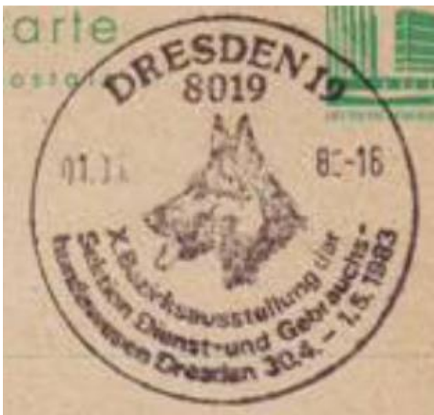
Német Demokratikus Köztársaság, 1983. 04. 30.