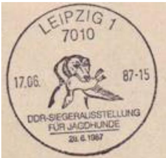
Német Demokratikus Köztársaság, 1987. 06. 17.