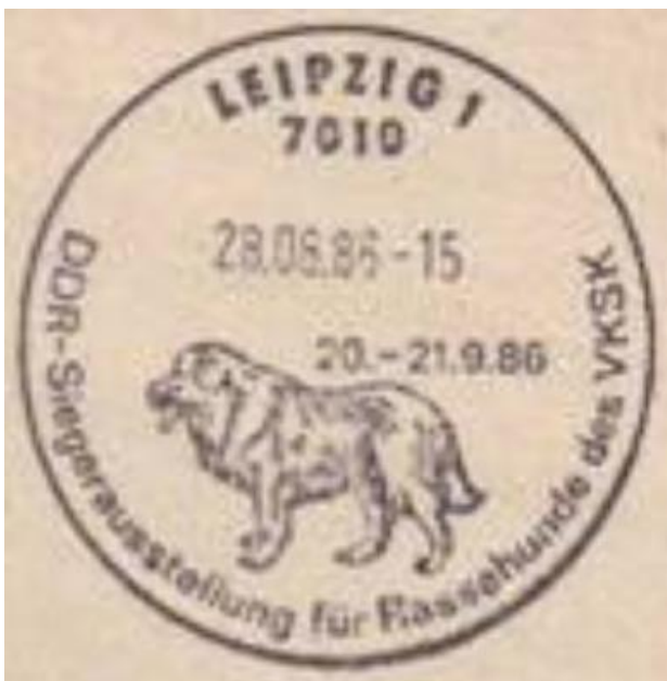
Német Demokratikus Köztársaság, 1986. 09. 20.