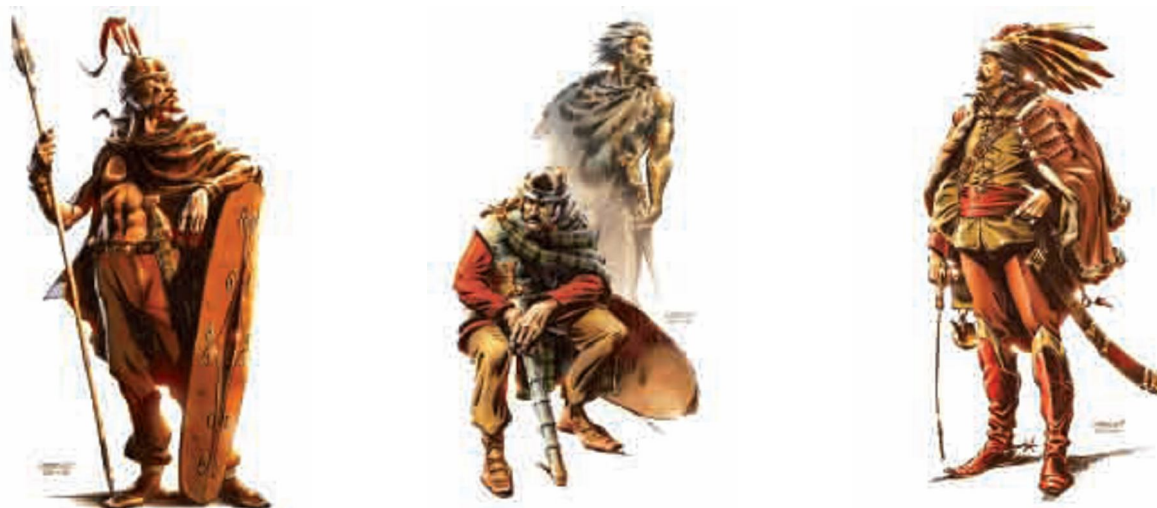
Illusztrációk az Élő történelem I. és II. tankönyvekből

Az Élő történelem I. könyvben 570 kép és rajz, 20 ábra vagy grafikon, 58 térkép és 260 szöveges forrás található. Ezek gyakran beékelődnek a főszövegbe, mintegy azt kiegészítve. Ez a korábbi tankönyvekhez szokott szemnek zavaró lehet, azonban ha megszokjuk, akkor értékelni tudjuk az előnyeit, hiszen a szöveg tartalmi részének megértését alapvetően megkönnyítik a hozzá kapcsolódó releváns vizuális elemek. A szerzők stílusára a letisztult, érthető fogalmazás a jellemző, a történelmi szakszavakat óvatosan, mindig magyarázattal együtt használják. A forrásokhoz kapcsolódó kérdések és feladatok világosak és érthetőek.