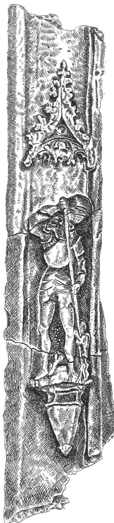
40. Szent Györgyös kályhacsempe Nyírbátorból. XV. század, 1:2 – Ofenkachel mit St. Georgenbild aus Nyírbátor, XV. Jh.

A fennmaradó mondák hagyományain túl a keresztény „jelképes természetrajz” elemei a románcor