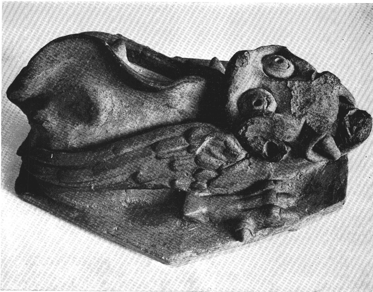
39. Nyírbátor, XVI. századi kályhacsempe. – Ofenkachel aus dem 16. Jh. in Nyírbátor.