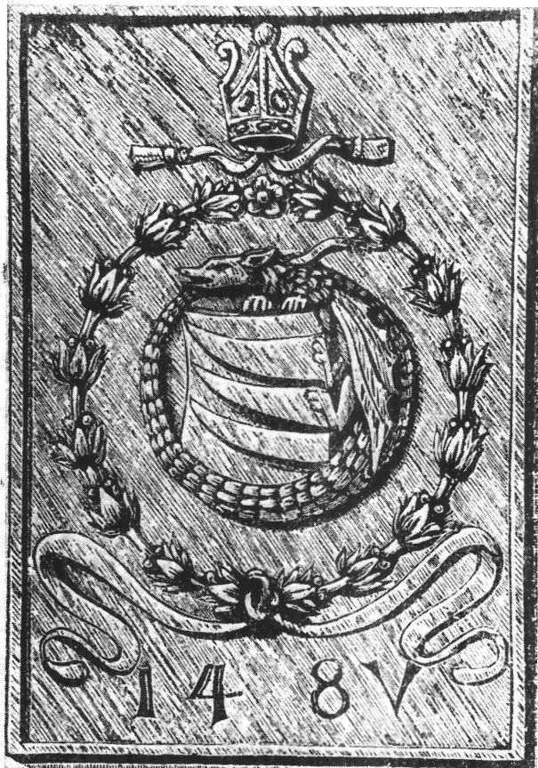
44. Báthori Miklós váci püspök címere. 1485. (Kalmár-Szalontai nyomán.) – Wappen des Vácer Bischofs Miklós Báthori.

váns ferencesek is segíthették. Hiszen az ő XV. századi térítőjelmük – a Napbaöltözött asszony mellett – éppen a Szent György. 133