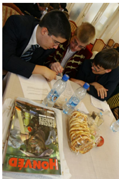
A 2009 márciusában megtartott országos döntőn készült képek 6