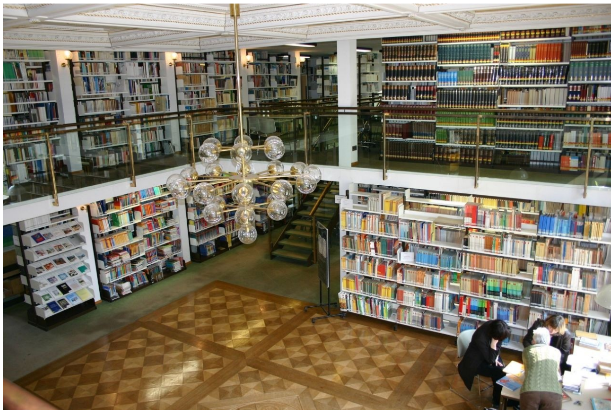
8. kép: Egy másik kép a könyvtár belsejéről