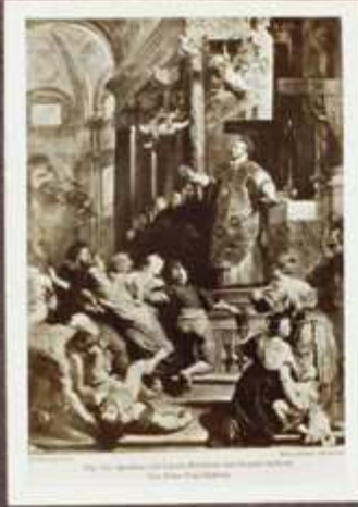
az ún. múzeum-album egy lapja, tabló