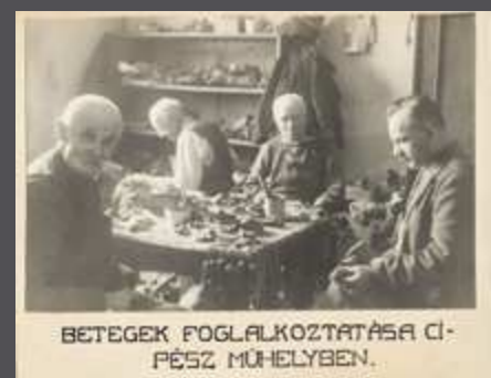
BETEGEK FOGLALKOZTATÁSA CI-PÉSZ MŰHELYBEN.