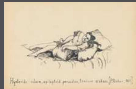
lapok Dr. Zsakó István vázlatfüzetéből