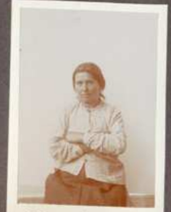
M.P. szobrász épelt.