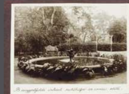
B. Angyalföldi színház, műhelyi és színház, 1936.