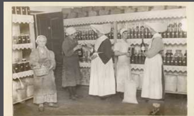
Élelmiszer roaktár. A.