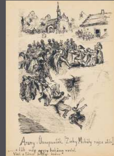
Arany Ünnepelek [Zichy Mihály rajza után] ... a lélek még egy búzára vadul. Váha a lélek [Zichy Mihály rajza után]