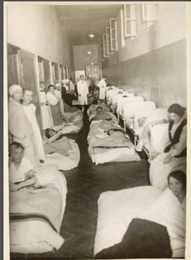
Zsufoltság a női nyugtalanban osztályon.