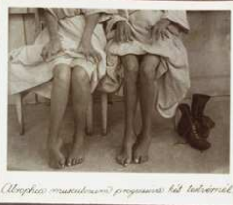
Ulysszesz muszkelvonal progressus két lábujjáról.