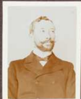
Reichleus férfi arcképe.