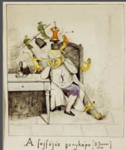
A fejfájás gúnyképe [H. Daumier után]