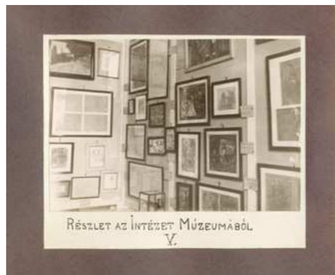
Enteriőr-képek az elmeügyi múzeumról (Selig-múzeum) az ún. múzeum-albumból, 1936 körül