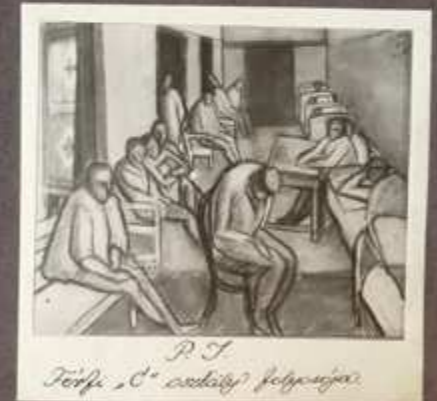
P. F. [Zichy Mihály rajza után]