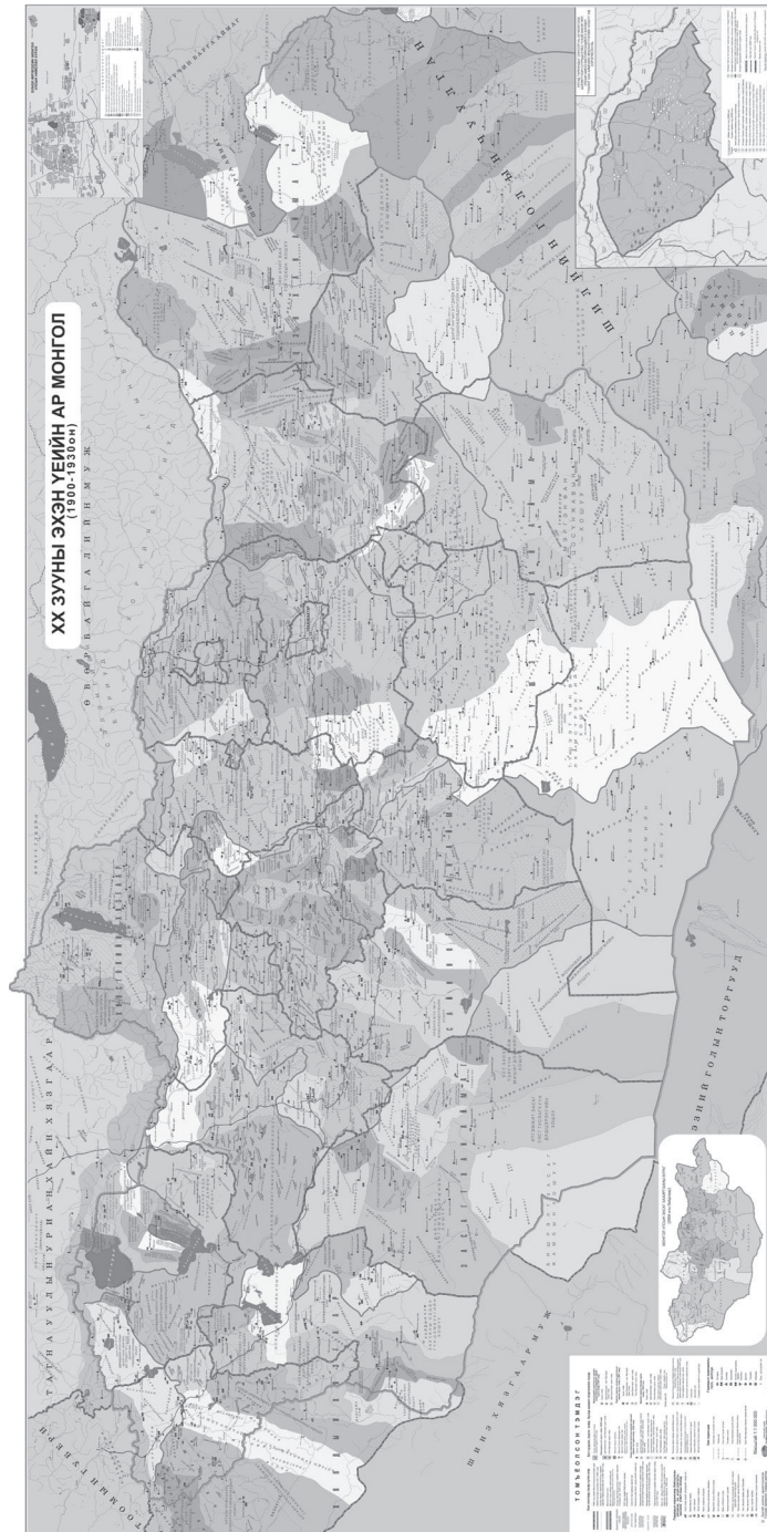
2. térkép A mongol területek 1900–1930 között