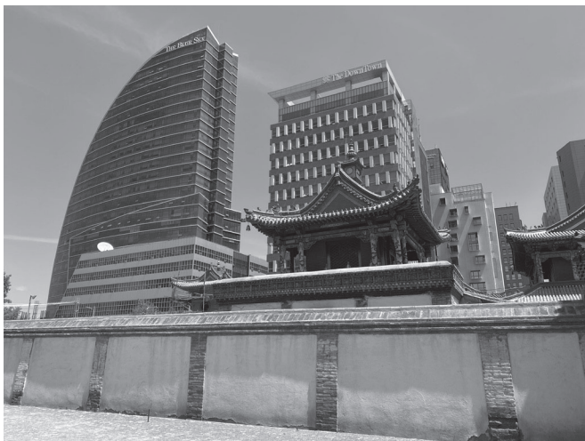
30. kép A mai Ulánbátor. Előtérben a Choijin láma kolostormúzeum épülete, a háttérben modern felhőkarcolók (2023.)

meghaladta az egymillió főt, 698 mára inkább a másfél milliót közelíti, vagy meg is haladja azt. 699 Évről évre szemmel is jól követhető, ahogyan a fővárost körül ölelő dombokon a betelepülők által épített jurtanegyedek fokozatosan egyre magasabbra kúsznak, sőt az északra eső területen már át is nyúlnak a dombok túloldalára.