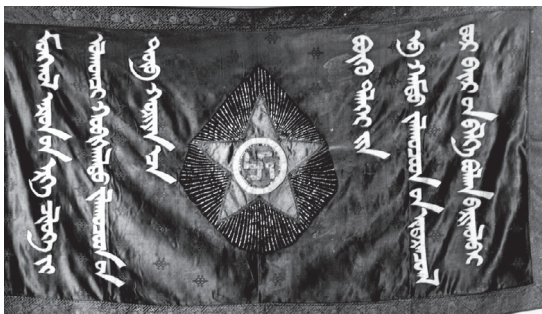
16. kép A Mongol Forradalmi Ifjúsági Szövetség ünnepi lobogója. Közepén vörös csillaggal és szvasztikával (1930-as évek.)

Tsedenbal a masszív személyi kultuszt kiépítő mentora helyébe lépett, így bizonyos értelemben örökölte az egyszemélyi vezetéssel szemben kialakult bírálatokat is. Hatalmát azonban sikerült úgy stabilizálnia, hogy ezek a bírálatok soha nem érték el a kritikus mértéket vele kapcsolatban. A brutális diktatúrát létrehozó Choibalsannal szemben, a Tsedenbal nevével fémjelzett korszak jóval konszolidáltabb időszaka volt a 20. századi mongol történelemnek, mint az 1921-es forradalmat követő két és fél évtized. Az új vezető jól kezelte a sztálini kormányzati módszerekkel szemben kialakult hazai kritikákat, és képes volt reagálni az SZKP 1956-os huszadik kongresszusa utáni desztalinizáció jelentette kihívásokra, az ekkor megfogalmazódó szovjet bírálatokra is. Ennek érdekében sikeresen fenntartotta a párton belüli hierarchiát, továbbá folyamatosan ellenőrizte a fősodortól eltérő politikai elképzeléseket vallókat a politikai és közéletben egyaránt.