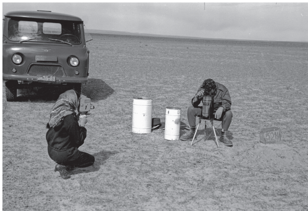
28. kép Magyar mérnökök mongol munkatársaikkal (1969.)

Magyarország – mint a KGST-n és a keleti blokkon belül Mongólia patrónusa – nemcsak közvetlen anyagi segítséggel, de gyárak, üzemek létesítésével és magyar mérnökök, szakemberek mongóliai munkájával is segítette az ország fejlesztését. Magyar geológusok, geofizikusok a hatvanas évek közepétől végeztek munkát Mongóliában. A magyar kormány 1965-ben kötött szerződést e tevékenységre, amelynek alapján 1966-ban kezdte meg három évre tervezett munkáját a Magyar Földtani Expedíció. 542 Az első vállalás 17 000 négyzetkilométer feltérképezését irányozta elő, de a magyar geofizikusok – jellemzően az Eötvös Loránd Geofizikai Intézet (ELGI) munkatársai – a következő évtizedekben további nem elhanyagolható munkát végeztek a mongol területek felmérése céljából. Sajnálatos tény, hogy ezeket a felbecsülhetetlen értékű adatokat a piacgazdaság időszakában nem sikerült a két ország érdekében megfelelő módon kihasználni. A magyarok 1968–1973 között folyamatosan, évente végeztek komplex geofizikai kutatásokat Mongóliában, 543 1976–1990 között pedig a Nemzetközi Földtani Expedíció keretei között folytatták tevékenységüket.