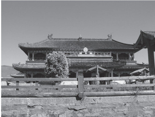
5. kép Az Amarbayasgalant kolostor felújított főszentélye (2006.)

idején is korlátozták a mandzsu kormányzatnak juttatott utánpótlás mértékét. A segítségnyújtás megtagadása tovább rontotta a mongol főláma és a mandzsu császár viszonyát. Ez különösen kellemetlen helyzetet teremtett, hiszen a mandzsu uralkodónak elvileg a legapróbb részletekig beleszólási joga volt a mongol egyház belső ügyeibe is. Olyannyira, hogy engedélye nélkül a bogd még a fővárost sem hagyhatta el.