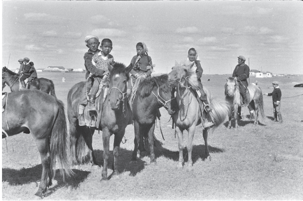
24. kép Iskolába érkező mongol gyerekek

Mongólia a szovjet mintákat követve végrehajtott gazdasági és társadalomszerkezeti átalakításokkal párhuzamosan, közigazgatási és településhálózati szempontból is átrendeződött. Az adminisztratív közigazgatási rendszer átszervezésével a megyék és járások hálózata egyfajta centralizált, piramisszerű struktúrát vett fel, amelynek csúcán a főváros állt, az alsóbb szinteken pedig a városias jellegű települések töltötték be a központi szerepet. A struktúra egyre kevésbé hasonlított a nomád életmód során kialakított rendszerhez, a lakosság térben is átrendeződött, a központi kormányzat által létrehozott új közigazgatási és térbeli struktúrákon belül a lakosság mozgását is korlátozni kellett. Ezek a szabályozások alapvető ellentmondásban voltak a hagyományos nomád gazdálkodás körülményeivel. Az új adminisztrációban, vagy a fokozatosan kialakuló ipari területeken dolgozók olyan életkörülmények közé kerültek, amelyek alapvetően más feltételeket és lehetőségeket biztosítottak, mint korábbi tapasztalataik.