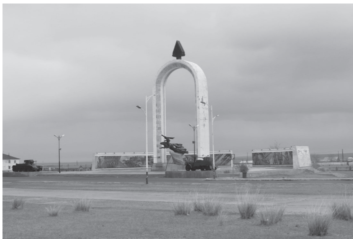
15. kép Katonai emlékmű Khalkhin Gol tiszteletére Choibalsan városban (2019.)

A mongol-mandzsukuó határvidéken végül kirobbant jelentősebb összecsapás – 1939. május–augusztus, Khalkhin Gol 451 – hasonló eredményt hozott. A japánok először május 28-án törtek be a mongol területre, de június végén vissza is vonultak a határra. Az újabb támadás során a Khalkha folyót átlépve próbáltak területet szerezni Bayantsagaan környékén, de a szovjet–mongol szövetséges csapatok masszív ellenállása megghiúsította a japán terveket. 452 Az egész nyáron tartó hadmozdulatokban a szovjet–mongol egyesített haderő felmorzsolta a japán támadó alakulatokat, a Kwantung hadsereg csúfos vereséget szenvedett. 453 Augusztusban a japánok fegyverszünetet kértek, amit végül V. M. Molotov és a Moszkvába küldött japán követ, későbbi külügyminiszter Togo Shigenori (1882–1950) a szeptember 13–15. között tartott tárgyalások alapján írt alá. A hadmozdulatok egy nappal később befejeződtek. 454 A mongol veszteség több mint 700 halott és sebesült volt. A szovjetek részéről 8900 halottat és 15 900 sebesültet, míg japán oldalról 18 100 halottat és 35 500 sebesültet követeltek a harcok. 455