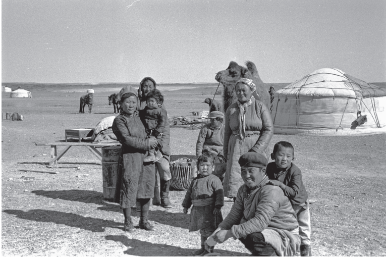
20. kép Vidéki nomádok (1969. Forrás: Fortepan, Bagi Gábor.)