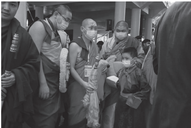
35. kép A 10. bogd geegen

A dalai láma novemberben Mongóliába érkezett, hogy bejelentse, megtalálták a mongol buddhizmus főlámájának 10. megtestesülését. A közvéleménnyel annyi információt osztottak meg, hogy egy hároméves mongol gyermekről van szó, de a nevét nem hozták nyilvánosságra. Ezzel megvalósulni látszott az, amire 1757 óta nem volt példa: a bogd geegen „visszatér” Mongóliába, és egy mongol gyermekben születik újjá. Amennyiben a gyermeket beavatják, úgy több mint két és fél évszázad után újra mongol születésű személy fogja irányítani a kolostori rendszert. A lehetőség azonban csak egy pillanatra került elérhető közelségbe. A gyermeket hivatalosan is be kell iktatni tisztségébe, amihez a buddhista hagyomány szerint egy magasabb rangú, idősebb lámára van szükség. A dalai láma mongóliai látogatására adott nagyon heves politikai reakciók azonban megakadályozták ezt.