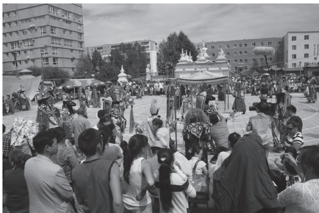
32. kép Tsam tánc a Züün Khüree Dashchoilin kolostorban (2012.)

A jellemzően Ulánbátorban működő sámánok kisebb-nagyobb közösségekbe szerveződnek, sámánközpontok, egyesületek jelennek meg. Ezek közül a kisebbek gyakorlatilag vállalkozásként működnek, különböző áron kínálnak szolgáltatásokat a hozzájuk látogatóknak. A nagyobb szervezetek – mint az egyik legnagyobb mongóliai sámánközpont, a Golomt – fő célja, hogy összefogja a hasonló hagyományok alapján működő sámánokat, egységesíti a rituálékat, a használt eszközöket, a viselt ruhákat, az énekelt dalokat, tehát működésével, a rendszer szabályozásával visszahat magára a hagyományra is. A korábbi évszázadokban egymástól függetlenül működő hagyományok egységesítése és szabályozása új színfolt a modern kori sámánizmusban. 728