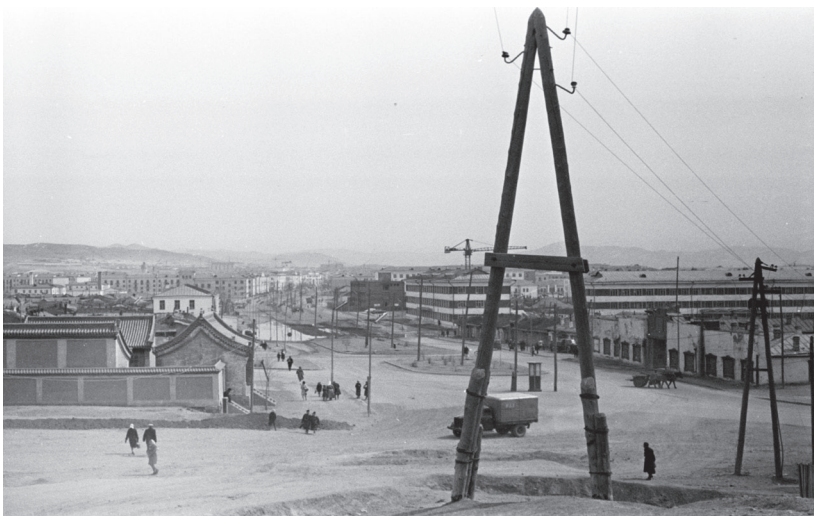
26–27. kép Ulánbátor látképe a Gandan dombról fényképezve Háttérben az Ikh Delgüür épülete. (1967.)