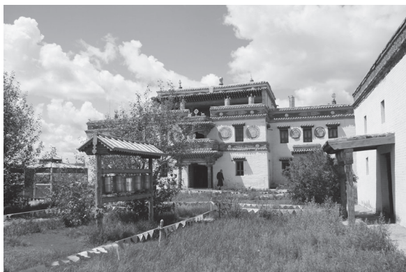
1–2. kép Sztúpák az Erdene zuu kolostor kerítésén és a kolostor főszentélye (2012.)

Az 1900-ban Kínában kirobbant bokszerláadás – amely a császári udvar hallgatólagos beleegyezésével a külföldiek ellen irányult – megrázta az egész országot, 171 és újabb lökést adott a változásoknak. A harcokkal egy időben a mandzsu adminisztráció több, Mongóliát súlyosan érintő kérdésben hozott döntést, és 1901 elején kihirdették a Mongóliára vonatkozó „Új kormányzati elképzelések”-et. 172 A dinasztia, figyelmen kívül hagyva meggyengült helyzetét, épp ezt a számára meglehetősen kedvezőtlen pillanatot választotta Mongólia feletti hatalmának megerősítésére. Az addigi mongol kedvezményeket jelentős mértékben megnyirbálva, új központosító törekvéseket fogalmaztak meg. Ennek a politikának az egyenes következménye volt azonban az is, hogy a mongolok a 20. század folyamán a lehetőségeikhez mérten sokkal szívesebben keresték a kapcsolatot északi szomszédjukkal.