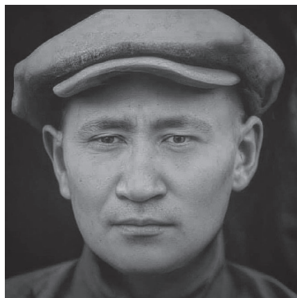
13. kép D. Bodoo (1920-as évek eleje.

Bodoo mint az új miniszterelnök a 11. év 8. hónapjának 10-én (a teokratikus állam időszakában használt kronológia szerint) kiadta az új kormány megalakításáról szóló közleményt. Az 1915-ös kjahtai egyezmény nyújtotta autonómia felszámolására, illetve Ungern bevonulására hivatkozva indokolta meg a népi reguláris hadsereg lépéseit. Kijelentette, hogy nem akarnak háborút a Középső Birodalommal, de Kína fennhatóságát semmiképp sem fogadják el. Ez nemzetközi jogi szempontból az 1915-ös szerződés egyoldalú felmondását jelentette, Kína azonban nem volt olyan helyzetben, hogy ezt megakadályozza. A kjahtai szerződésnek ekkor már csak elvi jelentősége volt. Mind a korábbi mongol államfő, mind a forradalmárok, illetve Ungern is gyakran hivatkozott rá különböző hivatalos dokumentumokban, ezt azonban abban a pillanatban már pusztá formalitásnak tekinthetjük.