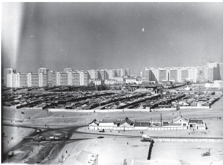
25. kép Ulánbátor 3. és 4. kerületében épülő új lakótelep. Előtérben a Gandan kolostor (1980-as évek.)