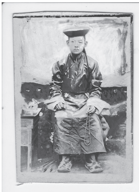
9. kép A 8. bogd gegeen (Fénykép: Nikolaj Charushin, 1890-es évek, Urga. Forrás: Néprajzi Múzeum.)

tatták. A bogd kánná avatása okán kiadott parancsában elfogadta a kinevezést, és felszentelése alkalmából kitüntetések, valamint kiválasztott idős alattvalóinak ajándékokat adott át.