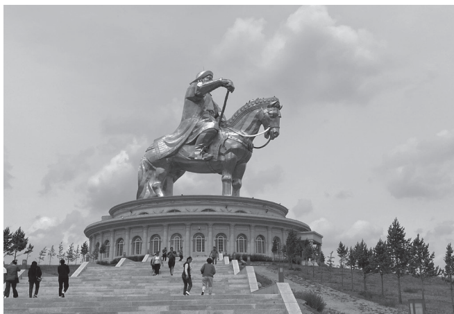
37. kép Dzsingisz kán lovasszobra napjainkban az egyik legkedveltebb turisztalátványosság (2023. A szerző felvétele.)

A mai mongol nemzeti identitás kialakítása során meghatározó szerepet játszik a lakosság etnikai összetétele, ami a nyelvi állapotnak megfelelően viszonylag egységes képet mutat, kialakulását alapvetően a dzsingiszi korszaktól szokták eredeztetni. A korai mongol társadalom összetételére vonatkozó legkorábbi forrás a 13. században született A mongolok titkos története , 740 amelyet ma is a Dzsingisztől származó mongol történeti, kulturális hagyomány alapvető forrásának tekintenek. A mai modern Mongóliában élő mongol etnikai csoportok nyelvét, kultúráját már számos cikkben elemezték, 741 és ezen feldolgozások alapján kijelenthető, hogy a nyelvi csoportosítással párhuzamosan a mai mongolságot etnikai értelemben is a három nagy – nyugati, vagy ojrát, középső (halha) és keleti – csoport egyikébe sorolják. Ezek a csoportok nagy vonalakban megfeleltethetők azon politikai központoknak, amelyek a dzsingiszi birodalom felbomlása után a mongolok által lakott belső-ázsiai területen kialakultak.