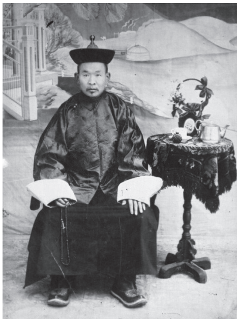
8. kép Da lam Tserenchimed (1910-es évek. Forrás: Sogoo ba tüünii nökhöd, Facebook) 243

A bogd geegen tisztsége – sokkal inkább, mint az akkor regnáló személye – a hozzá kapcsolódó történelmi hagyomány alapján a mongolok hagyományos függetlenségét jelképezte, és a tisztség spirituális jellege a világi politika fölé emelte. Ez, és az ennek következtében kialakult társadalmi konszenzus tette lehetővé, hogy a 20. században a 8. bogd a független mongol állam jelképévé válhasson. 1911 nyarán az orosz cári udvarhoz delegált küldöttség már az ő nevében tárgyalt az esetleges orosz–mongol együttműködésről. A cári udvar végső célja Mongólia gyarmatosítása volt, de mivel ehhez nem látták elérkezettnek az időt, elutasították a mongolok kérését. 244