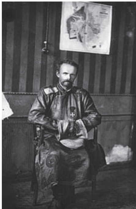
10. kép Fjodorovics von Ungern-Sternberg báró (1910-es évek vége. Forrás: Sogoo ba tüünii nökhöd, Facebook) 305

kolostor mellett állomásozó kínai csapatokat. A támadás idején a mongol főllámát a kínaiak túszul ejtették, és bár később szabadon engedték, korlátozták a mozgását. 307 Ungern október 24-i és a két nappal későbbi támadása is kudarcot vallott, így kénytelen volt visszavonulni, és az év végén már nem is próbálta megfutamítani a mongol fővárost ellenőrzésük alatt tartó kínai erőket. Az ideiglenesen vereséget szenvedett Ungern a visszavonulás után a sereg létszámának növelésére, erőszakos toborzást hajtott végre a mongol területeken. Emellett pozíciójuk erősítése érdekében megpróbáltak szövetségeseket keresni a lemondott mongol kormány tagjai között.