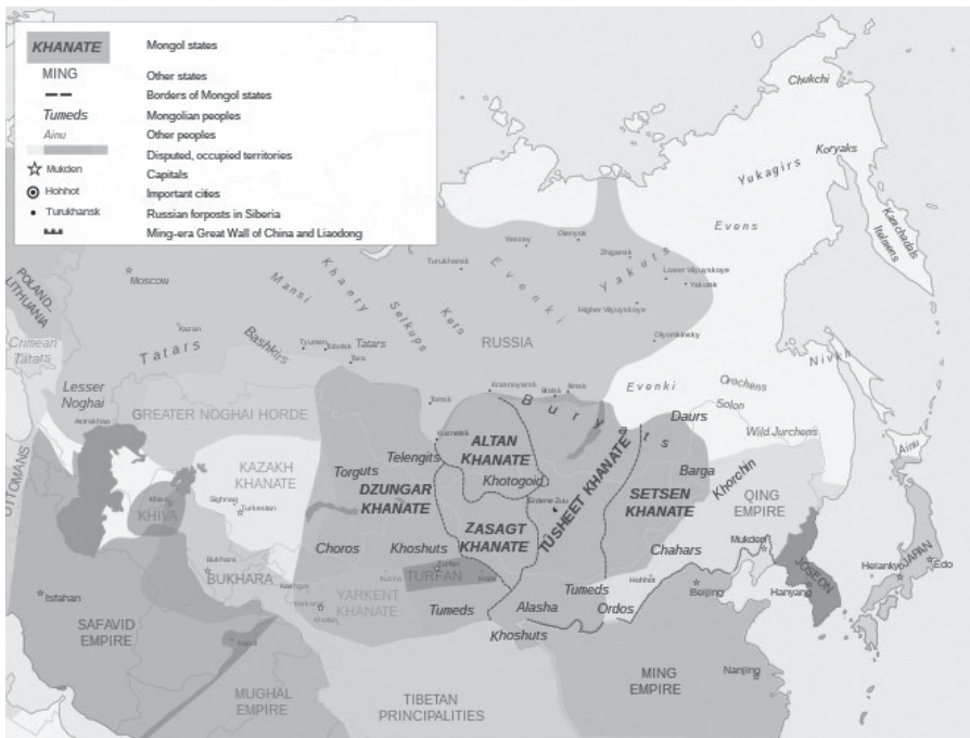
1. térkép Mongol területek a mandzsu hódítás előtt

lépést jelentett az ezen a területen tibeti közvetítéssel megjelent lámaista vallás társadalmi pozíciójának megerősödése felé. 17