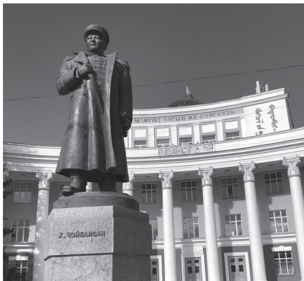
21. kép Choibalsan szobra a mongol állami egyetem előtt (2023.)

– állatorvosi ellátást, takarmányt, eszközöket – és társadalmi szolgáltatásokat – egészségügy, nyugdíj, oktatás – is. A kollektivizálás csúcán a negdelek száma megközelítette a háromszázat. 522