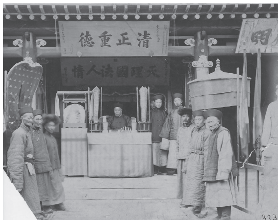
3. kép Maimacheni mandzsui törvényszék (Fénykép: Nikolaj Charushin, 1880-as évek. Forrás: Néprajzi Múzeum.)

Az 1900-as évek elején felerősödő mandzsuelles megmozdulások legfőbb kárvallottjai a kínai kereskedők voltak, mivel a Kínával szembeni elégedetlenség legegyszerűbb kifejezési eszköze az volt, ha kínai kereskedőtelepeket romboltak le. 186 Helyüket csak fokozatosan és igen lassan vették át mások, többnyire oroszok vagy mongolok.