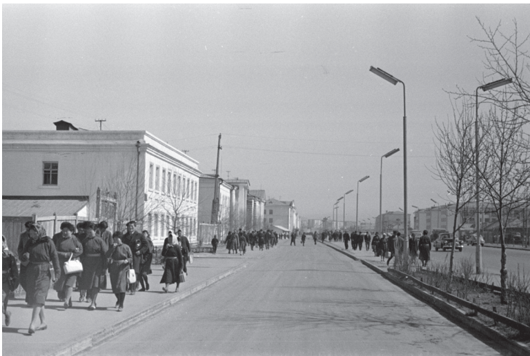
18. kép Ulánbátor, Inkh taivanii gudamj „Béke sugárút” (1967. Forrás: Fortepan, Inkei Péter.)

Ahhoz azonban, hogy ezt az alkotmányban rögzített tény a társadalom jelle- gében is tükrözze, létre kellett hozni azt a városi népességet, a „dolgozó proleta- riátust”, amely a szocialista társadalom alapját jelentette. Az 1930-as évektől az új társadalmi osztály kialakításának bázisát a szekularizálódott lámák, a nomád állattenyésztést különböző okból elhagyó pásztorok, az egykori aratok, és a korábbi nomád társadalomban is jelenlévő kézművesek szűk csoportja jelentette. A szov- jet–mongol gazdasági és oktatási együttműködéseknek köszönhetően többen a Szovjetunióban kaptak képzést, nemcsak az újonnan alapított üzemekben végzett feladataik tekintetében, de ideológiai téren is. Ilyen ipari üzemek legkorábban a fővárosban jöttek létre, és alapvetően az állattenyésztéshez kapcsolódva élelmiszert és könnyűipari termékeket állítottak elő. 516