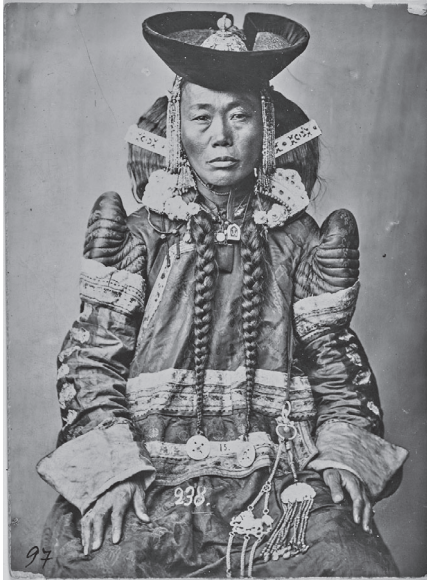
4. kép Mandzsuk kori mongol előkelő nő (Fénykép: Nikolaj Charushin, 1888, Urga. Forrás: Néprajzi Múzeum.)

szervezték új közigazgatási egységbe. A 20. század tízes éveinek végén Mongóliában éveket eltöltő Maijskij szerint Külső-Mongólia 4 aimagjában 91 előkelői családnak mintegy 410 tagja élt, akik a férfi népesség kb. 0,1%-t tették ki, míg az alávetett lakosság különböző csoportjai összesen nagyjából a lakosság 48%-át, a lámák pedig a népesség 44,5%-át képviselték. 190 Az ország teljes lakosságát ekkor nagyjából 600 000 főre becsülték. 191