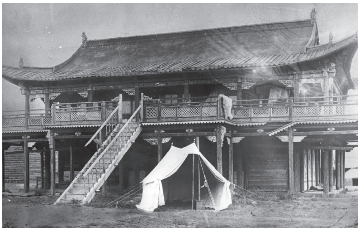
23. kép A Sudar bichgiin khüreeen épülete (É. n.)

tődtek. Az intézkedések eredményeként alakult ki Mongóliában az az új társadalmi elit, amelynek tagjai jellemzően az új mongol oktatási rendszerben – és gyakran a Szovjetunióban – végezték tanulmányaikat, ott kaptak szocialista ideológiai képzést. Sokan onnan is választottak párt maguknak, így a mongol politikai, társadalmi elit személyes szálakon is kapcsolódott a mintaadó szovjet mindennapokhoz. A legklasszikusabb példa erre maga Yu. Tsendenbal, aki felesége révén a szovjet pártvezetés legmagasabb köreivel állt kapcsolatban.