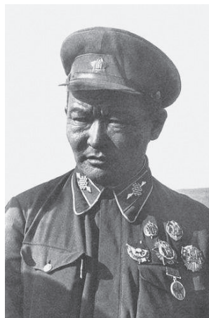
14. kép Kh. Choibalsan marsall (É. n., de vélhetően a Khalkhin Gol-i csata időszakában.) 417

Choibalsan egész életét végigkísérték olyan, gyakran ellentmondásos események, melyek későbbi, akár mai megítélését is bőségesen ellátják pro és kontra érvekkel arra vonatkozóan, hogy vajon a mongol nemzet hőse volt-e, vagy egyszerű politikus, aki könyörtelen eszközökkel lépett fel ellenfeleivel szemben akkor is, ha korábban szoros szövetségesei voltak. Ilyen volt a nagy Mongólia létrehozásával és a pánmongolizmussal kapcsolatos kaland is, de hasonló színben tűnhet fel Choibalsan buddhizmussal kapcsolatos ambivalens viszonya is.