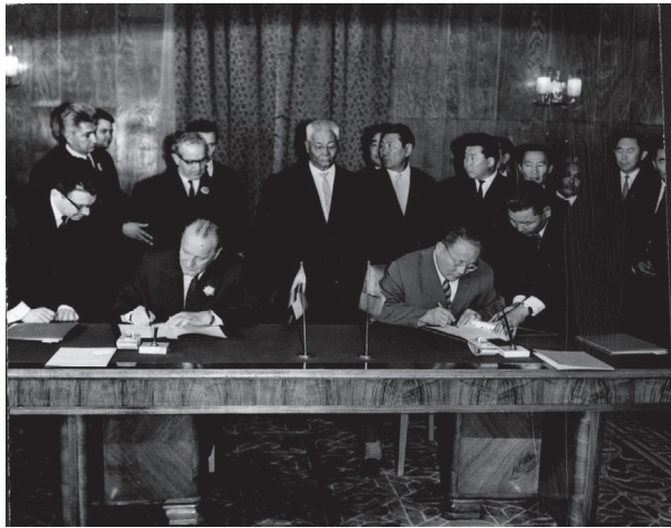
29. kép Kádár János és J. Sambuu miniszterelnök (1966, Ulánbátor.

A geofizikai felmérések és a bányaiipari együttműködés eredménye lett az a megállapodás, amit 1984-ben írtak alá a Tsagaan Davaa lelőhelyen talált volfrámvagyon kiaknázására. 544 A közös vállalat sajnos nem váltotta be a hozzá fűzött reményeket. A bánya létrejött, magyar–mongol közös tulajdonba is került, de a kitermelést nem sikerült hosszú távon fenntartani. Az 1990-es rendszerváltás után a magyar fél érdekeltségei felszámolása mellett döntött, amit a mongol partner igyekezett elkerülni. A magyar döntés a volfrám világpiaci árának csökkenése idején jónak tűnhetett, de látva a piacgazdaság óta indult mongóliai bányászati befektetéseket, illetve azok jövedelmezőségének mértékét, ez ma már kissé más színben tűnik fel.