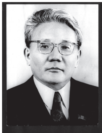
17. kép Yu. Tsedenbal (É. n.)

kapcsolatai révén közel állt Leonyid Iljics Brezsnyevhez (1906–1982), aki 1964-től haláláig az SZKP főtítkáráként irányította az országot. Bizonyos értelemben ezt a kapcsolatot tekinthetjük egyfajta jelképeként is a Mongol Népköztársaság és a Szovjetunió között létrejött szövetségnek. A Tsedenbal-korszakban Mongólia hűséges szatellitállama volt északi szomszédjának. Az ott megfogalmazott gazdasági, politikai döntéseket soha nem kérdőjelezték meg, a nemzetközi politikai színtéren is együtt, a szovjetek által kijelölt vektorok mentén mozogtak, legyen szó a mongol–kínai kapcsolatokról vagy a szélesebb nemzetközi együttműködésekről. A jelentősebb problémáktól mentes kapcsolat köszönhető volt annak is, hogy a szocialista rendszer Mongóliában nem került szembe olyan kihívásokkal, mint a keleti blokk más országaiban (1956-ban Magyarországon, 1968-ban Csehszlovákiában) –, vagy akár a kelet-ázsiai térségben (például a koreai háború), és így Ulánbátor mindig készségesen visszhangozta Moszkva álláspontját a vitás kérdésekben.