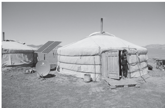
31. kép Egy nomád nyári szállás napjainkban. Már vidéken is általánossá vált a napelem, tv, mobiltelefon használata (2018.)

A beköltözés üteme napjainkban sem csökken, miközben már évek óta nincs megfelelő munkalehetőség az első generációs városiak nagy tömegei számára. A növekvő munkanélküliség jelentős társadalmi feszültséget is generál – jól bizonyítják ezt a 2008 nyarán bekövetkezett zavargások –, 703 ugyanakkor az elnéptelenedő vidék a hagyományos nagyállattartó nomád gazdálkodás végét is jelentheti. Nem véletlen, hogy napjainkban egyre több szó esik arról, hogyan lehetne a hagyományos nomád életmódot a 21. század gazdasági környezetébe integrálni.