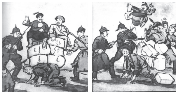
11–12. kép A forradalmárok elkergetik a nép vérért szívó előkelőket (Karikatúra, 1920-as évek.)

A bogd geegen és egykori kormányának képviselői szívesebben állították volna vissza azt a viszonylagos békét és status quót, melyet az 1915-ös kjahtai szerződés biztosított az országban. Ehhez azonban meg kellett volna nyerniük a kínai kormány jóindulatát és el kellett volna érniük, hogy egy jelentősebb, de Xu Shuzhengnél jóval kevésbé agresszív katonai erő biztosítsa az országot, mert a mongol állam hadserege erre nem volt képes. A kezdeményezés lehetőségét azonban már akkor elvesztették, amikor a szovjet–mongol szövetséges csapatok megindultak a mongol főváros felé. 1921-ben új időszámítás kezdődött az országban.