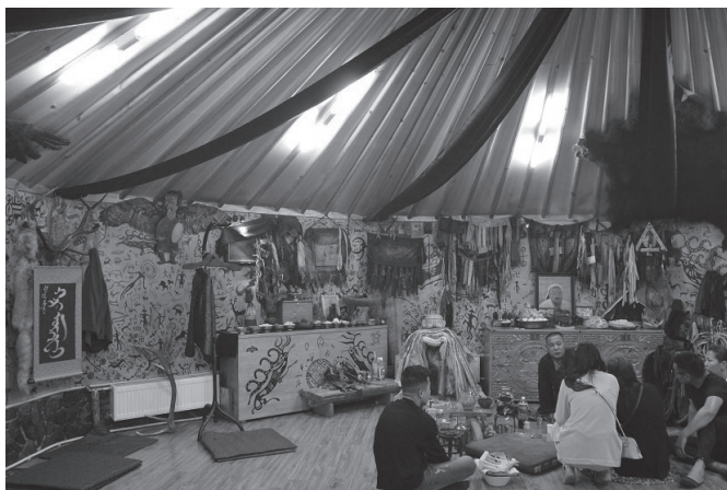
33. kép Egy mai ulánbátóri sámánközpont a szertartás után (2022.)

A jellemzően Ulánbátorban működő sámánok kisebb-nagyobb közösségekbe szerveződnek, sámánközpontok, egyesületek jelennek meg. Ezek közül a kisebbek gyakorlatilag vállalkozásként működnek, különböző áron kínálnak szolgáltatásokat a hozzájuk látogatóknak. A nagyobb szervezetek – mint az egyik legnagyobb mongóliai sámánközpont, a Golomt – fő célja, hogy összefogja a hasonló hagyományok alapján működő sámánokat, egységesíti a rituálékat, a használt eszközöket, a viselt ruhákat, az énekelt dalokat, tehát működésével, a rendszer szabályozásával visszahat magára a hagyományra is. A korábbi évszázadokban egymástól függetlenül működő hagyományok egységesítése és szabályozása új színfolt a modern kori sámánizmusban. 728