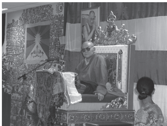
34. kép A 9. bogd geegen magyarországi látogatásán (2007.)

A mongol társadalomban spontán felszínre kerülő, a vallásos élet és a buddhizmus iránti elkötelezettség mellett a hivatalos politika is lehetővé tette a kolostori rendszer újjászervezését, adminisztratív kereteinek kiépítését. A látszat szerint a buddhista vallás újjáéledésének legfontosabb feltételei adottak voltak Mongóliában, és ez a folyamat robbanásszerű változást generálva meg is indult, azonban a gyakorlatban több tényező is hátráltatta. Ezek közül meghatározó volt, hogy a szocialista korszakban a buddhizmussal és követőivel szemben alkalmazott hátrányos megkülönböztetés, a brutális leszámolások következtében a rendszerváltás után egyre-másra újjáalakuló kolostorok irányítására nem volt megfelelő számú képzett szerzetes. A buddhista edukációs rendszer megszervezése vált tehát az egyik legfontosabb feladattá. Ez jórészt külföldi buddhista szervezetek támogatásával meg is történt, azonban hatása nem elhanyagolható a mai mongol buddhista gyakorlat szempontjából.