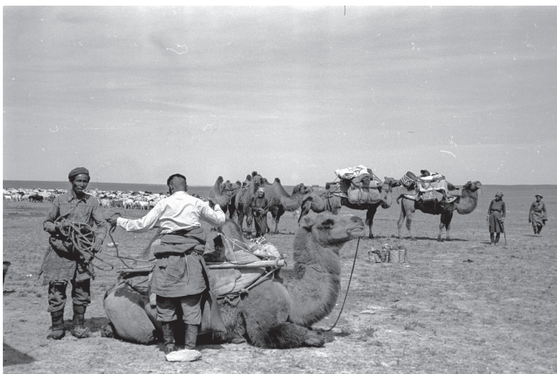
19. kép Tevével költöző nomádok (1969.)

vállalkozásának természetes célpontjaivá váltak. 517 Hagyományos körülményeiket, életmódjukat hátrahagyva költöztek a városokba, ahol különböző kollektívákban és gyárakban dolgoztak, utóbbiak hamarosan megjelentek az egész országban, sőt a század 1960-as éveitől megindult az új városok építése is, 518 amelyek a kiépülő mongol szocialista ipar központjai lettek. Mivel Mongóliában a forradalom előtt nem volt számottevő ipari szektor, a proletariátus mint osztály megszervezése nem volt egyszerű feladat. A munkások gyakorlatilag az ipari üzemekkel együtt „építették” saját társadalmi közegüket is. Az új társadalmi csoport kiemelt szerepet játszott az MNFP társadalmiasításában is, politikai szerepük növekedésének súlyát jól jelzi, hogy az 1940-es évekre elérte – egyes számítások szerint jóval meghaladta – az 5%-ot, 519 ami a hivatali dolgozók, pártfunkcionáriusok 41,2%-os arányával kiegészülve már a tagság nagyjából felét adta. 1969-ben a munkások, illetve családjaik összesen már hozzávetőleg a teljes mongol népesség egyharmadát, 36,3%-át tették ki. 520