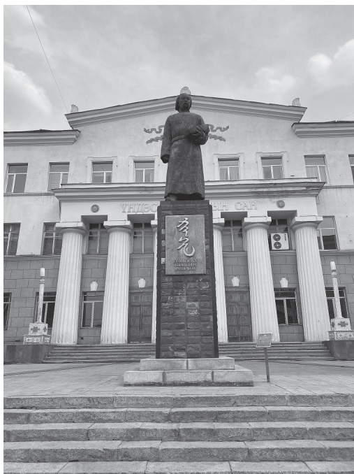
36. kép Az egykor politikai üldözött B. Rinchen szobra ma a Mongol Nemzeti Könyvtár épülete előtt áll (2023. A szerző felvétele.)

korai gyökerei az 1920-as évek elején kezdtek formálódni, amikor a „mongol” identitást fokozatosan kiterjesztették a korábbi előkelői rétegről a köznépre is. Addig ezt a státuszt – elsősorban születési előjogaik alapján –, csak a noyonok birtokolták, és ezt a helyzetet a propaganda összemoszta az elmaradottsággal, a túlhaladott korszak képével. 733 Az 1920-as évektől, de még inkább a második világháború után fokozatosan kezdett kialakulni egy új, kollektív identitás, amelyben a „mongolság”, mint identitás fogalom mellett megjelent a testvéri szocializmus és a proletár internacionalizmus is. Hasonlóan ahhoz, ahogyan ezt a szovjet Közép-Ázsia területein, a SzU egyes akkori tagköztársaságaiban is láttuk elsősorban az 1930-as évek közepétől. 734 A mongol értelmiség számára meghatározó – és