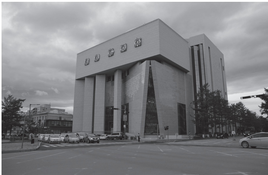
38. kép A 2022 őszén átadott Dzungisz kán Nemzeti Múzeum épülete (2023. A szerző felvétele.)

és egyetemi kutatóhelyek mellett működő fontos intézményeit, a mongolok már jóval távolabb tekintenek vissza kulturális örökségük gyökereinek keresése során.