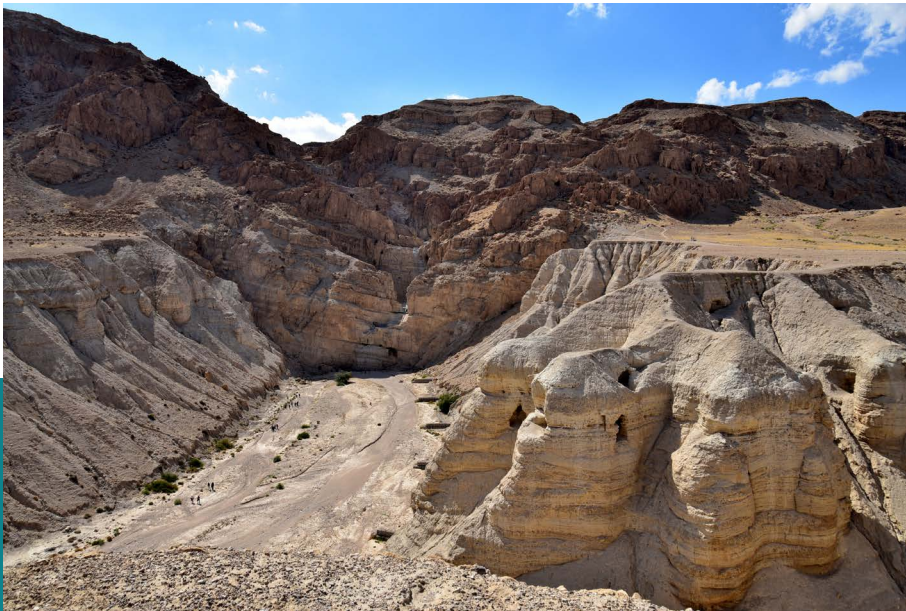
A qumráni barlangok

Az eddig tárgyalt források alapján megrajzolt kép élt a köztudatban az esszénusokról 1947, a qumráni tekercsek felfedezése előtt. 33 Amikor a kutatók a tekercseket sorra elolvasták, és egyre több, az antik leírásokból már ismert részlettel találkoztak, sokak számára egyértelmű volt, hogy bár a tekercsek egyike sem használja a csoportra az esszénus kifejezést, akik írták őket, ehhez a csoporthoz tartoztak. 34 Azonban nem csak hasonlóságokkal, hanem számos ellentmondással is találkozunk a tekercsek és az auctorok leírásai között. Ennek oka csak részben az a fent tárgyalt tény, hogy utóbbiak esetében csoporton kívül állók írtak kívülállóknak, fontos a szövegek elszórt keletkezési ideje és eredete is.