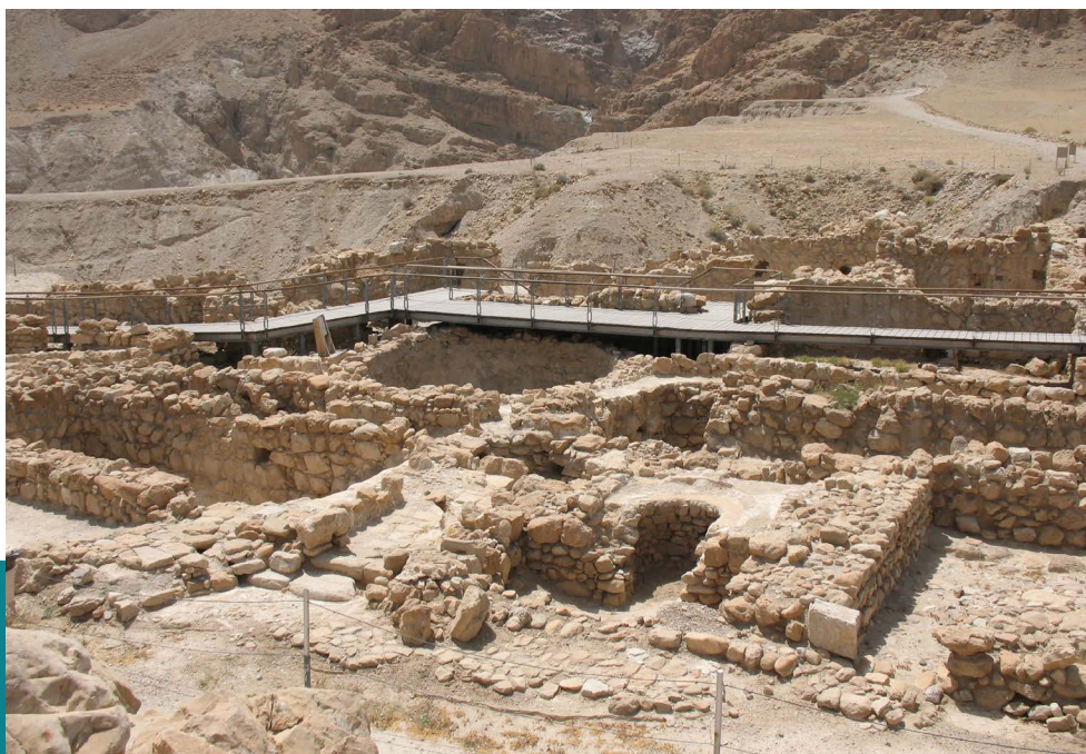
Ásatás a qumráni telepen

tárolásra szolgáló szekrények, faajtó és medencék nyomai láthatóak, 54 kerámiaedények, bronz- és vasszerszámok szintén felszínre kerültek. Az épület észak-keleti oldalán egy fal indul dél felé, melynek oldalában számos kisebb helyiség található, feltehetően tárolók, és kisebb műhelyek, köztük egy nagyon gazdagon felszerelt és berendezett fazekasműhely (a telepen két égetőkemencét is feltártak). A telep legnagyobb terme 22 m hosszú és 4,5 m széles volt, a fő épülettől délre található. De Vaux szerint ez szolgált az itt élők gyülekezőhelyéül. Mivel egy hozzáépített helyiségben (ezt kamrának nevezték el) közel ezer agyagedényt 55 (poharak, tányérok, tálak) is találtak, többen arra következtettek, hogy azt közös étkezések helyéül is használták. 56