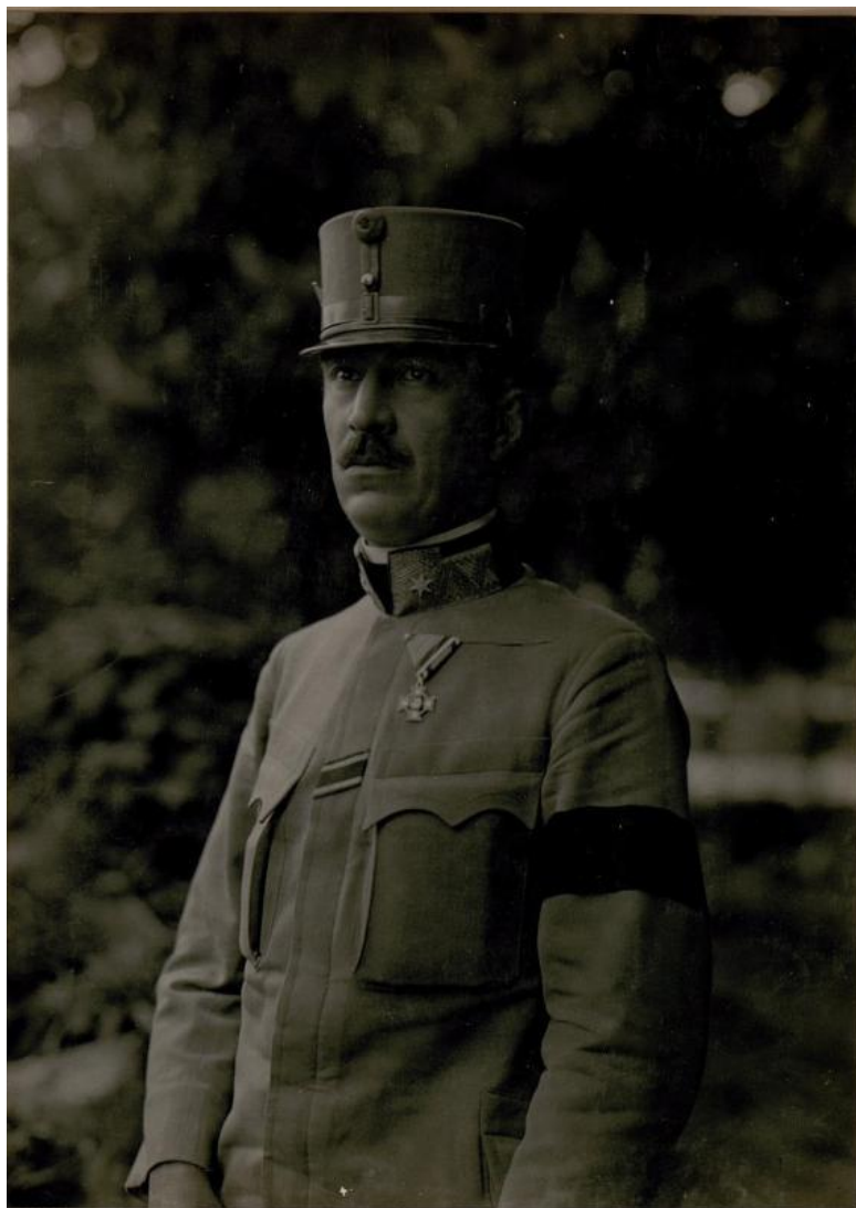
Siménfalvy Tihamér vezérkari őrnagyként