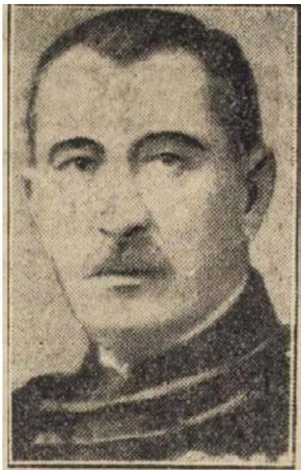
Siménfalvy Tihamér tábornok fotója a haláláról szóló sajtóhírben Pesti Napló, 1929. március 23.