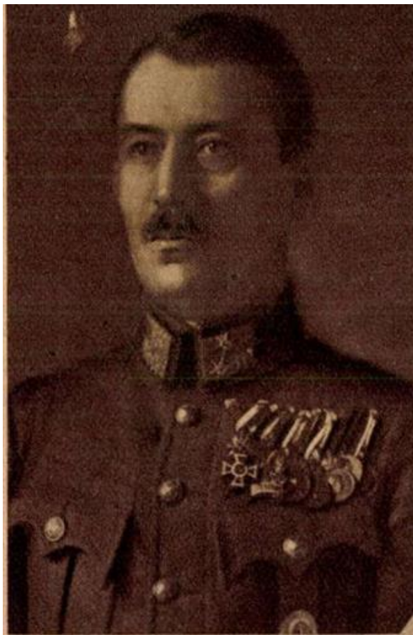
Siménfalvy Tihamér tábornok fotója a haláláról szóló sajtóhírben Képes Pesti Hírlap, 1929. március 23.