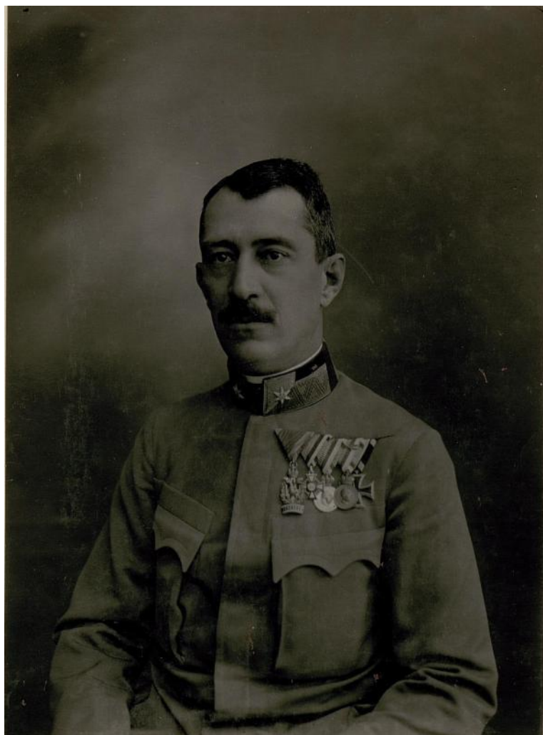
Siménfalvy Tihamér vezérkari őrnagyként