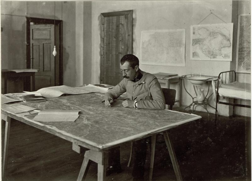
Siménfalvy Tihamér vezérkari tisztként az első világháborúban, hadműveleti térképasztal felett