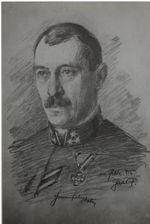
Siménfalvy Tihamér portréja századosként