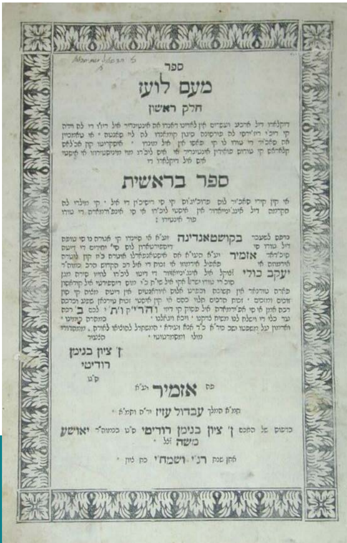
Yaakov Culi (?-1732): Me'am Lo'ez, címlap Wikimedia Commons

A hagyományos ladino irodalom egyik legkiemelkedőbb műfaja a copla , egy paraliturgikus, verses ének volt. Ez a műfaj a 18. századtól a 20. századig virágzott és bebizonyította, hogy a ladino nemcsak fordítások és prózai művek írására, hanem költészetre is alkalmas. Több mint 400 copla maradt ránk. Metrikájuk változó, mégis tipikus volt. Strófákból álltak, melyek sorrendjét az ének tartalma vagy akár egy akrosztichon határozta meg (a versszakok, esetleg a sorok kezdőbetűi