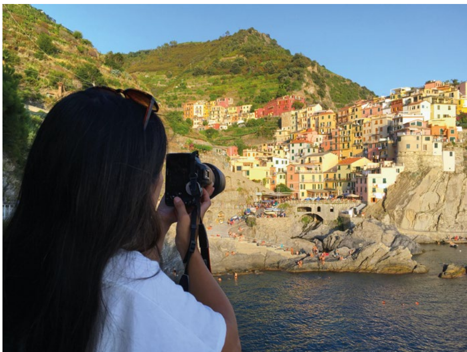
5. ábra Manarola látképe a Nessun Dorma bár közeléből

volt a nagy vendégforgalmú olasz desztinációk versenytársa, de ezt követően éveken belül felzárkózott azokhoz. A közösségi média térhódításával felértékelődtek a látványos fotópontok (5. ábra), ahonnan el lehet készíteni a tökéletesnek gondolt képet, amely azután kimagasló népszerűséget érhet el. Mivel ez esetben csak a jól megkomponált képek közzétételéből és az azokra adott közösségi reakciókból fakad az élmény, a turisták számára nem zavaró a táj többi elemének vélt vagy valós tökéletlensége. Emellett sorra jelentek meg a kifejezetten az öt településsel foglalkozó útikönyvek (Girani 2007) és kapott egyre több helyet a térség a régiós kiadványokban (Accattoli 2010).