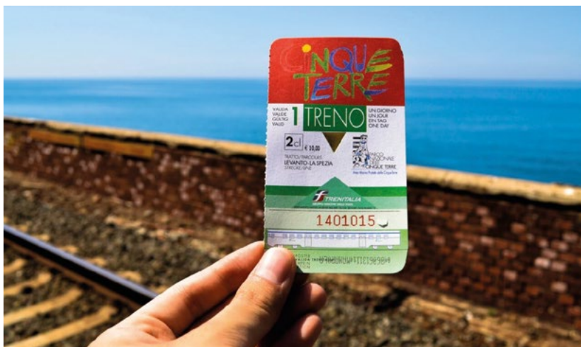
10. ábra A Cinque Terre kártya egyszerű megjelenése

Tekintettel arra, hogy egy vasúti jegy a falvak között 5 euróba kerül, az egynapos kártya (10. ábra) már négy utazás esetén is megtérül. A turistákat ezen felül további szolgáltatások igénybe vételére is ösztönzi, így azok minden helyen minimális időt töltenek el, mert úgy érzik, akkor használják ki legjobban a kártya nyújtotta lehetőségeket, ha minél több szolgáltatást vesznek igénybe annak segítségével.