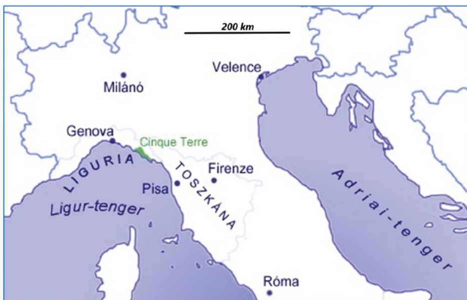
1. ábra Cinque Terre elhelyezkedése

A Cinque Terre területét öt falu alkotja, melyek Pisától és Genovától közel azonos távolságra találhatóak (1. ábra). A vizsgált desztináció Olaszország északnyugati részén, Liguria tartomány keleti részén (Liguria Levante) fekszik. A félsziget gerincét képező Appennin-hegység itt még a tengerpartig húzódik, így a terület látványos formavilággal rendelkezik, ami egyúttal a tájhasznosítás szempontjából geomorfológiai kockázatokkal is jár (Terranova et al. 2006, Mariotti 2008, Raso et al. 2021). Emellett rendkívüli biológiai diverzitás jellemzi mind a hegyvidéki, mind pedig a tengeri területeket (Marchese – Gardi – Montanarella 2010). Liguria Olaszország fejlettebb régiói közé tartozik, de a sokáig tartó elzártságból fakadó periférikus helyzet miatt a Cinque Terre falvai a nemzetközi turizmus által történt felfedezésig kifejezetten elmaradottak voltak.