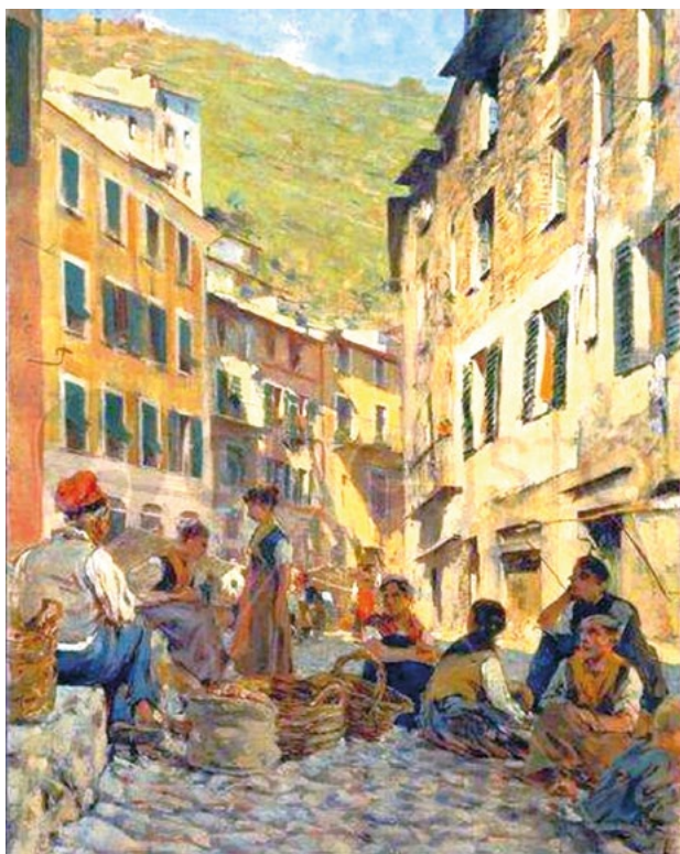
2. ábra Telemaco Signorini: Pihenés Riomaggioreban (1892-94, magángyűjtemény)

bár a területre érkezőknek így is kis része keresi fel a falvak belterületeitől távolabbi helyeket. Az első látogatás után Signorini többször is visszatért ide. 1881 és 1899 között Riomaggiore lett nyári tartózkodásainak központi helye, ezáltal a naplóiban megörökített elmélkedéseinek és tájbrázolásainak témája is (2. ábra).