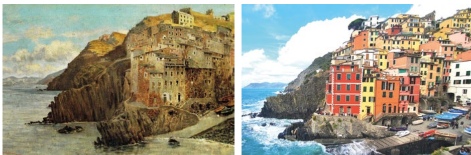
3. ábra Riomaggiore látképe

A. Telemaco Signorini: Riomaggiore látképe, 1870-1880 körül, magángyűjtemény