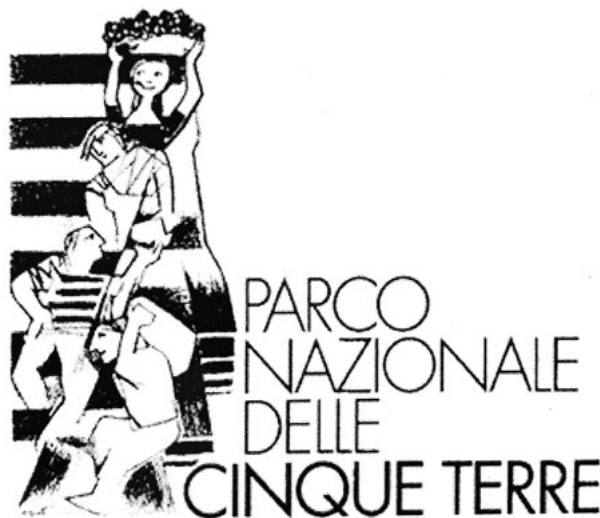
4. ábra A Cinque Terre Nemzeti Park logója

A valódi értékeket a turista is tudja észlelni, de ehhez arra van szükség, hogy lelassítson, több időt szánjon a falvakra és igyekezzen nyitottá válni a valódi értékek iránt. Ahogy Claudio Magris 2005-ben, tehát a modern turizmus itteni megjelenése idején fogalmazott: a különböző korszakok összefonódnak a tájban, ahogy egy ember arcki-