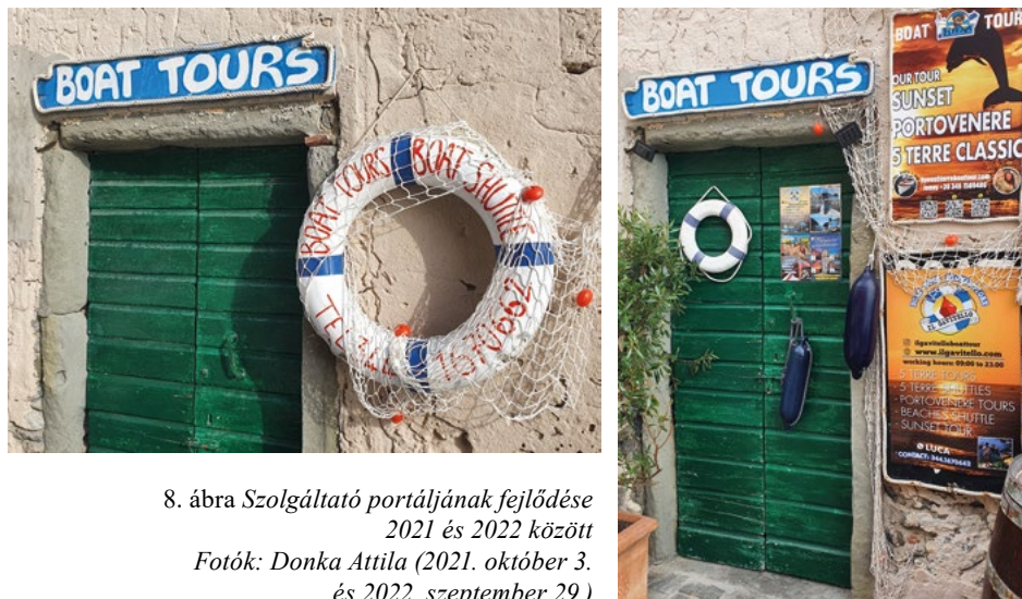
8. ábra Szolgáltató portáljának fejlődése 2021 és 2022 között