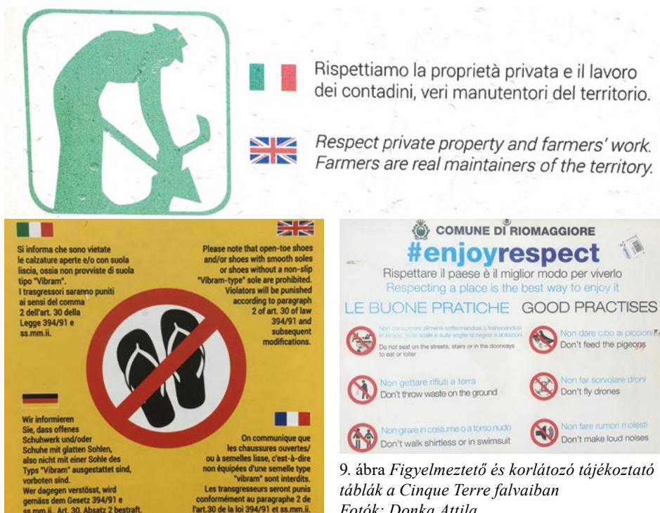
9. ábra Figyelmeztető és korlátozó tájékoztató táblák a Cinque Terre falvaiban

A falvak feletti, összetett rendszert alkotó, látványos szakaszokból túraösvényeken a turisztikai főszezonban nem ritkák a tömeges jelenetek. Az útvonalak túlterheltek, a túrázók egymást is zavarják, nem csak a természeti környezetet. Gyakoriak a balesetek 4 , illetve a mezőgazdasági területek károsítása. A korlátozások egy másik fajtája tehát nem a területre belépők számát igyekszik szabályozni, hanem a már itt lévők mozgását. Ellenőrzik a megfelelő felszerelést, illetve táblákkal igyekeznek felhívni a turisták figyelmét arra, hogy nem muzeális, hanem élő tájon járnak (9. ábra). Különösen érdekes, hogy a 2024. évi szezon kezdete előtt felmerült az e-bike-ok, a kajakok és más környezetbarát eszközök számának korlátozása is, ami előtt egyelőre a helybeliek is értetlenül állnak.