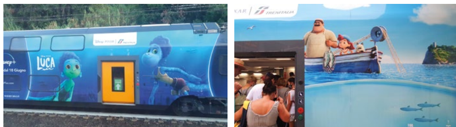
6. ábra A Luca című animációs film jelenetei a Cinque Terrén áthaladó vonatokon

fejlesztették be, de így is lehetett tartani attól, hogy tovább fokozza a nyomást a területre, különösen azért, mert a film jelenetei megjelentek a terület marketingkommunikációjában is (6. ábra).