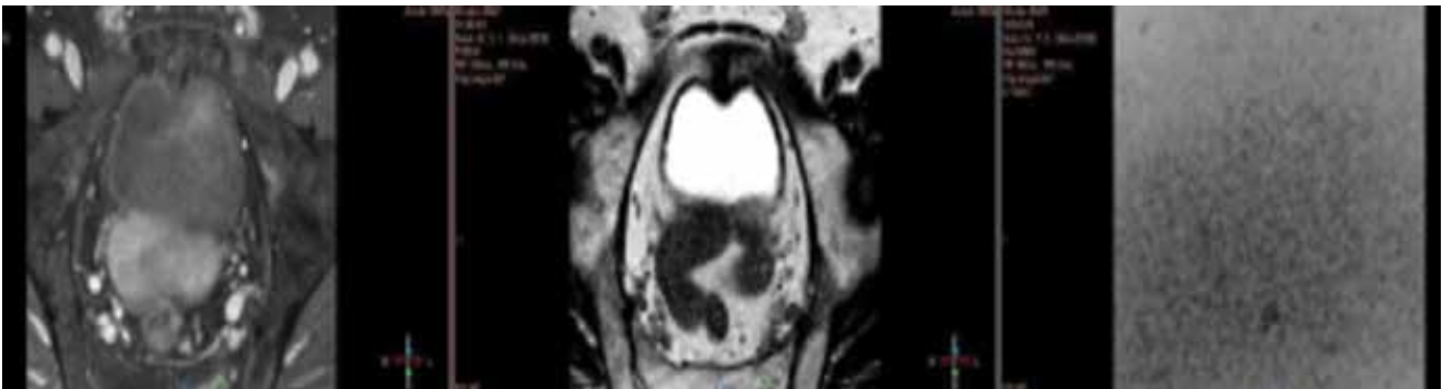
2. ÁBRA: RITUXIMAB-BENDAMUSTIN KEZELÉS UTÁNI ISMÉLT KISMEDENCEI MR, AMELY JELENTŐS REGRESSZIÓT MUTAT

lebenyéből vett mintákat B-sejtes lymphomának vélemezte, amely infiltrálja a környezetet, míg a prosztata bal oldalából vett szövettani eredmény ugyan az az ismert Gleason 3+3 malignitás, amely az első prosztatabiopszia után mutatkozott. Hematológiai indikációval PET-CT-vizsgálat készült, ez alapján a lymphoma IV. stádiumának bizonyult. Elindult a páciens kemoterápiás kezelése. Már az első ciklus rituximab-bendamustin terápia után a páciens állapota jelentősen javult, éjszakai izzadása megszűnt, csontfájdalmi szanálódta, étvágya visszatért. Kismedencei MR-vizsgálat összehasonlítva a kemoterápiás kezelést megelőző MR-vizsgálat képanyagával leírja, hogy a prosztata belül klinikailag szignifikáns tumor jelenléte nem valószínű (PIRADS 2). Összességében a hematológiai alapbetegség tekintetében kifejezett regresszió volt látható (2. ábra). Urológiai szempontból betegünk panaszmentes.