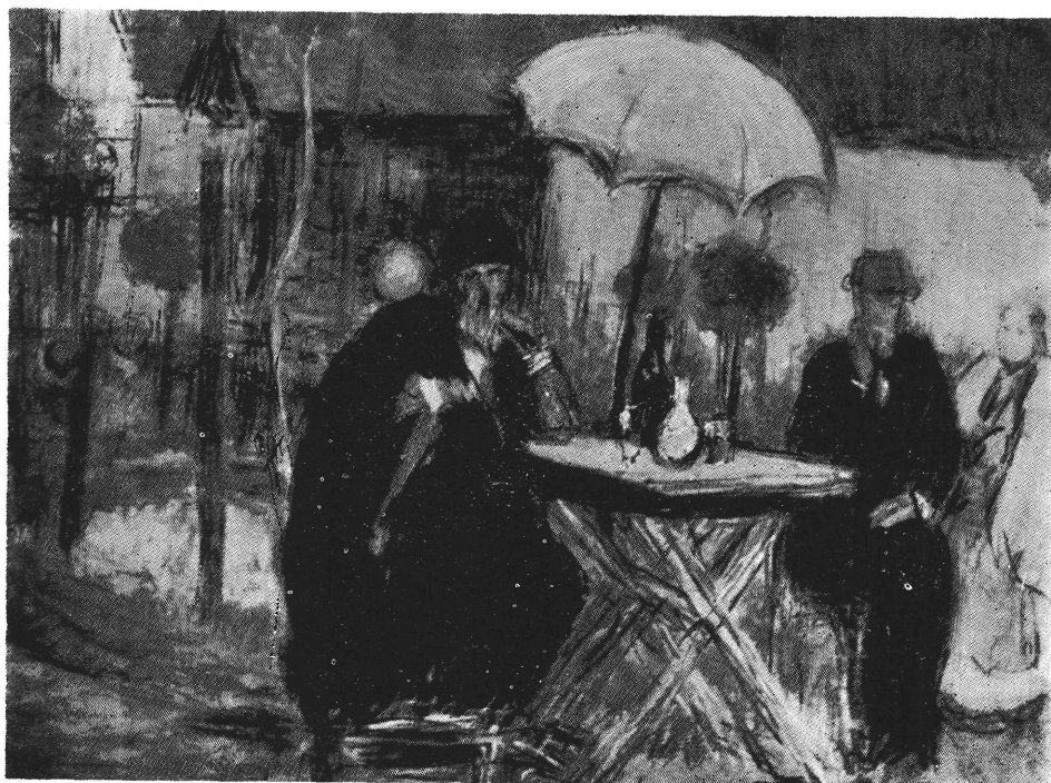
LXXII. Papa, Mama, Ripli bácsi