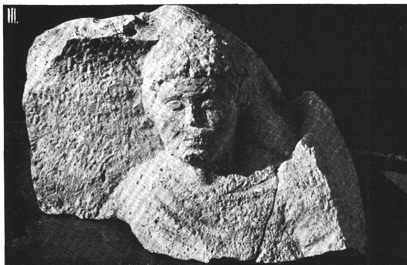
LXXV. Kaposzsjakab, I = pillérfő; II = oszloplábazat a XI. századból; III = római sírkő. – I = Pfeilerkopf; II = Basis aus dem 11. Jh. III = Römisches Grabstein.