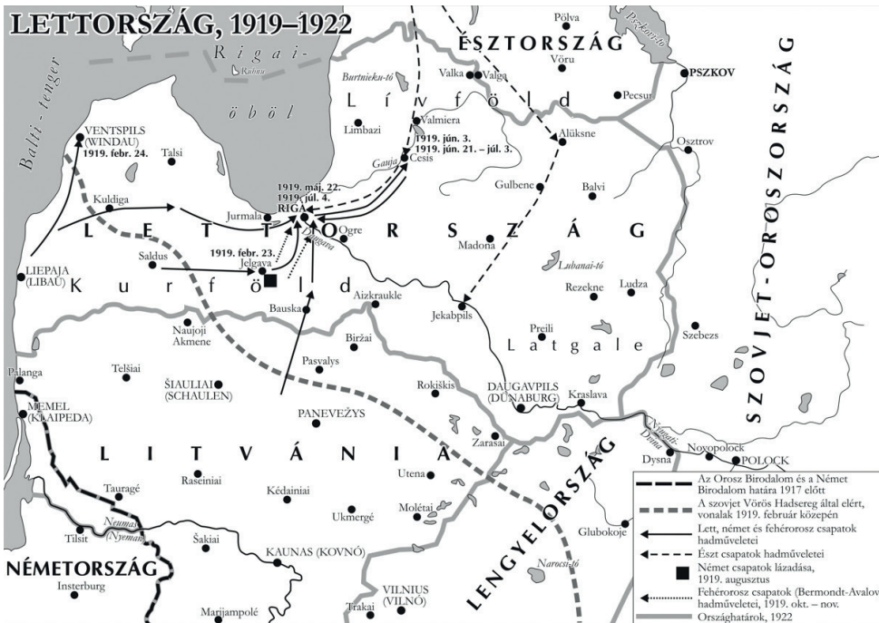
1.ábra: Lettország, 1919–1922

A németek, akik amúgy is erős fenntartásokkal viszonyultak a liepājai vezetéshez, szintén nem nézték jó szemmel, hogy a lett kormány nyíltan a nyugati szövetségesek felé orientálódik. Emellett szimbolikus jelentőségre tett szert a régió legnagyobb városának, Rigának a bevétele a balti német vezetők körében, ugyanis ezáltal remélték saját politikai helyzetüket megerősíteni, s emiatt nem akarták, hogy a város elfoglalásában az Ulmanis-kormányhoz hű csapatok is részt vegyenek. 9