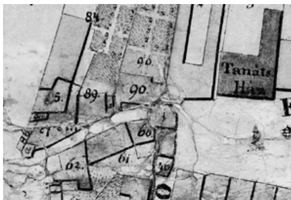
Az 1838/39. évi telekkönyvi térkép részlete az Alsókapu-torony, az előtte húzódó törtvonalú beépítés, az egykori védművek helye.

A másik két térkép, az 1838–1839-es Kovatsits-féle, 73 valamint az 1857-ben készült kataszteri térkép 74 magát a tornyot nagyjából azonos kiépítésben – észak-déli pozícióban, enyhén téglalap alaprajzzal – mutatja. Az 1857. évi részletesebb kiképzésű. Rajta a 62-es számmal jelzett toronytest nyugat felé egy hosszan elnyúló, elkeskenyedő épített résszel – a városfal gyilokjárójával – ami eszerint a kaputoronyhoz tartozott, kapcsolódik össze. Mindkét térképen érdemes figyelni a törtvonalú