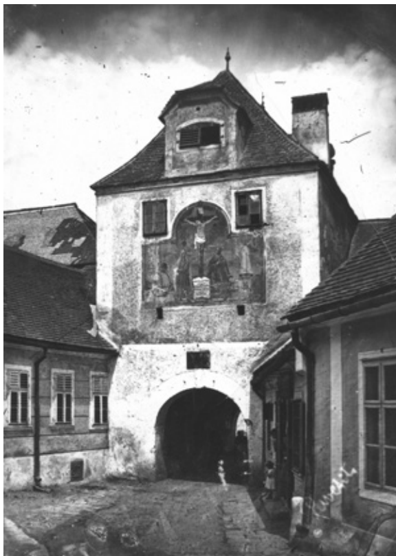
Az Alsókapu-torony külső, déli homlokzata a lebontás előtt. KVMKL Adattár 10085.

Mivel az Alsókapu-torony egészen a 19. század végéig állt, számtalan képi ábrázolásnak lett a tárgya. Szerencsés módon mindkét fő nézetéről több fénykép, festmény, akvarell és rajz született, ismert és ismeretlen szerzőktől. 80