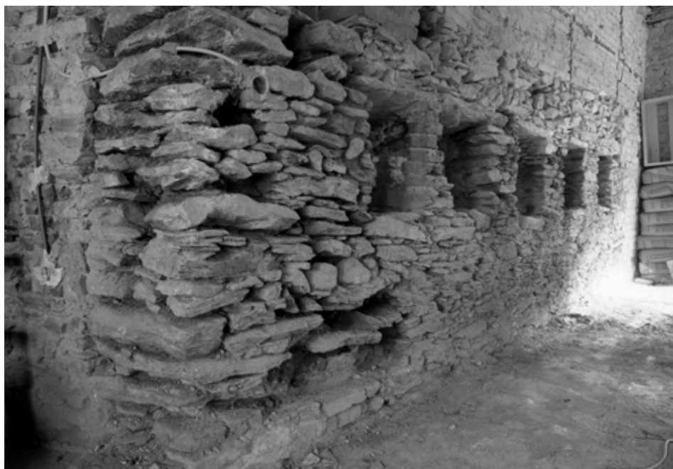
Fő tér 1. számú épület földszinti helyiségében feltárt lőréses elővédmű keleti falszakasza.

A város közel hét és fél évszázados történetének legismertebb mozzanata kétségkívül az 1532. évi török ostrom volt. 34 A siker záloga pedig Jurisics Miklós személye, aki egyfelől saját pénzét áldozta fel Kőszeg megerősítésére, másfelől személyesen irányította a védelmet. 35 A kaputorony kiemelt szerepét mutatja, hogy a romokban heverő város helyreállítási munkáinak sorában elsőként ezt a déli szakaszt erősítették meg, jelentős kibővítésekkel. 1533-ban Sylvester és Bernhart kőművesmes-