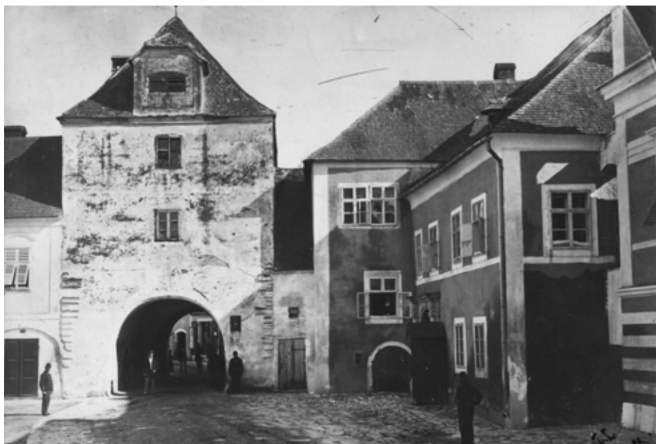
Az Alsókapu-torony belső, térre néző homlokzata lebontás előtt. Magántulajdon.

A képeket szinte ugyanabból a pozíciókból vették fel. Legtöbbjük a század végén, közvetlenül a lebontás előtt készült. Mindegyiken a már korábbról ismert, zömök megjelenésű, háromszintes, tetőtér beépítéses, keleti oldalán kéménnyel, cserépfedéssel ellátott épület jelenik meg. Kitűnik, hogy az 1746-os festményen látható Tornynosok számára kialakított erkélyt ekkora szilárd anyagúra cserélték, de valószínűleg már az 1808-as képen is ezt az állapotot lehet megfigyelni. A külső, déli homlokzaton csak a felső emeletet nyitja meg egy-egy ablak. Az alsó szinten az egykori láncos, csörlős híd fészkeinek helye épen maradt. A kettő között plasztikus keretbe foglalt festett kálvária jelenet látható, az az ábrázolás, melyet a források többször is említenek. A félköríves záródású kapu felett egy téglalap alakú tábla