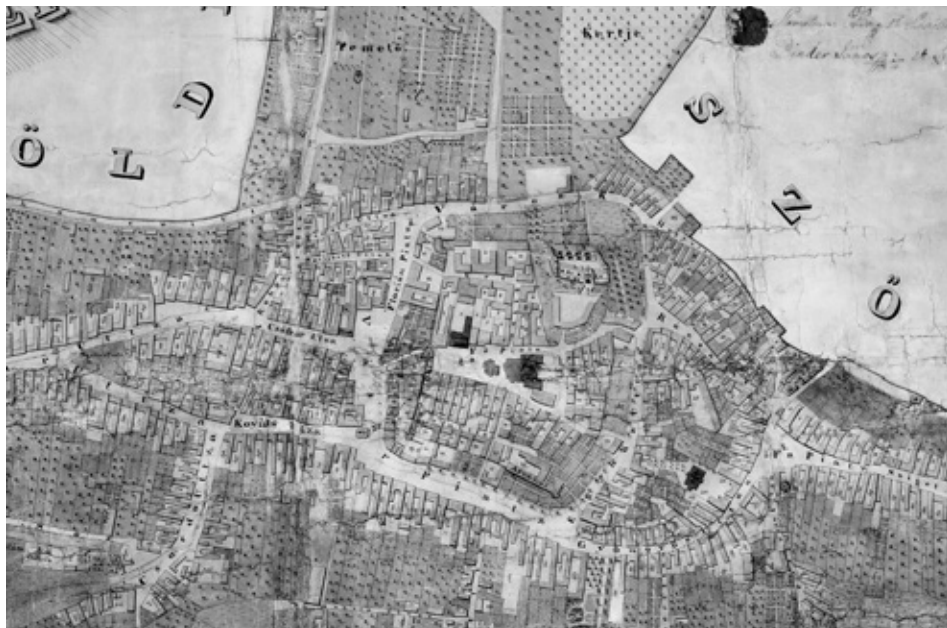
Kovatsits Zsigmond: Kőszeg 1838/39. évi telekkönyvi térképe. KVMKL ltsz. H. 56.264.1.

rezidenciális lakhelye. 12 Ennek a védelmi rendszernek mind szervezeti egységében, mind kiépítésében a fő hangsúly a kezdetektől mindig a városon volt. 13 A suburbium védelmének, egyben a belváros forgalmának legfontosabb objektuma pedig a lapályos déli oldalra nyíló, ma annak tengelyében álló városkapu volt.