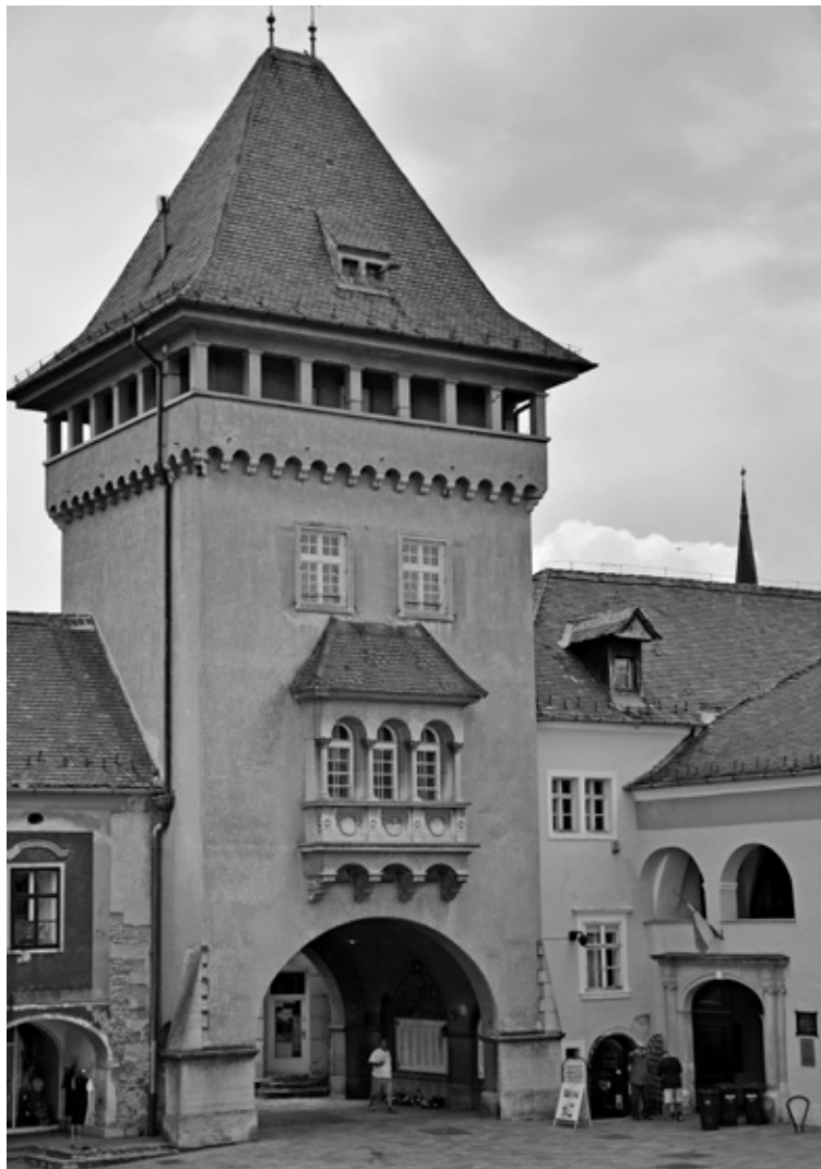
Hősök tornya, a térre néző északi homlokzat.

által tervezett Hősök tornya magasodik. 6 A városkapu élete, története, kiépítése a kezdetektől szorosan összefüggött magának a településnek az életével. Így ismertsége ellenére sem kerülhető meg ennek felvázolása.