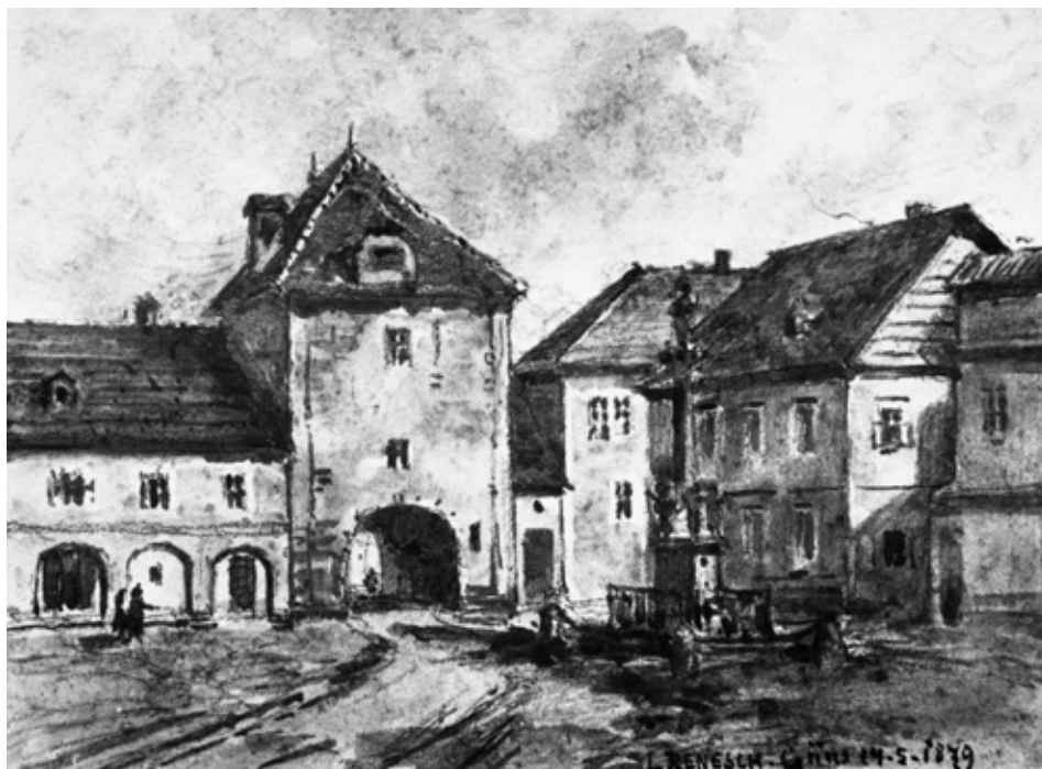
Az Alsókapu-torony és a Táborkoház között álló keskeny kapusház. Benesch L. vízfestmény 1879. MÉM MDK Fotótár ltsz. 190.643.

fél közötti egyezségben többek között kitértek a kapuk őrzésére, valamint azok éjszakai zárására is. 43 Az 1570-es évek elejére, közel négy évtizeddel az ostrom után, a kaputoronyhoz felvezető főút olyan rossz állapotba került, hogy a belvárosba igyekvők szekerei elakadtak a sárban, ami igen érzékenyen érintette a piac forgalmából élő várost. Kijavítására az Alsó-ausztriai Kamara 1571. július 21-én adott utasítást. 44 A városi védelem felépítésének legfontosabb dokumentuma az öt évvel később, 1575. évben felállított Musterregister, az ún. Sorozólajtrom. Eszerint az „Vndters Stattor” néven felvett torony védelmét jelentős létszámú őrség (3 ferálymester, 4 tizedmester, 42 beosztott tizedlegény, összesen 49 fő) és fegyverzet