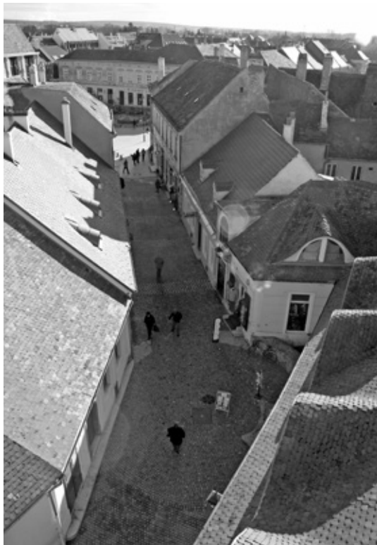
A tört vonalú Városház utca kövezetében bemutatott íves lezárású barbakán.

Nagy területre kiterjedő feltárást – egy lakóépület (Városház u. 1.) felújításához kapcsolódva – a területileg illetékes múzeumnak nyílt alkalma végezni 1991–1992-ben. 28 A városkaputól dél felé kivezető Városház utcában feltárt, jelentős méretű, kőből épített, félkörívvel záródó, nyaktaggal a védműhöz, illetve annak „előépítményéhez” toldott barbakánt a kutató a 16. század közepére keltezte. 29 Magának az Alsókapu-toronynak és a hoz-