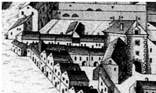
Kőszeg látképe 1808. Karl Schubert metszete. Részlet a belváros déli részével és a kaputoronnyal. KVMKL Kőszegi Rajziskola Iratai I. dob. 3.

A hat évtizeddel később, 1808-ban készült Karl Schubert metszete pontosan az ellenkező