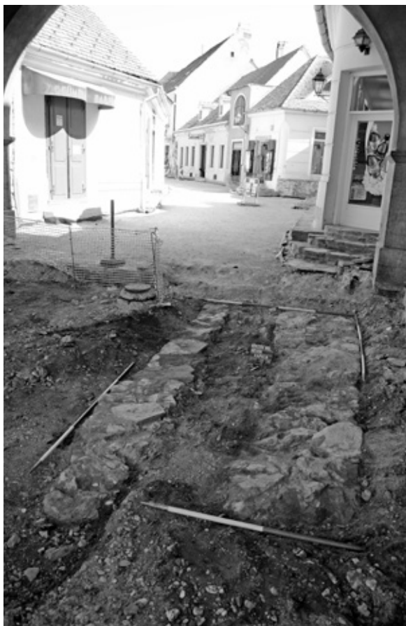
Az Alsókapu-torony nyugati falszakasza, mögötte a Városház utcában a bemutatottbarbakán.

putorony megismerésről hosszú időre le kell mondani. Az 1880-ban lebontott épület azonban már egy későbbi építkezés maradványa volt. Egy olyan korszaké, melynek „nagyberuházásait” erősen meghatározta a város ismét megváltozott státusa. Közeg két évszázadon keresztül, 1447–1647 között a Magyar Királyság részeként, de koronázálogon Habsburg zálogbirtok volt. 32 A Bécs közelségében fekvő telepü-