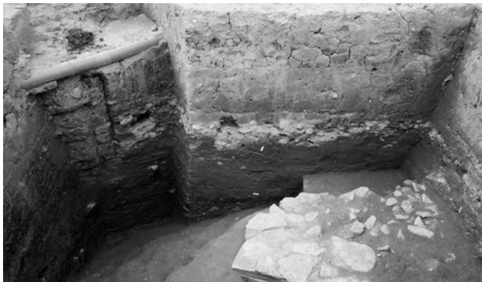
Fő tér-Városház utca sarok. A feltárt cölöpszerkezetes vizesárok részlete.

a kulcsfontosságú városkapu közvetlenül a vizesárokkal körbevett egykori város északkeleti sarokpontjának közelébe? 22 Ennek tisztázása a további kutatás feladata.