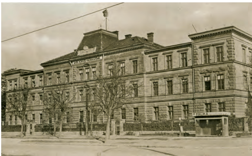
1. kép. A Hadiakadémia főépülete