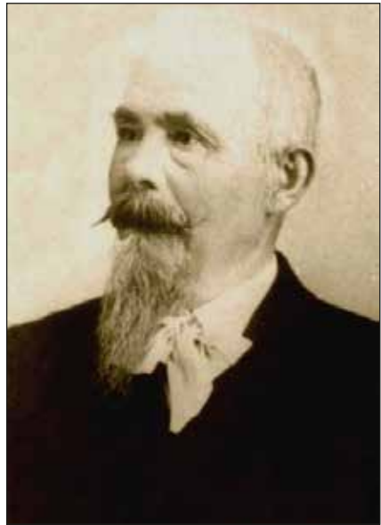
Óváry Lipót portréja.

Garibaldi hadjáratának emléke élénken élhetett Óváryban későbbi évei során is. 1862-ben, Nápolyban született gyermekének a Vincenzo Giulio Garibaldi nevet adta, a legérdekesebb megnyilvánulása mégis az, hogy évtizedekkel később A magyar légió Olaszthonban címmel egy színművet is írt, amelyet 1885-ben Budapesten Füleky Miklós társulata színpadra vitt. A színmű a magyaroknak a délolasz brigantik ellen vívott harcait 18 mutatta be, nagy várakozás előzte meg, 19 azonban leújtó kritikákat kapott. 20 Innentől kezdve irodalmi téren inkább csak fordítással foglalkozott. 21