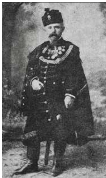
A tudós fotója.