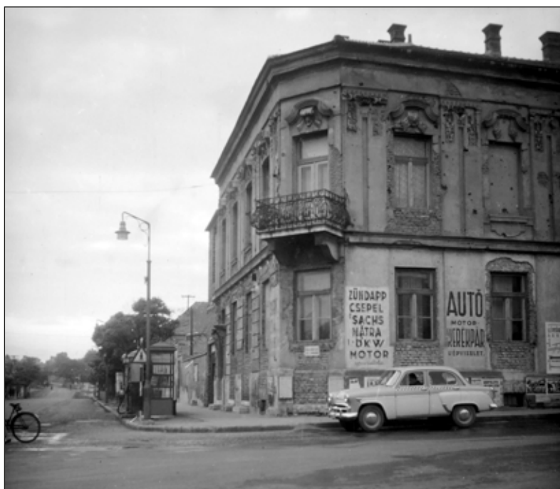
A mára elbontott szülőház (Kossuth utca 24.).