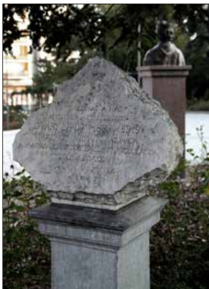
Óváry Lipót emléktáblája a Szent Imre téren.