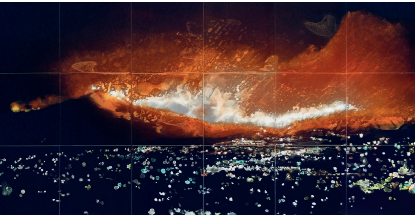
Mayer Éva: Főtitrök I. (az alkotó engedélyével)