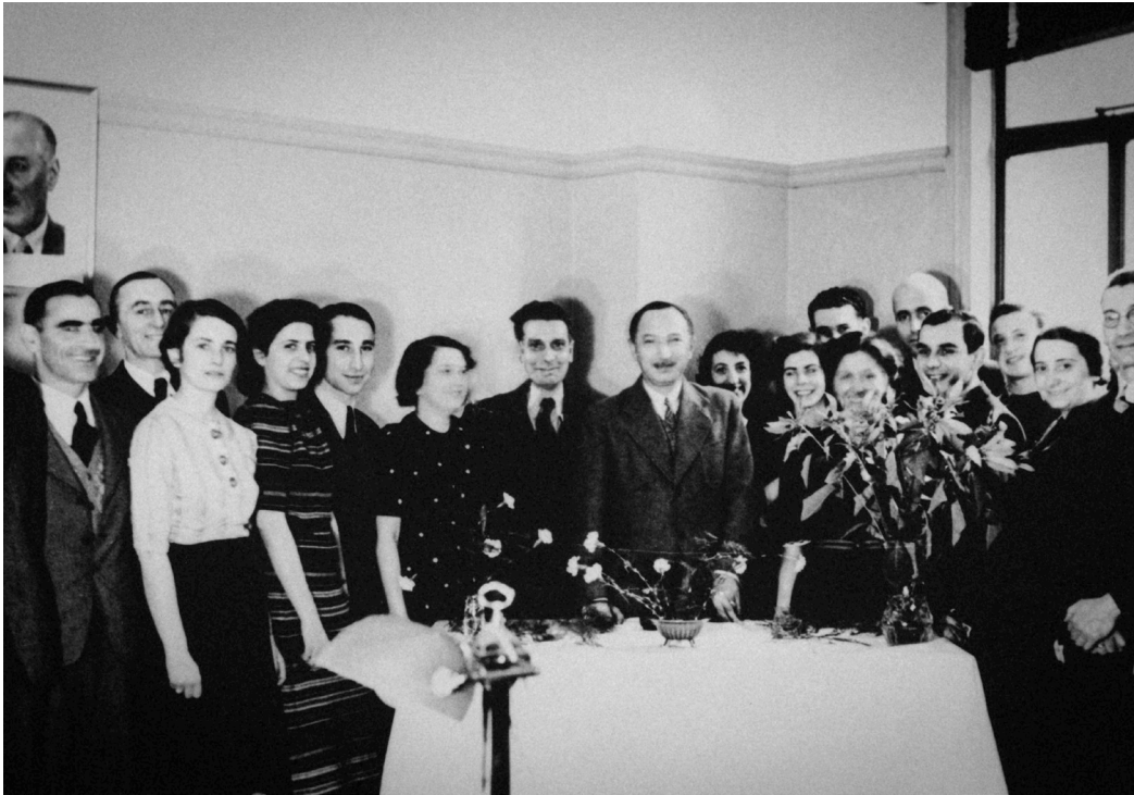
7. kép. Csoportkép az I.C. (International „Komor” Committee) tagjaival.