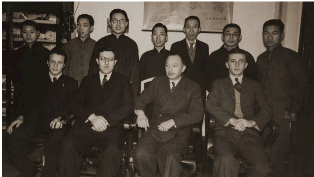
6. kép. Csoportkép kollégákkal.

1938 után a magyarországi antiszemita törvényhozás taszító, illetve a náci üldöztetés nyomán Sanghajban felbukkanó közép-európai emigránsok problémájának vonzó hatására Komor figyelme egyre inkább a városban megszervezendő zsidómenekült-segély felé terelődött. A saját állampolgárságát elveszteni látszó magyar hazafi nem tudta hibáztatni antiszemitizmust elutasító társait, amiért azok sorra hagytak fel a Segélyalap támogatásával. Amikor a hamarosan tiszteletbeli konzullá kinevezett és az 1940 óta működő japánokkal kollaboráns kínai bábkormány által is akkreditált „őskezresztény” Hugyecz László vezette rivális csoportosulás átvette a magyar közösség vezetését, Komor energiáinak nagy részét már az új menekültválság kötötte le.