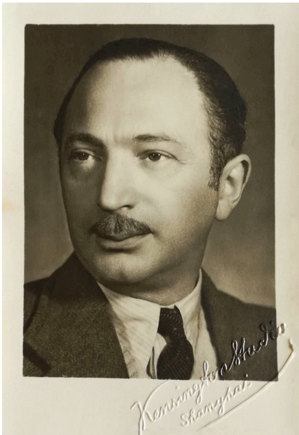
11. kép. Komor Pál-portré 1940-ból.