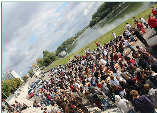
1. ábra: Szegedi rakpart

2018 szeptemberében egy újabb lépést tettünk: 150 oktatófantom segítségével 982 laikus sajátította el az alapszintű újraélesztés lépéseit ( 1. ábra ). Ezzel szeretettük volna még inkább hozzáférhetővé tenni a BLS gyakorlatát azok számára, akik a legfontosabb pillanatokban segíteni tudnak. Az esemény lebonyolításában és az oktatásban a szegedi sürgősségi osztály szakdolgozói és szakorvosai vettek részt.