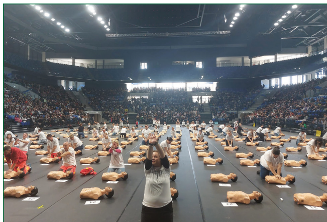
3. ábra: Szegedi Pick Aréna

2023. október 16-án, a Szegedi Pick Arénában ismételt rekordkísérletet tartottunk. Ezen a rendezvényen összesen 7351 fő, általános és középiskolás diák sajátíthatta el az elsősegélynyújtás, különösen a BLS alaplépéseit. A képzés oktatásában oxiológusok és sürgősségi szakápolók vettek részt ( 3. ábra ).