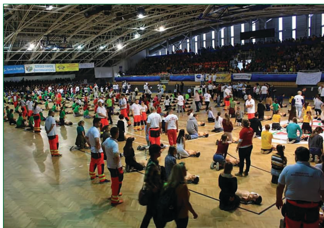
2. ábra: Szegedi Sportcsarnok

2019. október 16-án, az Újraélesztés Világnapja alkalmából egy újabb nagy eseményt szerveztünk. 200 oktatófantomon három nagy szegedi gimnázium, a Radnóti Miklós Gimnázium, a Deák Ferenc Gimnázium és az SZTE Báthory István Gyakorló Gimnázium és Általános Iskola diákjai mérhették össze tudásukat. A rendezvényre összesen 2450 fő regisztrált, és a győztes a Szegedi Radnóti Miklós Gimnázium lett 620 diákkal, nyereségük egy AED-készülék volt. Az oktatáson részt vettek még a katasztrófavédelem, a rendvédelmi szervek, a honvédség és a Szegedi Tudományegyetem Egészségtudományi és Szociális Képzési Karának hallgatói is. Az oktatásban részt vett az Országos Mentőszolgálat és a szegedi SBO ápolói csapata ( 2. ábra ).